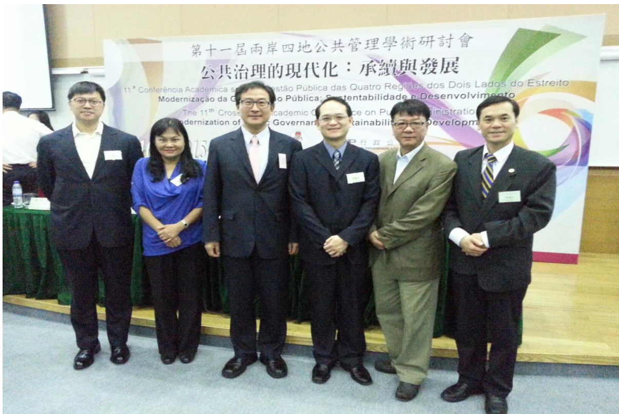
圖 2 本代表團於大會會場上合影留念