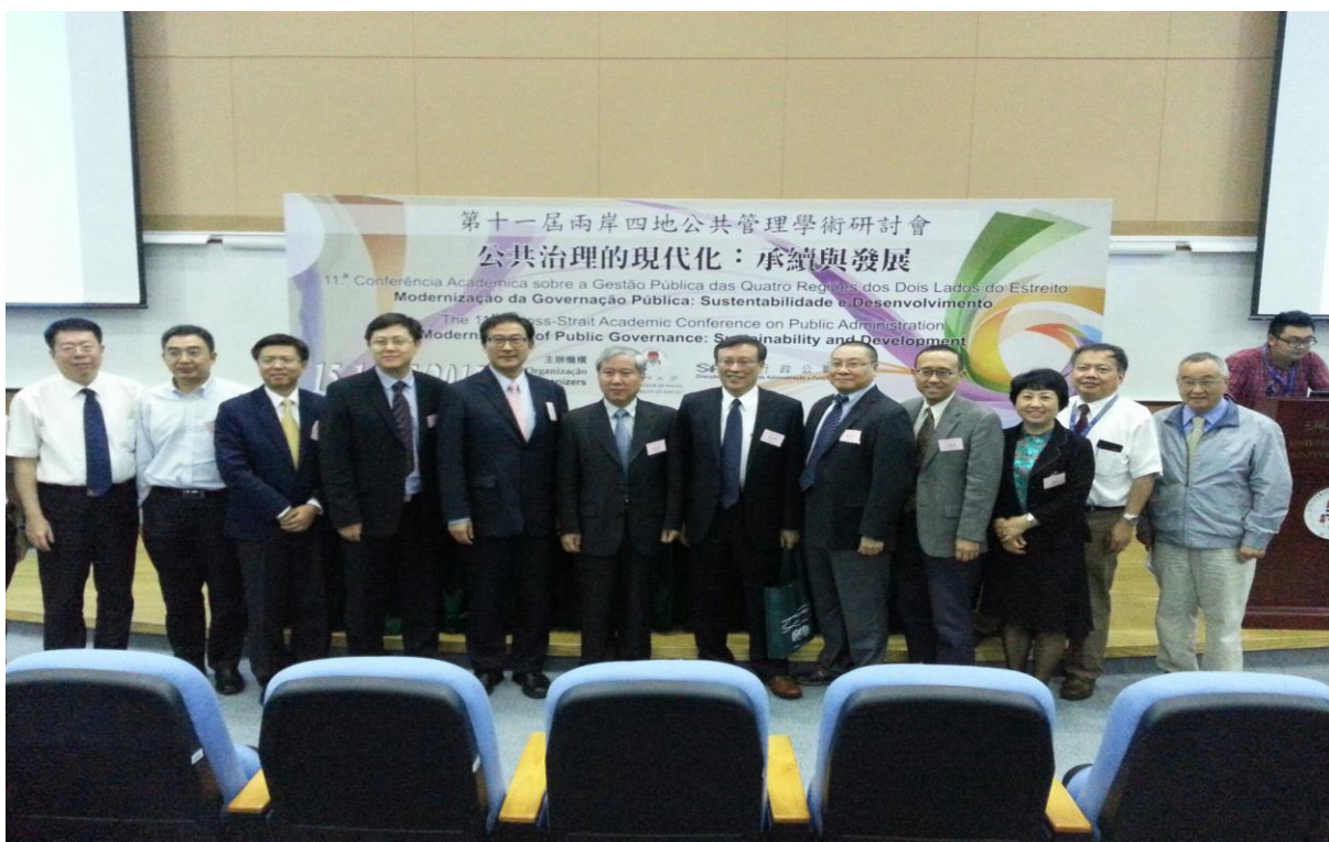
圖 3 本代表團長與大會委員會成員合影留念