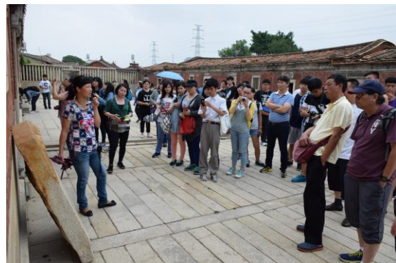
參觀蔡厝其它古厝