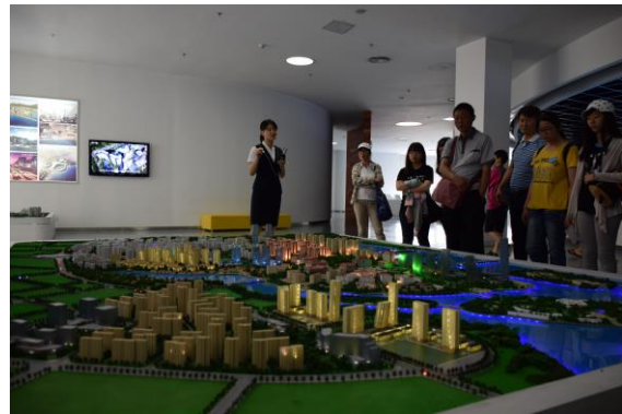
展覽館人員說明廈門城市發展(I)