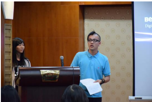
都景系同學心得分享(II)