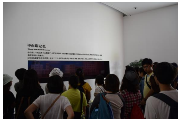
展覽館人員說明廈門城市發展(III)