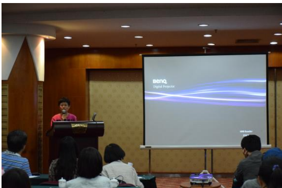
國務系華攸博同學報告