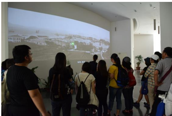
具有動畫性質的歷史圖片展