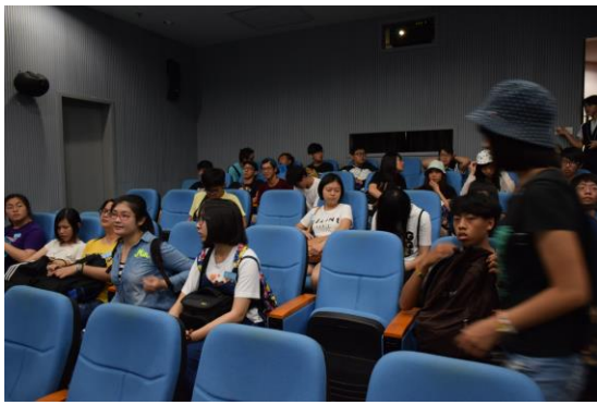
師生於展覽館內觀賞影片