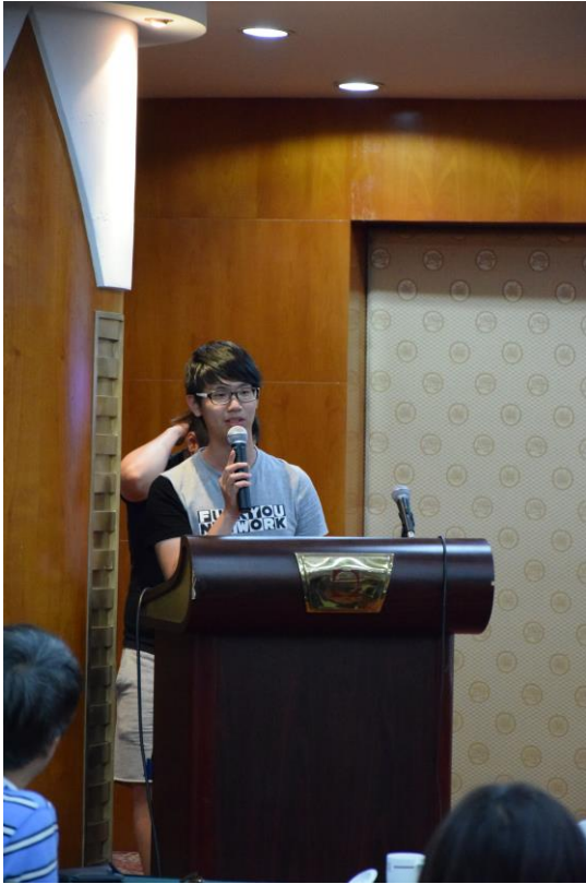
都景系同學心得分享(I)