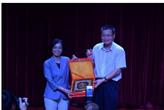
兩校院長交換禮物