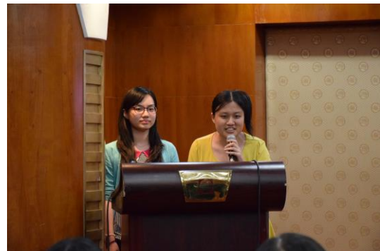
華文系同學心得分享(II)