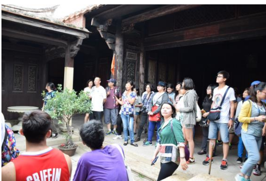
在中庭說明蔡厝空間格局