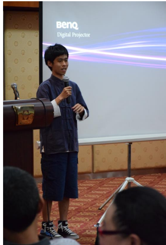
華文系同學心得分享