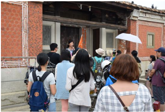
參觀蔡厝，入口處說明蔡厝歷史