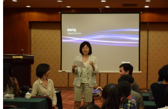
閩南所戚主任說明宗教與空間的關係