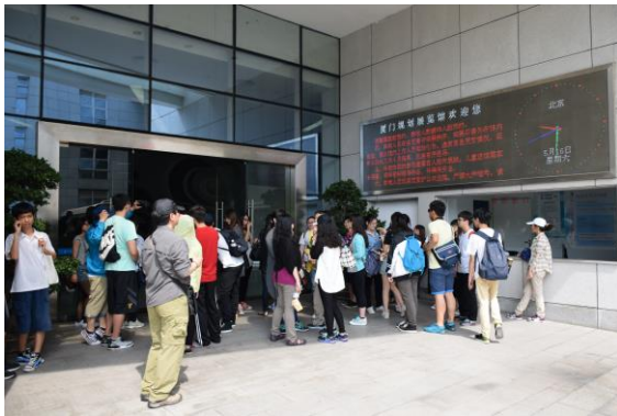
本校師生魚貫進入城市規劃展覽館