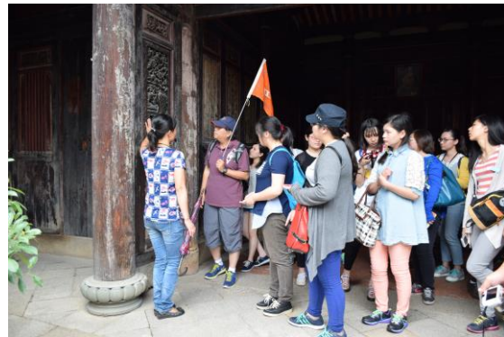
說明蔡厝樑柱的材料