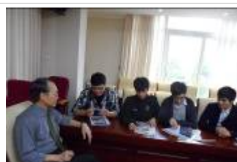
與河內師範大學學生交流