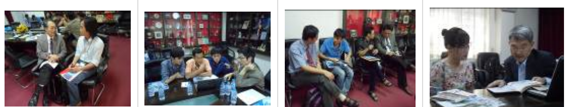
與胡志明市百科大學互動

綜觀來看，胡志明市百科大學學生屬性較類似臺灣的科大，重視實務能力，工程背景(電機、土木、機械)背景學生多。學生單純、樸實，唯因為是類科大背景，英語普遍不佳，雖有許多學生嚮往臺灣留學，但因英語能力有限與我方教授溝通不甚順暢，應請學生優先加強。