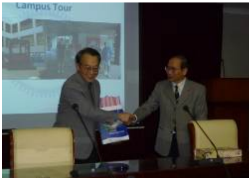
雙方代表互贈紀念品