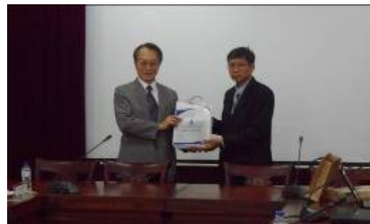
雙方代表互贈紀念品