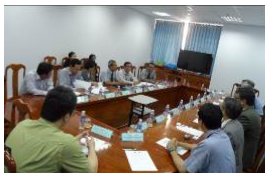
與芹苴大學代表師長交流

雙方首先介紹與會代表師長，說明今日參訪流程及議題。Dr. Dzung 表示，本校到訪時間為農曆正月時期，本校是第一個於正月期間拜訪該校的參訪團，該校表示熱烈歡迎。該校師長曾多次拜訪本校，與本校工學院師長有多次深入交流，故本次參訪也希望能促進雙邊科研合作交流。會議交流結束後進行禮品交換及合影，並由各院代表師長將本校代表團分別引導至相關學院進行後續參訪及與學生面談行程。