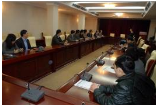
與河內師範大學代表交流