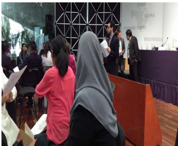
分組研討及實務演練（二）