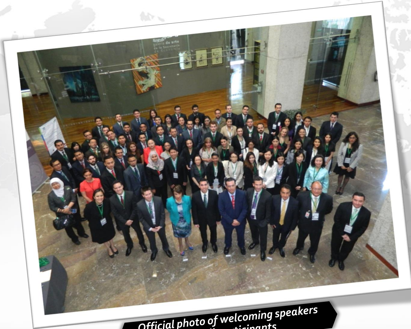
Official photo of welcoming speakers and all participants