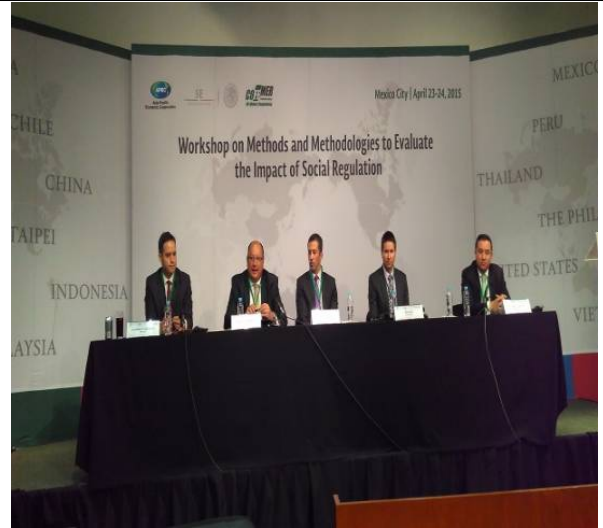
OECD 及 APEC 專家致詞