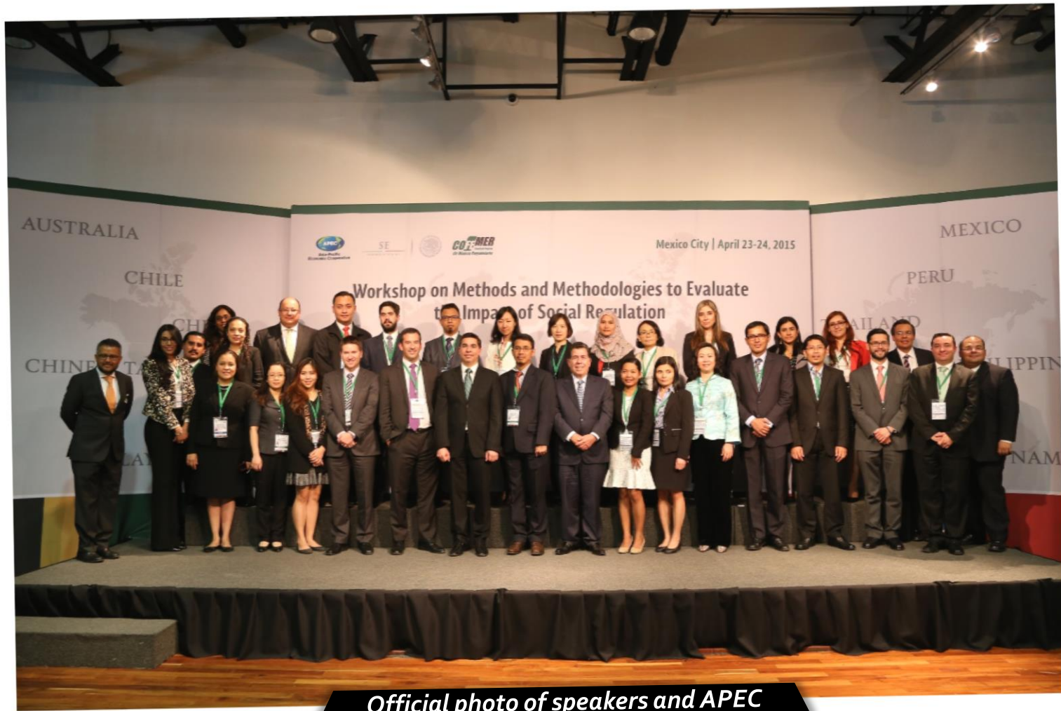
Official photo of speakers and APEC participants