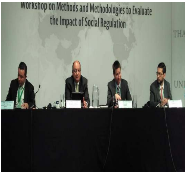
OECD 及 APEC 專家與會指導