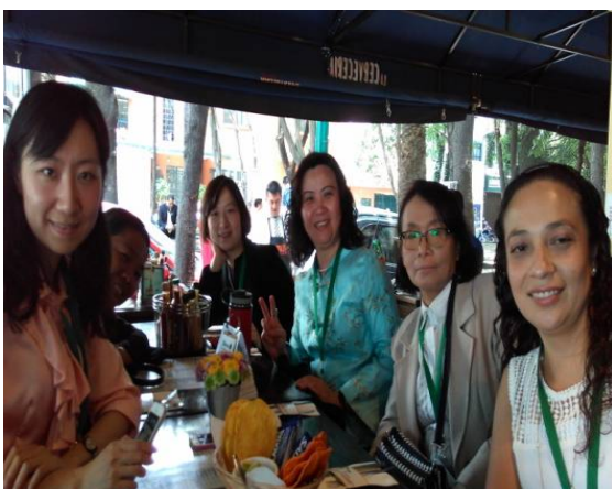
我國代表與各國代表午餐會議