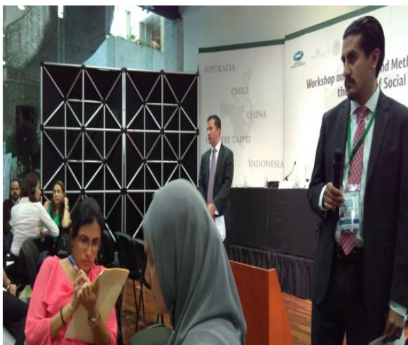
分組研討及實務演練（一）