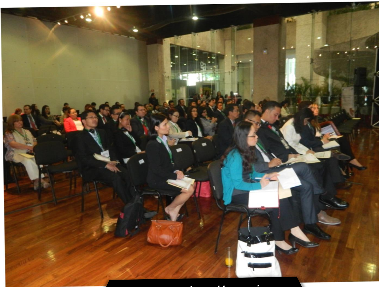
Participants in working sessions