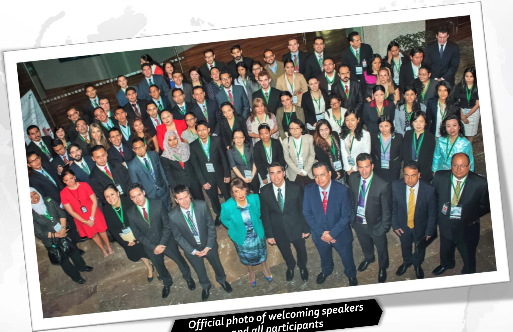
Official photo of welcoming speakers and all participants