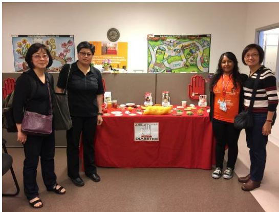
三位教師與 ADA 工作人員及食物模型合影