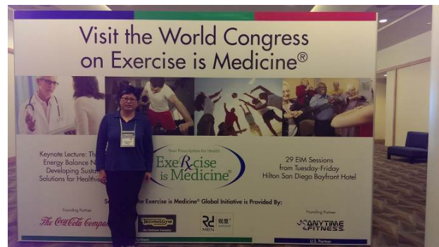
會場中的 EIM 大型看板