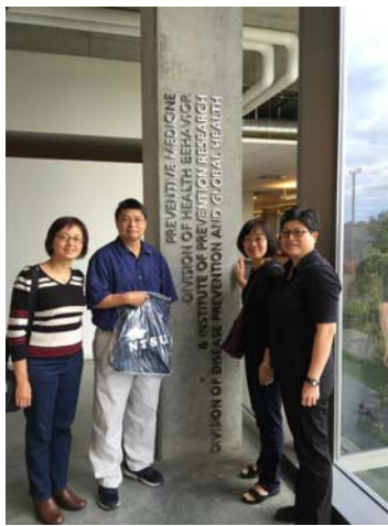
三位教師與周教授於學院招牌前合影