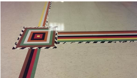
走廊地面上以不同顏色線條引領行進方向