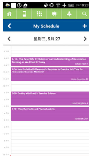
利用研討會 APP 進行行程規劃