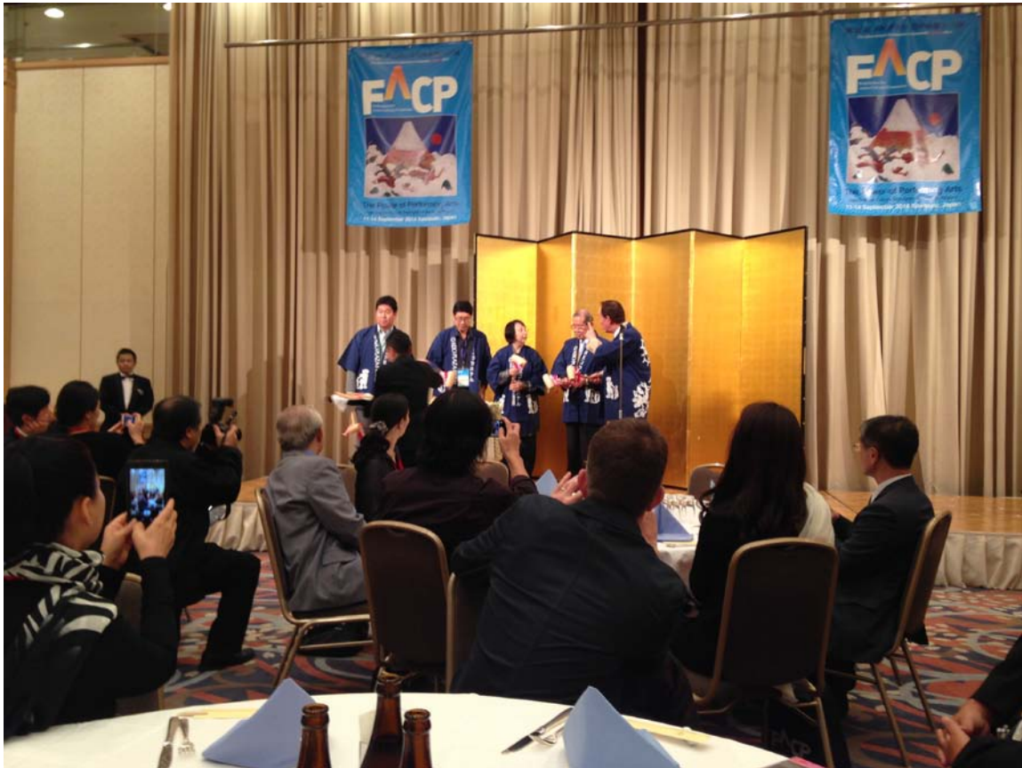
圖五 京王廣場大酒店歡迎晚宴