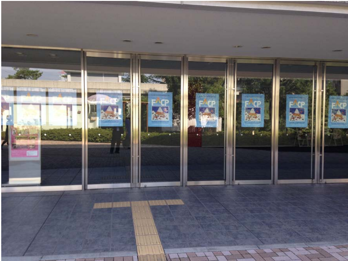
圖七 昭和音樂大學活動會場外