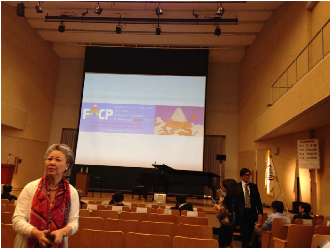
圖八 「舞台表演藝術的力量-學習亞洲各國的文化戰略」研討會現場