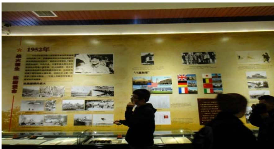
圖 14：哈爾濱工程大學-哈軍工紀念館。