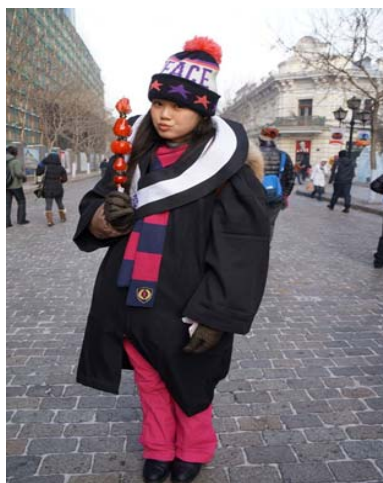
圖 19：品嚐著當地著名的「冰棍」以及因為氣候寒冷而結成草莓冰的糖葫蘆。