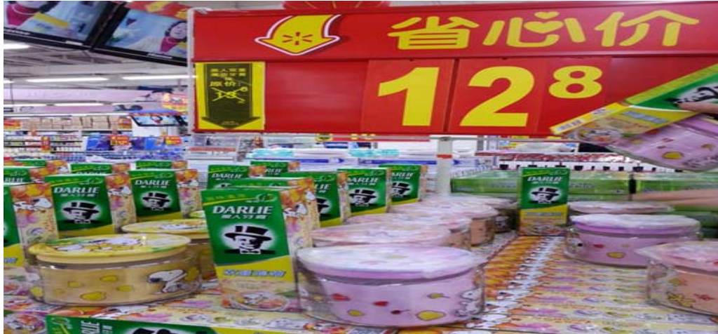
圖 8：哈爾濱市的超市所看到的商品。