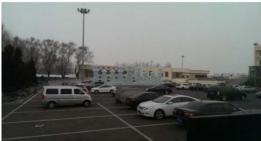
圖 4：已下哈爾濱機場就看到漂亮的冰雕。