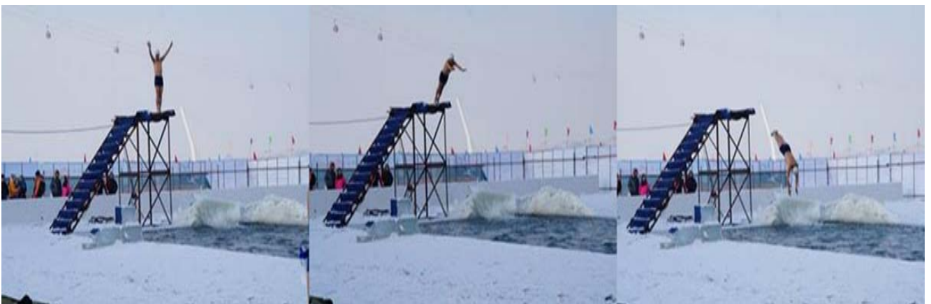
圖 22：表演者縱身一躍進入冰池，親眼見證了不可思議的冬泳表演。