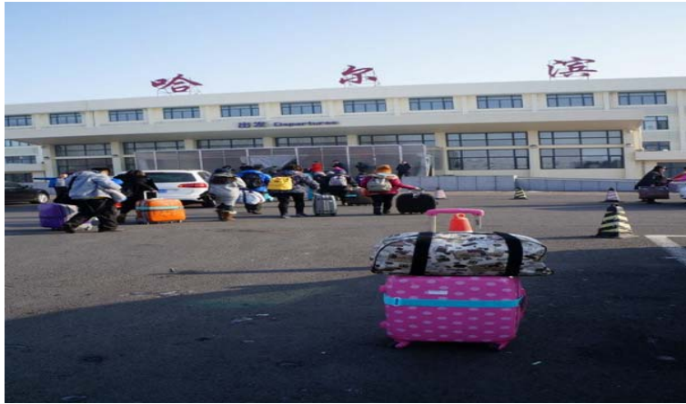
圖 48：前往哈爾濱太平機場。