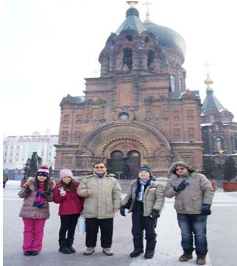
圖 17：哈爾濱著名景點——聖·索菲亞教堂本校學生與領隊教授合照。

了！覺得無限興奮，就算手凍也忘不了要瘋狂拍照留念。最後，也買了俄羅斯巧克力當伴手禮拉。冰城為今日畫下美麗的句點，也成為美麗的回憶。