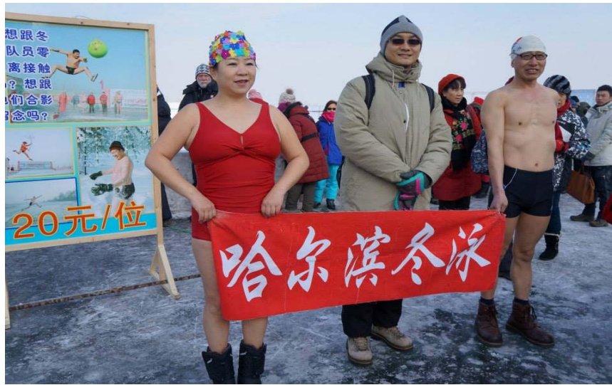
圖 20：冬泳表演者與領隊教授合照。