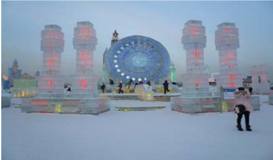
圖 26：哈爾濱著名景點——冰雪大世界，已進去就看到很多美麗又漂亮的冰雕-1。