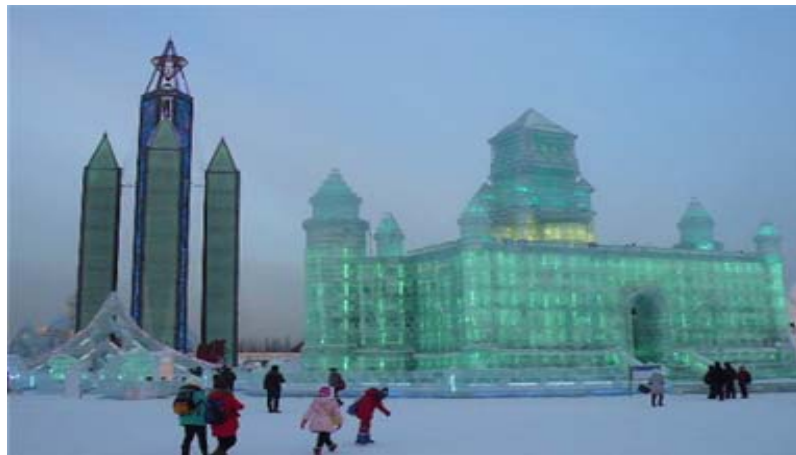
圖 25：哈爾濱著名景點——冰雪大世界，已進去就看到很多美麗又漂亮的冰雕。