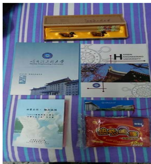
圖 7：哈爾濱工程大學所發的學校介紹簡與行程表還有很重要的暖暖包。