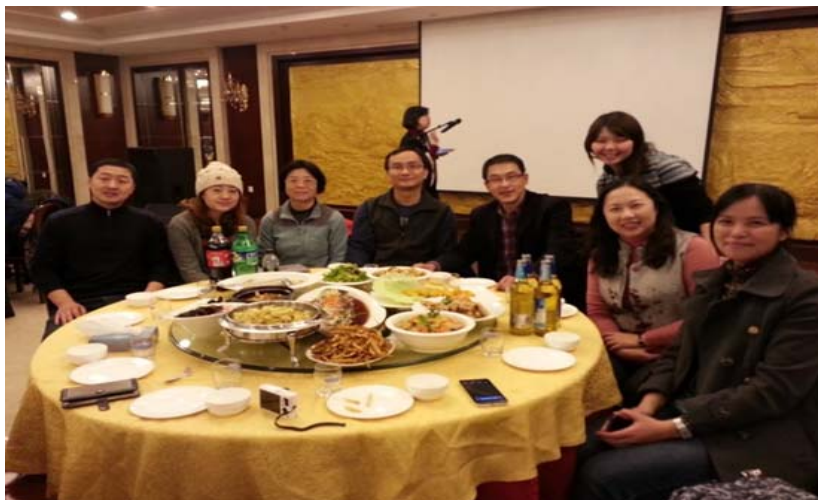
圖 45：哈工程老師與各所學校的老師晚宴上的合照。