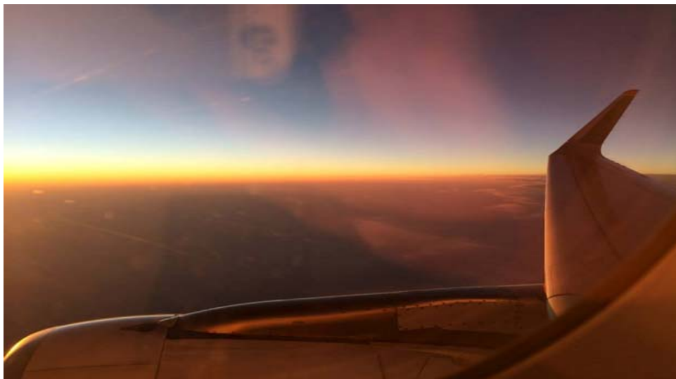
圖 52：我們在飛機上，所拍的風景超漂亮了。