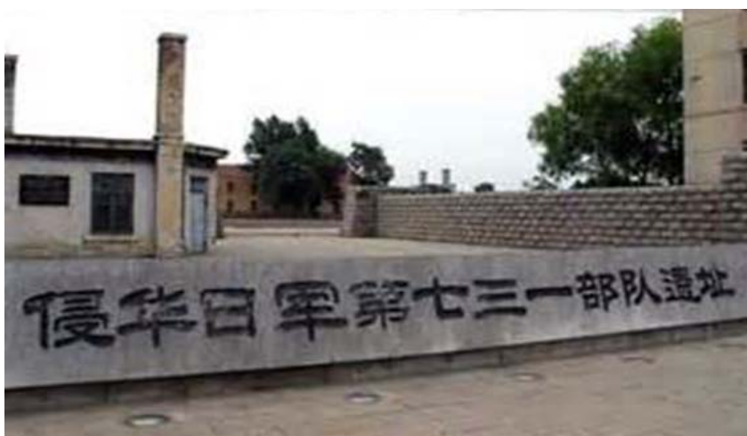
圖 32：我們去參觀日本時期，日本人在哈爾濱做實驗時的 731 部隊罪證遺址。