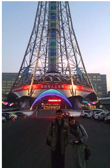
圖 41：哈爾濱著名景點——龍塔，本校學生與哈工程學生的合照。