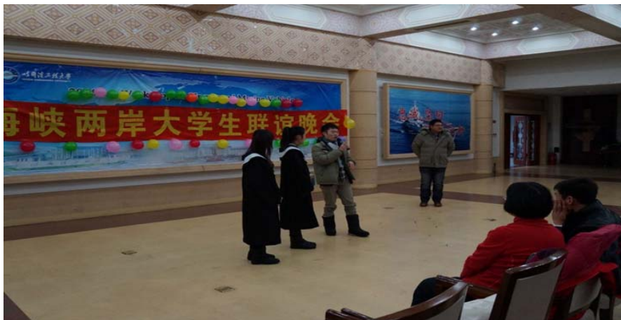
圖 15：兩岸的師生文藝聯歡晚會。