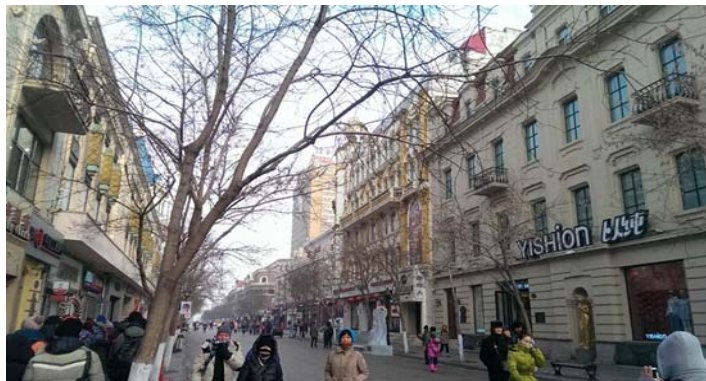
圖 18：哈爾濱著名景點——中央大街，是哈爾濱最繁華的商業街。