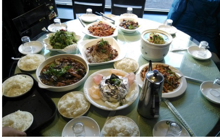
圖 40：中午前往品嚐傳統好吃黑龍江菜。