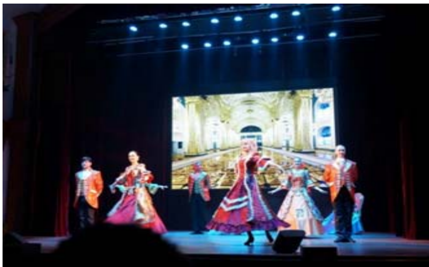
圖 31：伏爾加莊園，園區裡面的俄羅斯舞者輕快的舞步感受濃烈的異國風情。