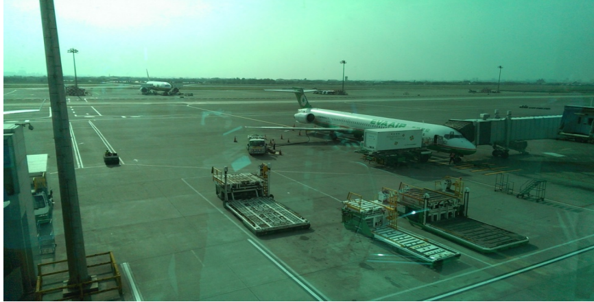
圖 2：在桃園國際機場等待起飛室休息。