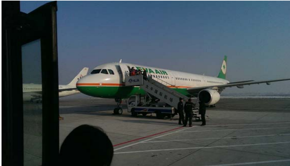
圖 51：從哈爾濱飛往臺灣的飛機。