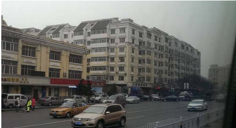
圖 5：哈爾濱市的街景。