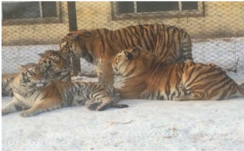
圖 24：哈爾濱著名景點——東北虎林園裡面的東北虎，每一隻都很漂亮。