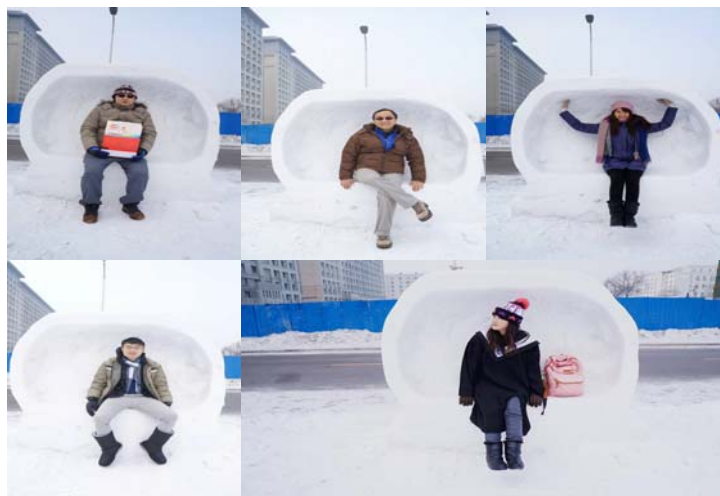
圖 47：我們早上來跟各所學校雕的雪雕一起拍照。

隨後我們便前往哈爾濱太平機場，並由隨隊的志願者替我們送機，機場有大量的人群，車水馬龍，也相對是在東北地區規模極大的機場。然這幾日與志願者的相處，讓我們的感情昇溫，因此，當我們彼此要分別時，內心是充滿不捨，志願者給予了我們一個很大的擁抱，我們永遠也不會忘記哈爾濱，不管是在當地的人事或物，也會記得我們曾經在哈爾濱，與兩岸的大學生，一起度過的這七日。