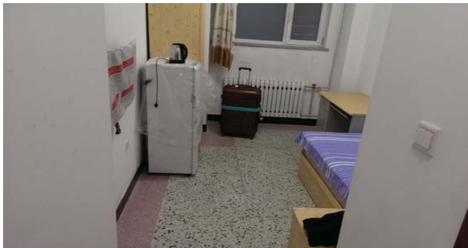
圖 6：哈爾濱工程大學留學生公寓我們住的房間。