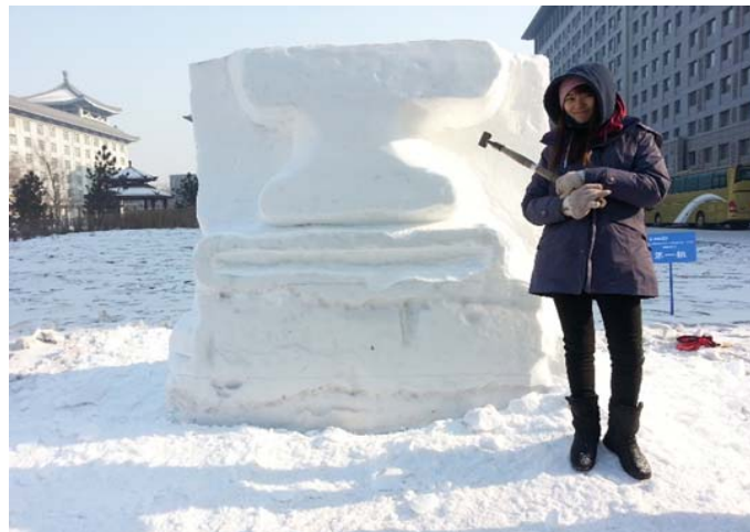
圖 35：這是我們雕可愛版的復活島人像，形狀慢慢出來了。