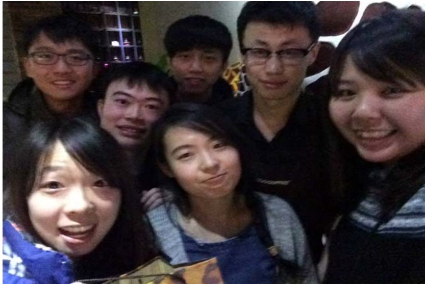
圖 43：本校學生與中原大學學生還有哈工程學生的在 ZOO COFFEE 合照。