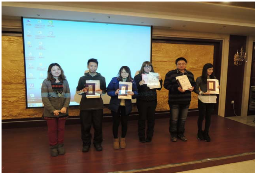
圖 44：送別晚宴加上雪雕競賽進行頒獎儀式。