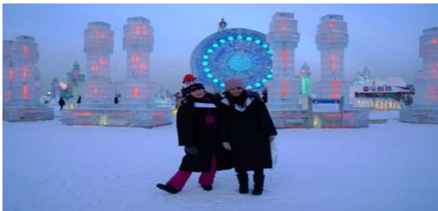
圖 28：哈爾濱著名景點——冰雪大世界，本校學生與很多美麗又漂亮的冰雕合照。