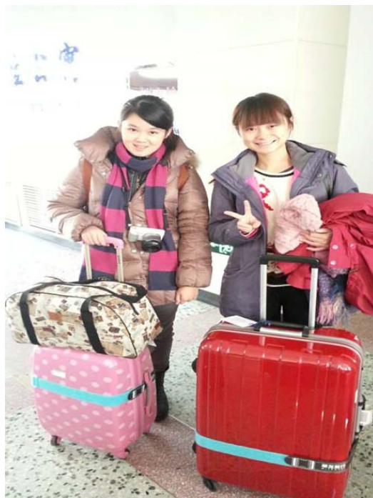
圖 49：我們要準備回臺灣了，哈工程的同學與老師再見。