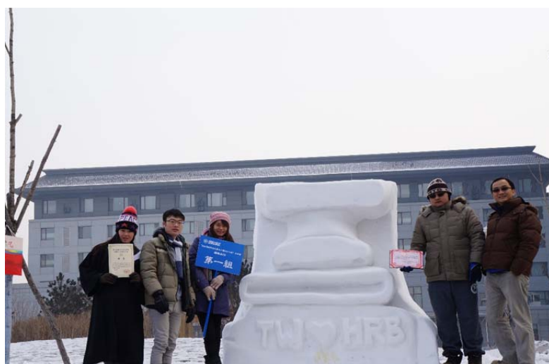
圖 38：我們在這次雪雕比賽拿到的第三名，真開心~。