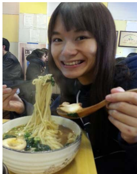
圖 36：我們雕到中午肚子都餓了，所以今天中午吃日式拉麵，超好吃的。