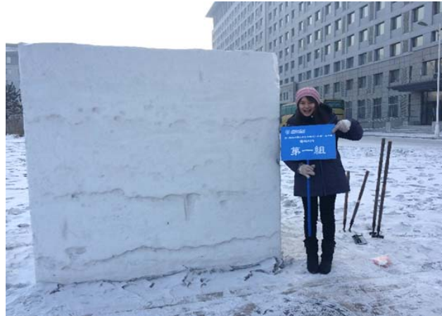
圖 34：這是我們今天要雕的超級大雪塊。