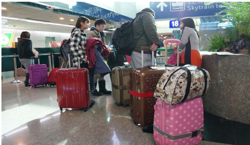
圖 1：在桃園國際機場與這次承辦我們學校的旅行社拿飛機票辦理登機。

當我們一群來自不同學校的學生提著大包小包的「戰利品」，走在寒冷的雪地之中，回程的路上我們很幸運地見到下雪的景象，走在地上「刷——刷——」的聲音，路旁被雪覆蓋皆成為白色汽車的景象，無一不讓人感到新奇。這些在雪地中所擁有的經驗與回憶，是交流活動第一天美妙的收穫。