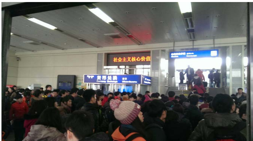
圖 50：哈爾濱太平機場出境大廳。