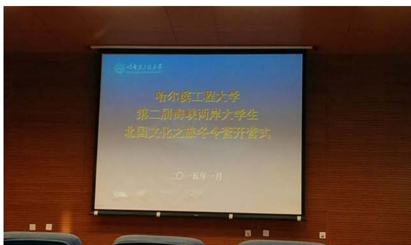
圖 10：哈爾濱工程大學-第二屆海峽兩岸大學生北國之旅冬令營開幕式。

傍晚的文藝聯歡晚會，感受到哈工程師長的精心策劃，場地中五顏六色的氣球展現青春洋溢的氣息，現場氣氛也在哈工程學生準備的開幕表演堆疊到最高點！我們暨大的團隊在程教授的鼓勵之下集思廣益，精心準備一段表演，展現了臺灣埔里的好山好水與暨大獨特的優點，讓兩岸的師生能透過幽默風趣的情境短劇，認識暨大之美，希望藉此促進彼此之間的友善交流與對在地文化特色產生共鳴。除了感受到各校的活力演出，我們也透過一連串的康樂性活動認識姊妹校的學生，交換事先準備的禮物，分享禮物背後的故事以及彼此不同的生活經驗，並誠摯邀請對方蒞臨學校，因此達到了交流的真諦。