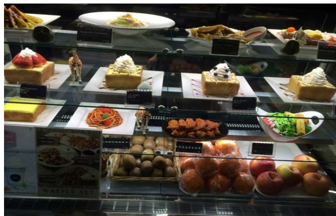
圖 42：前往 ZOO COFFEE 享用當地甜點咖啡店所提供的西式甜點與咖啡。