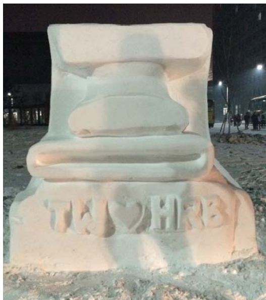
圖 37：終於我們完成可愛版的復活島人像，你們看是不是很可愛又很 Q。