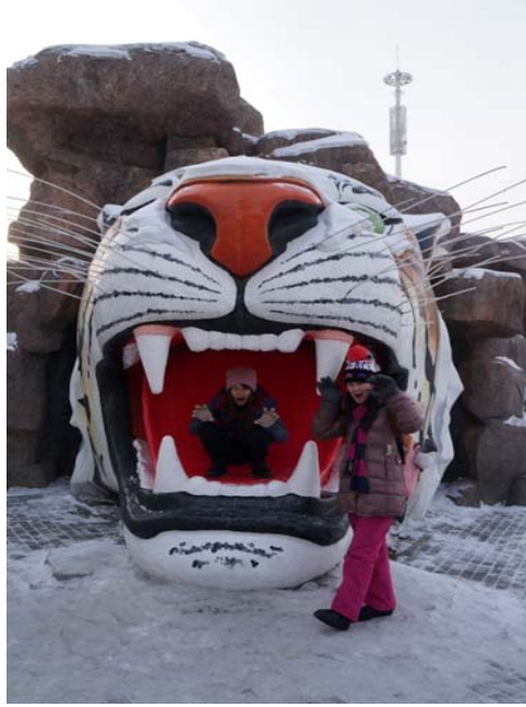
圖 23：本校學生與東北虎林園外面的虎頭合照。