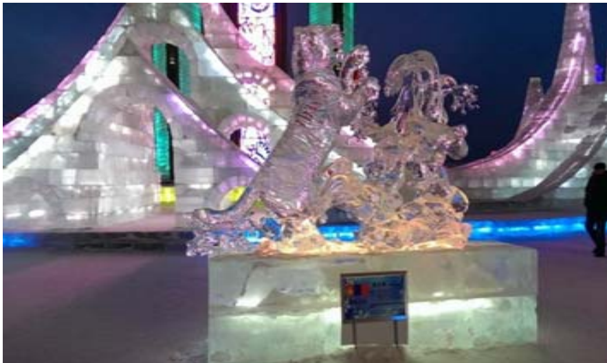
圖 27：哈爾濱著名景點——冰雪大世界，已進去就看到很多美麗又漂亮的冰雕-2。