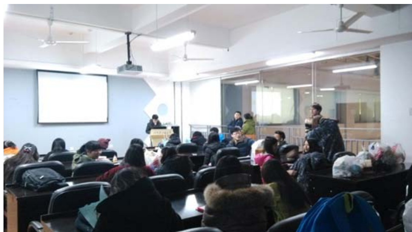
圖 33：雪雕制作培訓會，教我們怎麼製作漂亮又好看的雪雕。