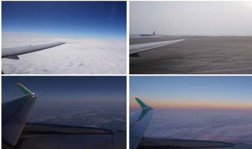
圖 3：在飛機上所拍的美麗風景。