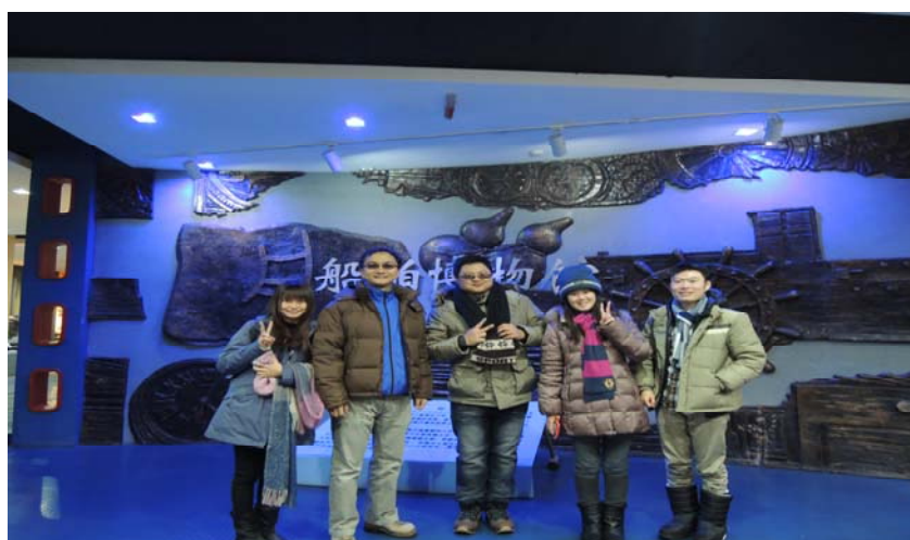
圖 11：哈爾濱工程大學-船舶博物館。