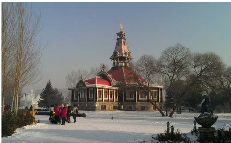
圖 30：哈爾濱著名景點——伏爾加莊園，園區裡面有很多漂亮的俄式建築群。