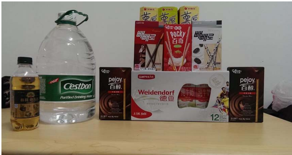
圖 9：在哈爾濱市的超市所買的戰利品。