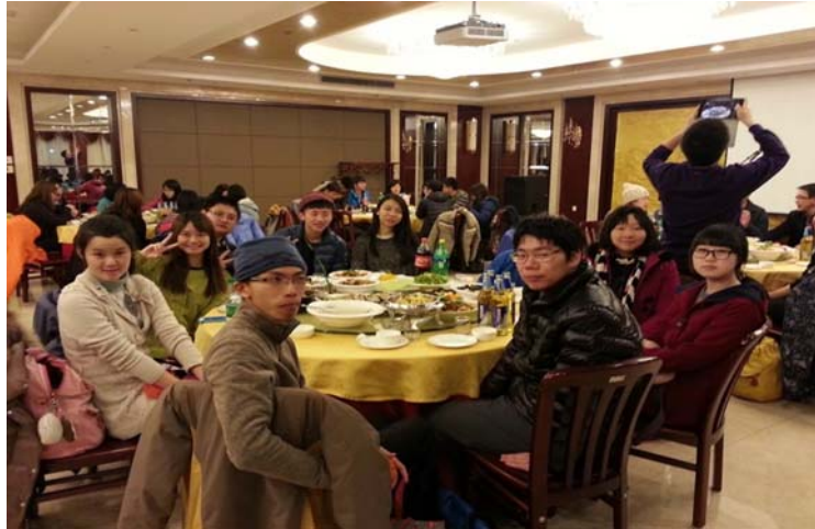
圖 46：晚宴上本校學生與哈工程學生與各所學校的學生的合照。