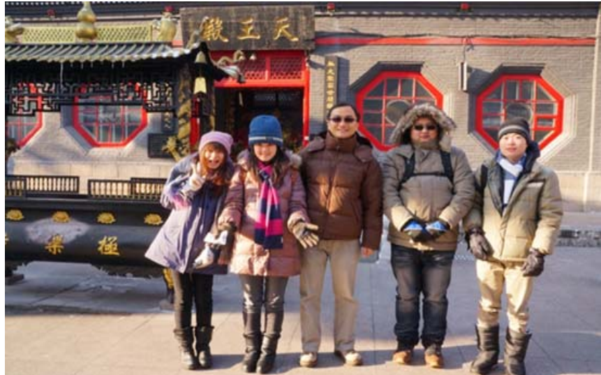
圖 12：在極樂寺本校學生與領隊教授合照。