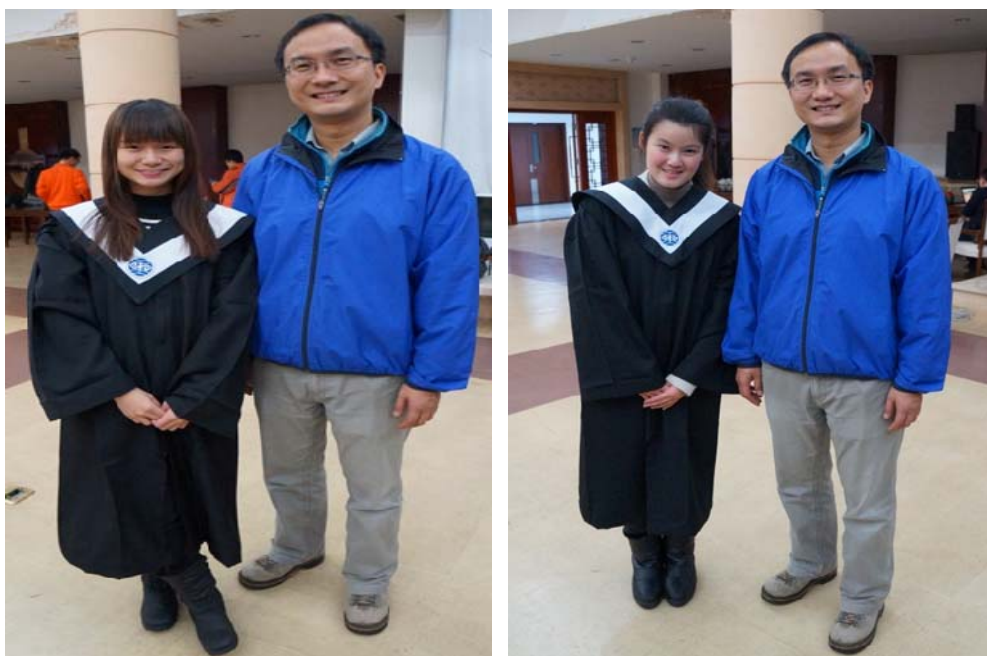
圖 16：文藝聯歡晚會本校學生與領隊教授合照。