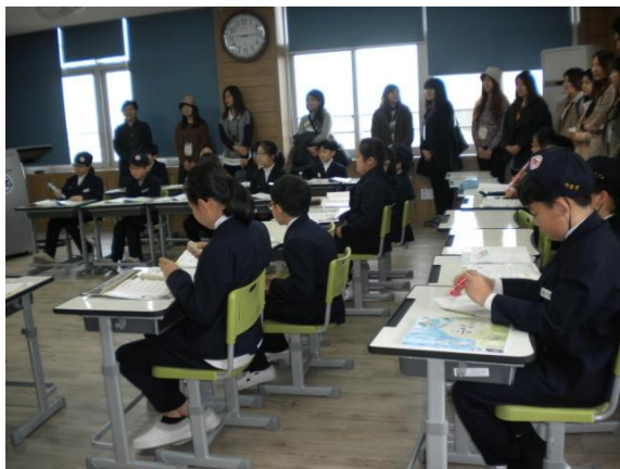
直笛吹奏的音樂課

隔天 4 月 2 日星期四的主要活動內容有上午參訪光州教育大學附屬小學，地點就在校門口的校園內。當天參觀了校史館、音樂課、英語課、美術課以及附小校園內的主要設施；當中有一個單面窗設計的教學觀摩教室，除了可以容納一整個班級的情境教室之外，外面還有階梯座位可以容納上百人同時觀摩。