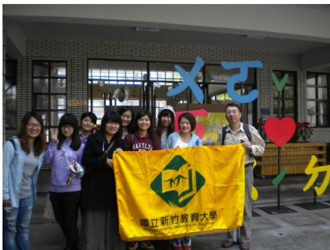
2015 年 4 月 1 日上午出發前在行政大樓合影

本次行程主要目的為帶領國立新竹教育大學 8 位學生回訪本校的姐妹校韓國光州教育大學；並藉此機會邀請光州教育大學的師生來本校參訪、夏季修課、短期交換學生以及進行學術交流。2014 年 12 月下旬，韓國光州教育大學蒞臨本校參訪，由這 8 位學生擔任學伴，因此在出發前，依照他們當時的約定，複習韓文及英文，希望在此次的行程中，彼此間能有更多的溝通和學習。