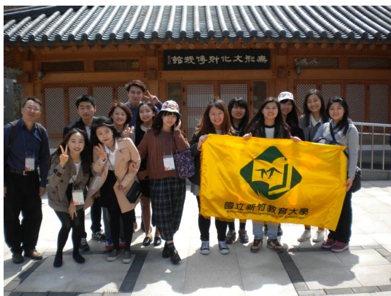
無形山文化園區體驗韓國傳統文化活動

春天參訪韓國是最適合的季節，氣溫不會太冷，白天高溫約 20 度左右，又是校園櫻花盛開的時節。當天附小的每一班，也都輪流來到這裡拍團體照。但是在韓國的學校竟沒有放春假！