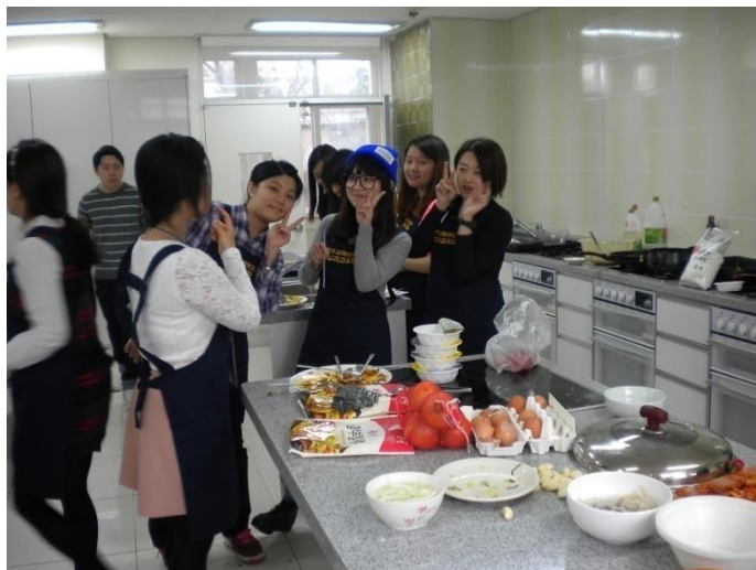
光州教育大學有設備非常好的烹飪教室，供學生學習。

4月4日星期六上午一起到當地的超市採買中午的食材，學生共分兩組，每組準備烹飪兩道韓國傳統食物。午餐過後去服飾店，體驗韓國傳統的服裝(Hanbok)。接著4點鐘由接待家庭到宿舍接學生回家，實際體驗韓國人的居家生活。