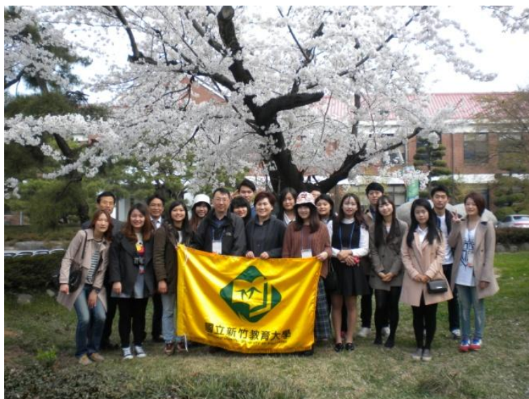
和光州教育大學附小校長合影留念

春天參訪韓國是最適合的季節，氣溫不會太冷，白天高溫約 20 度左右，又是校園櫻花盛開的時節。當天附小的每一班，也都輪流來到這裡拍團體照。但是在韓國的學校竟沒有放春假！