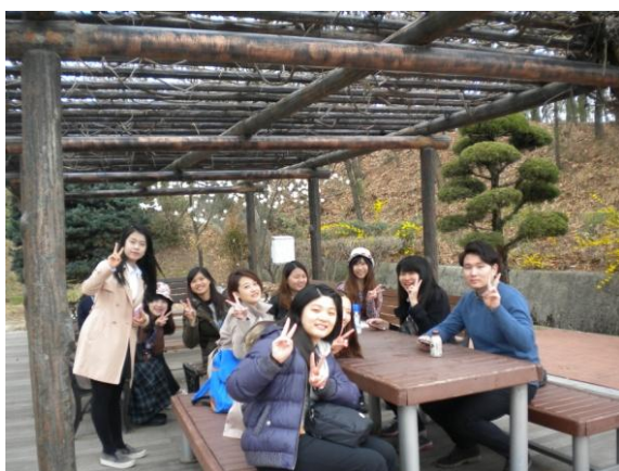
每天早晨和學伴在宿舍前的休息區會面

關於第一天行程的建議：光州教育大學位於南部，因此從北部首爾入境韓國或南部釜山，在接送及行程的安排上，會有二小時左右的車程差距。此次安排行程的大致情形如下。第一天 4 月 1 日星期三抵達韓國機場出關時已經將近 6 點；經過 4 小時的車程加上用晚餐的時間，當晚到達學校宿舍 Guest House 時是 11 點。但是，學生們太興奮，和學伴們一起到校門口的超市逛了一圈才回寢室休息。學校宿舍設備概況如下：4 人一房，內有客廳、廚房、浴廁和 2 間寢室。