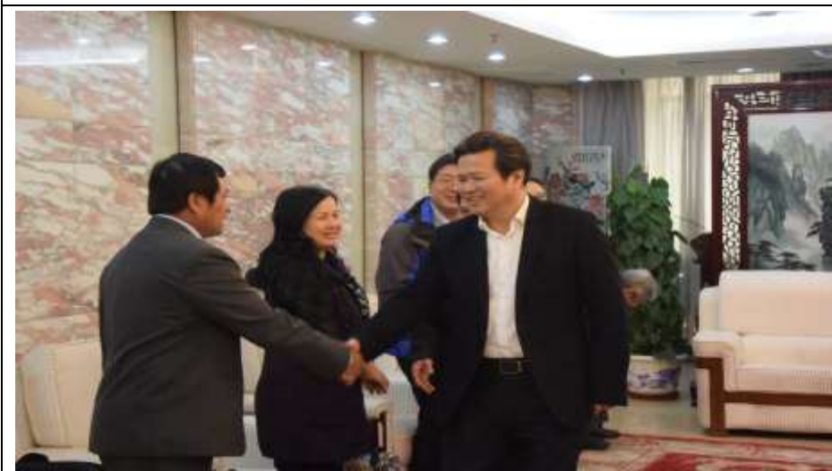
國臺辦龔副主任（右）向團員致意