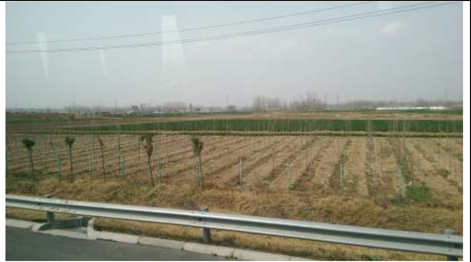
公路上看河南農地景觀，三月中