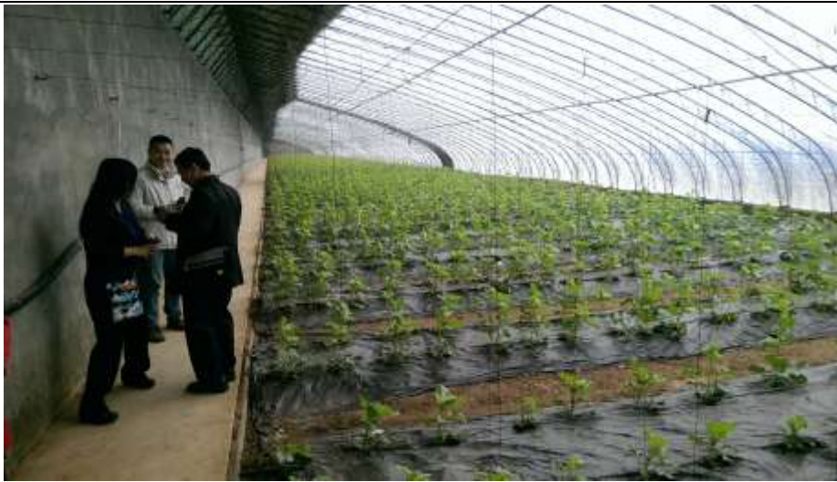
修武縣臺灣農民創業園溫室內部