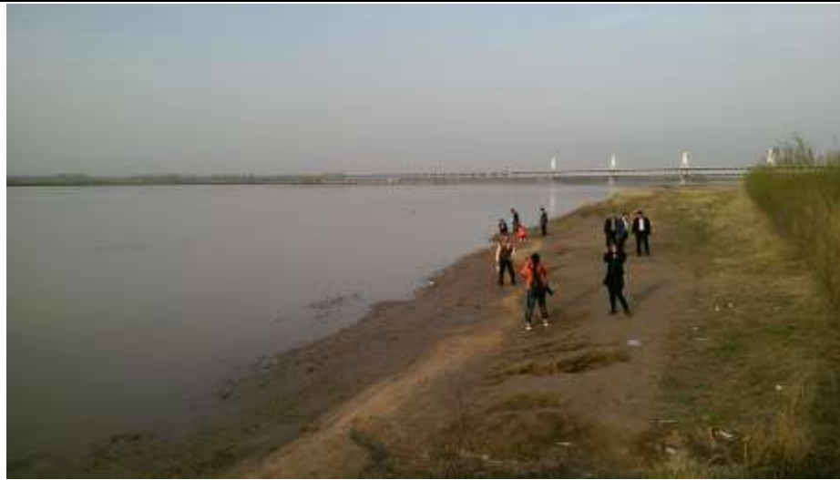
富景生態園區（黃河畔）