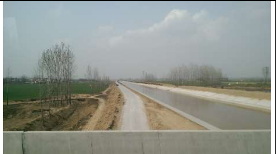
南水北調工程