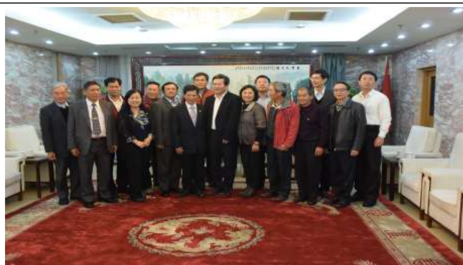
國臺辦龔副主任與全體團員合影