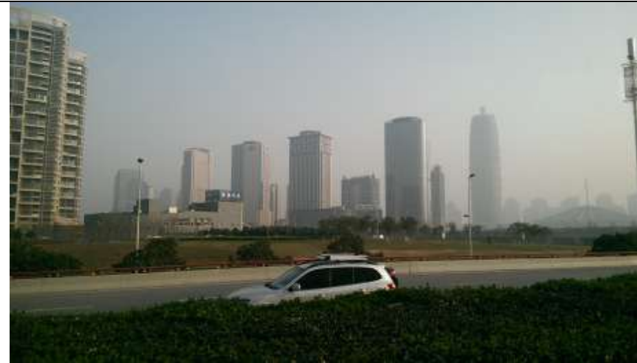
河南鄭州市硬體建設快速發展