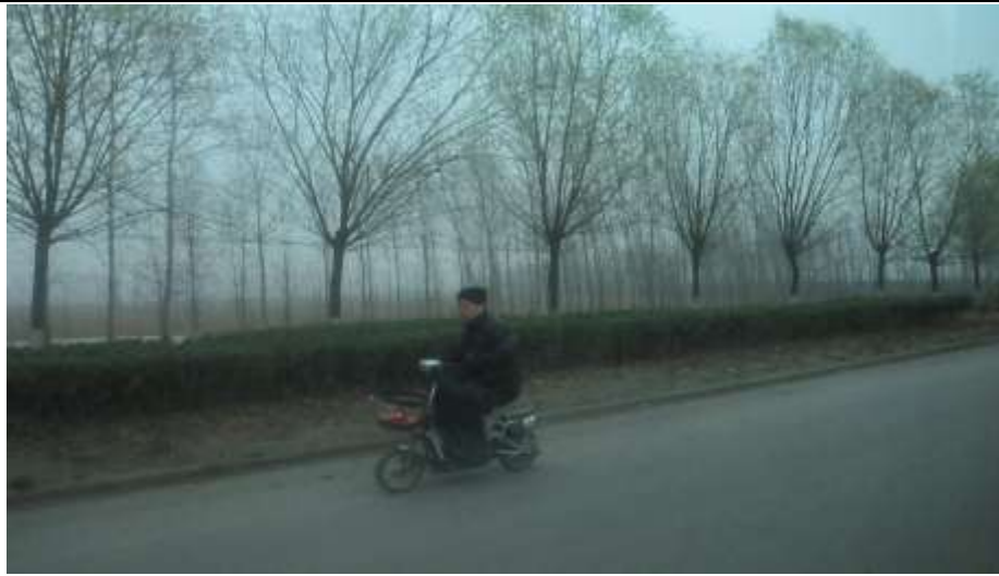
修武縣臺灣農民創業園尚未開發區