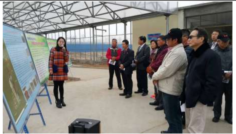
修武縣臺灣農民創業園解說情形