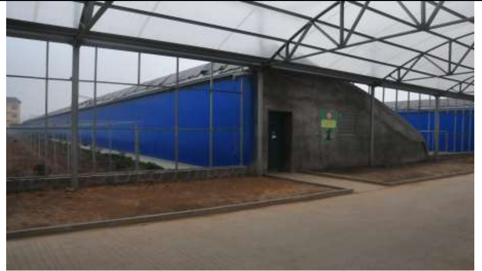
修武縣臺灣農民創業園簡易溫室