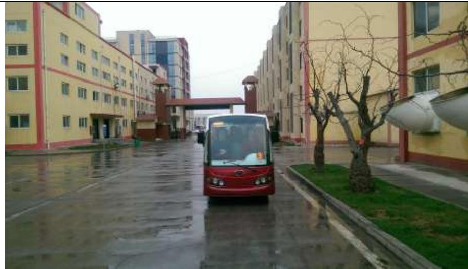
好想你棗業公司工廠區與電動車