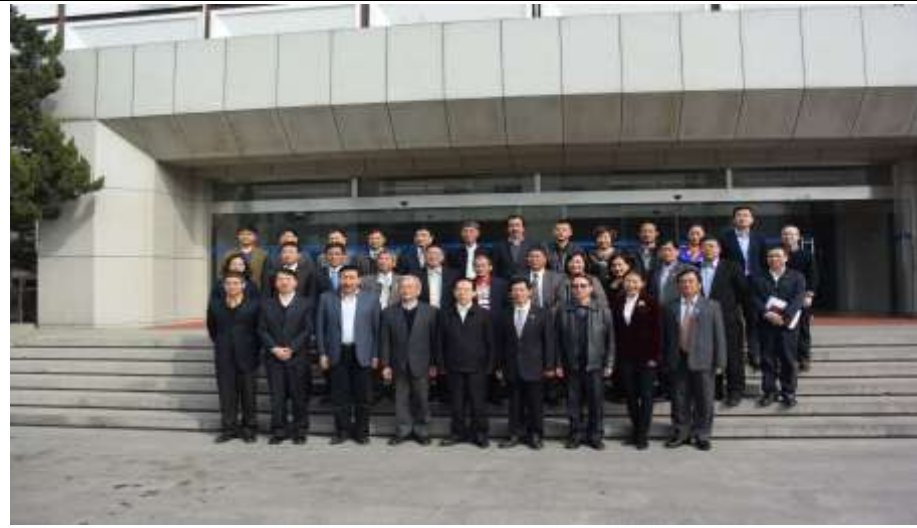
座談會會後於會議室前合影