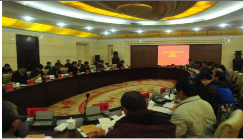
與修武縣政府就創業園座談