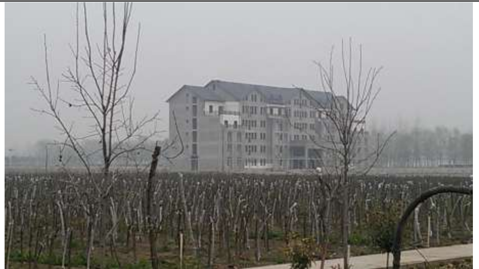
修武縣臺灣農民創業園辦公室（未完工）