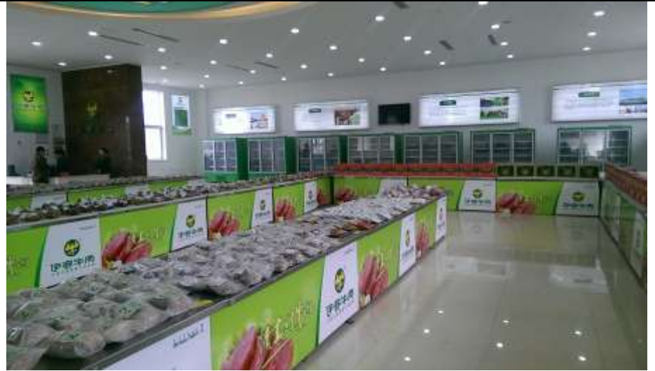
賽伊牛肉屠宰加工場商品展售區