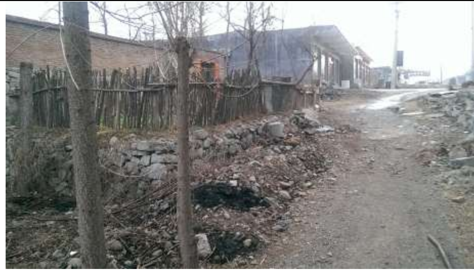
修武縣郊區一隅