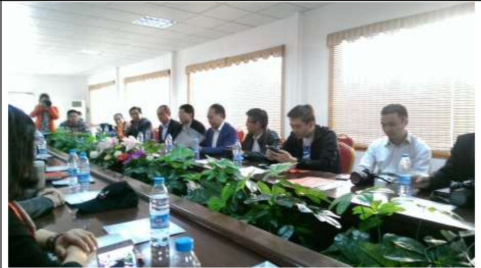
於富景生態園區座談