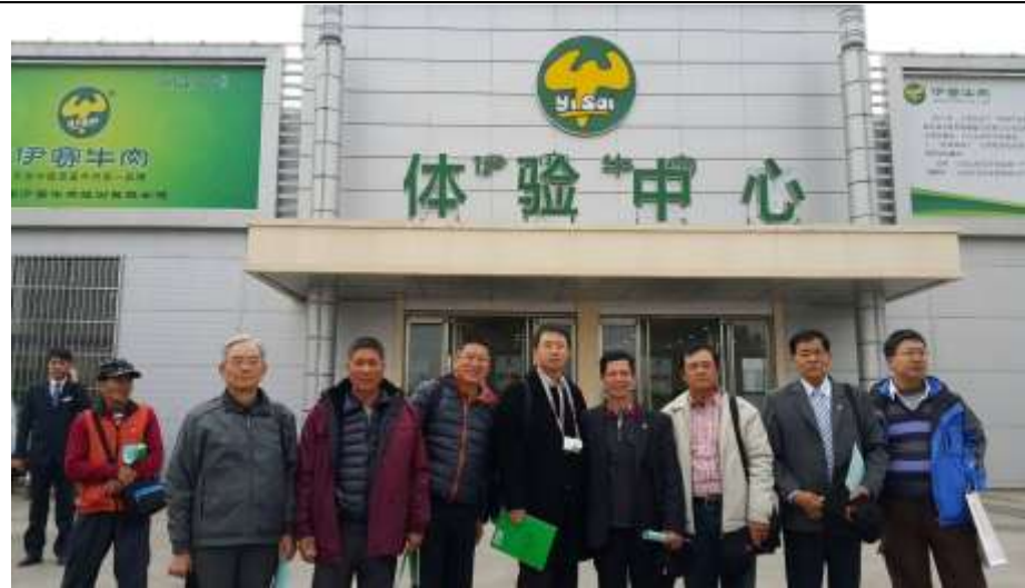
賽伊牛肉屠宰加工場前合影【林鈴娜攝】