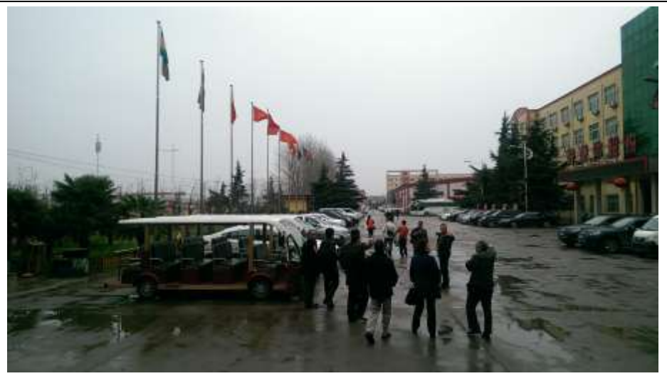
好想你棗業公司行政區