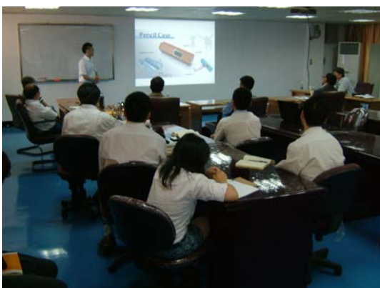
圖 5 高淳嵇同學報告實成果