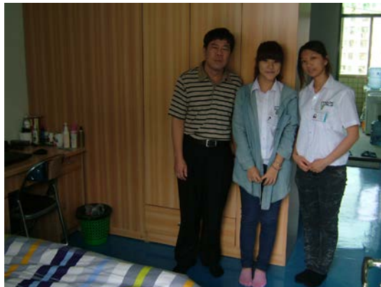
圖 6 參觀實習學生宿舍