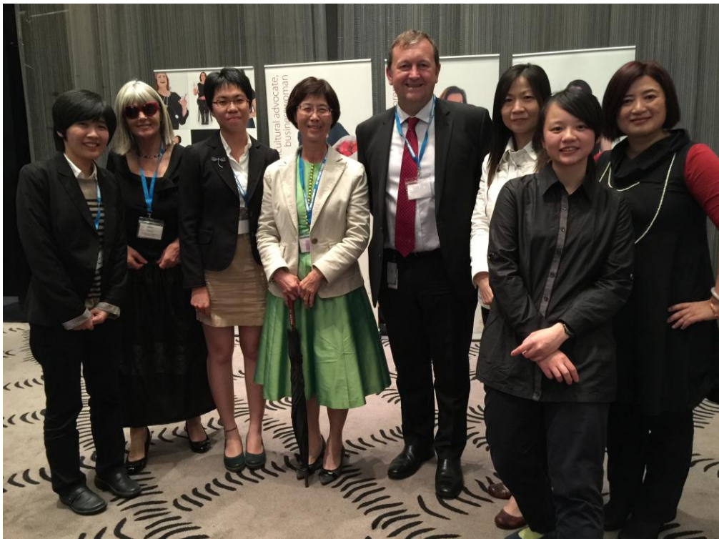
我國全體參與者於澳洲阿德雷德與南澳洲政府代表合影