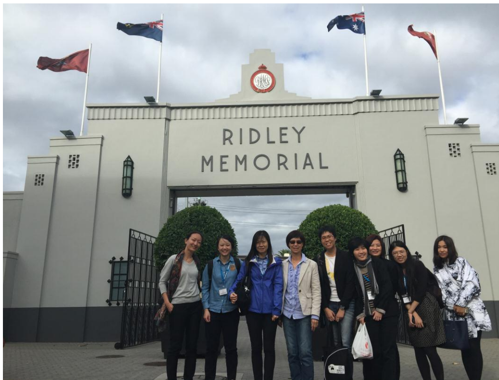
於研討會後與協助翻譯之阿德雷德大學學生合影