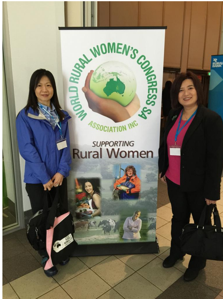
於會場看板前留影