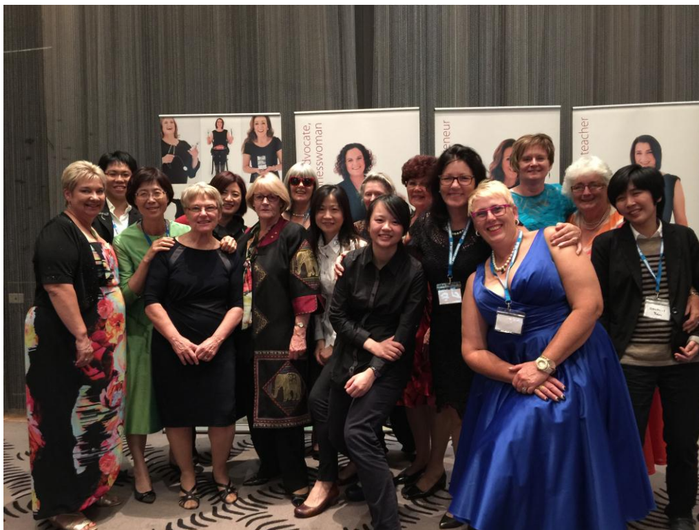
我國全體參與者於阿德雷德與主辦單位工作人員合影