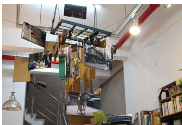
圖四：澳門劇場文化學會一樓空間裝置