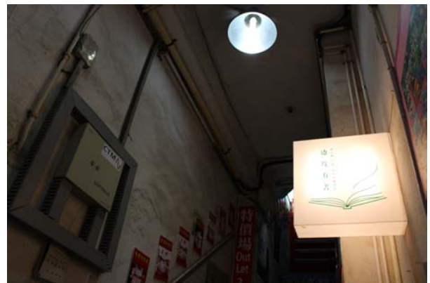
圖十七：「邊度有書」書店樓梯空間