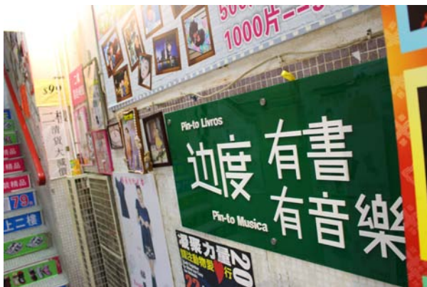
圖十六：「邊度有書」書店一樓入口招牌