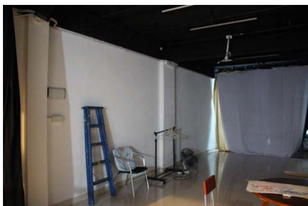
圖五：澳門劇場文化學會二樓排練空間