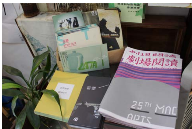
圖三：澳門劇場文化學會出版刊物《劇場閱讀》