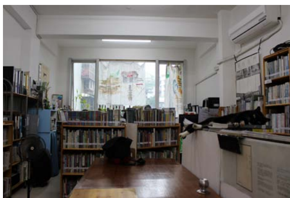
圖六：澳門劇場文化學會三樓劇場圖書室