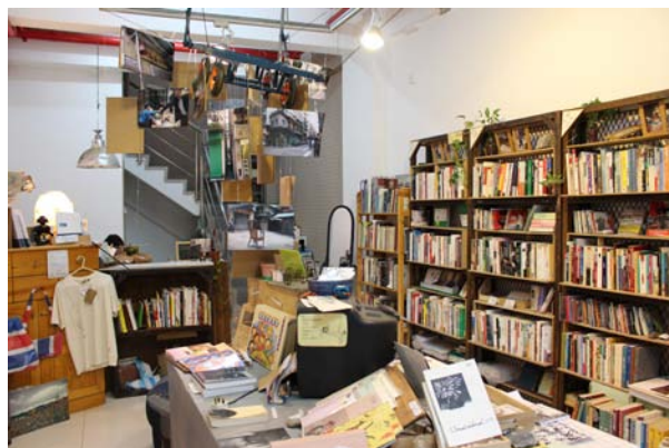
圖二：澳門劇場文化學會一樓書店