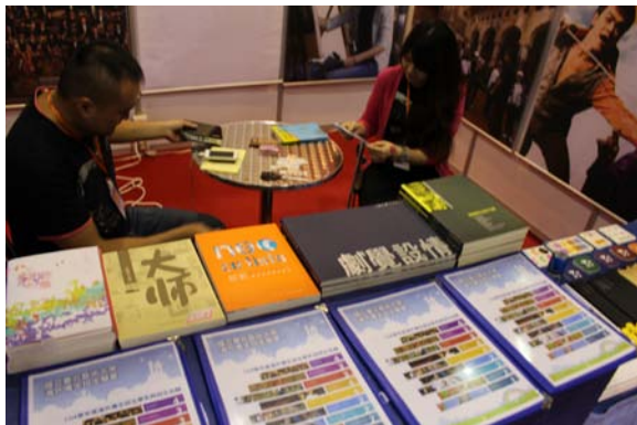
圖十四：出版組於展位陳列本校出版品