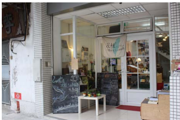
圖一：澳門劇場文化學會一樓入口