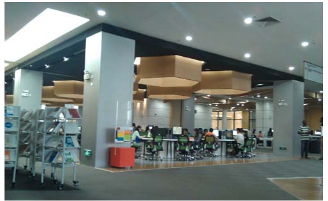
圖十：澳門大學伍宜孫圖書館一樓數位服務區