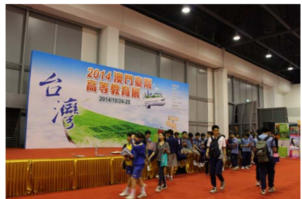
圖十五：2014 澳門臺灣高等教育展會場