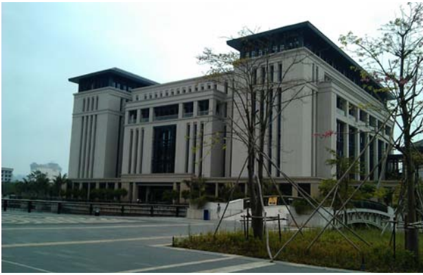
圖七：澳門大學伍宜孫圖書館