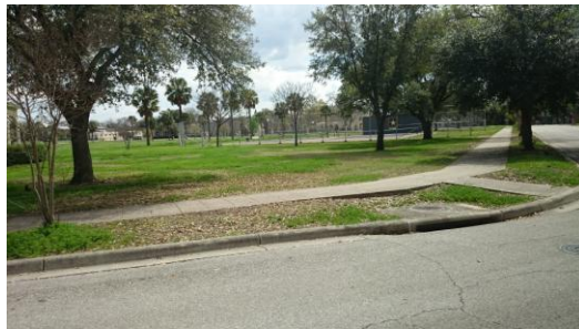
Figure 麥克阿瑟將軍小時候的網球場

上午由 Blanca 小姐帶著國際學員到人事部門辦識別證(軍人身份證，購物時可能打折)，等候時間也是大家聊天的時間，接著到國際學員辦公室與行政人員打招呼，中午用完餐後，Ken Knight 班主任帶著大家坐車巡禮校園介紹，這裡的職員宿舍，曾是許多二戰名將住過的地方，當車經過一座網球場時，班主任說麥克阿瑟將軍小時候曾在此打網球時，也是令人驚奇，如此才知他們是軍人世家。