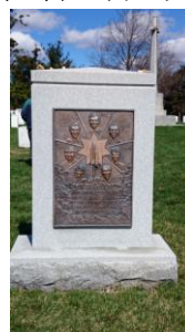
Figure 紀念 1986 年失事的挑戰者號

下午參觀林肯紀念堂、華盛頓紀念碑、二次大戰紀念園區，犧牲者的姓名刻於花崗石牆面上，另外有越戰、韓戰失蹤軍人紀念碑，是為了紀念當作是已經死亡或被俘虜者。職與同學的夫人分享說：這讓我想起“搶救雷恩大兵”這部電影，當時我感動的流淚了。最後是從十數座大型博物館中自行選擇參觀，就是一座博物館，一個下午也參觀不完，我選擇了參觀航空太空博物館，有幸能看見萊特兄弟被視為成功發明飛機的原始型機種，以及阿姆斯壯成功登陸月球的登陸小艇，參觀完後整個課程就算結束了。