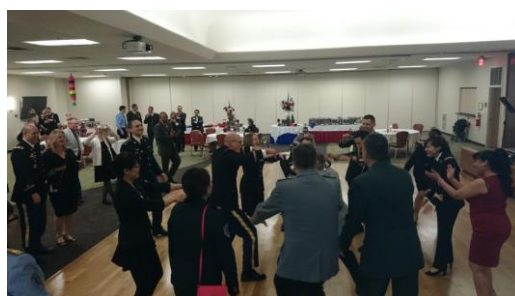
Figure 學員們聽到舞曲熱情舞蹈，最右側是由士官們組成的樂團