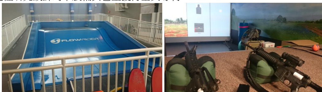
Figure 民間捐贈的衝浪設施 Figure 復健過後戰士可於復健中心練習戰鬥能力

BAMC 的復健中心也是相當有特色，整棟設施來自於民間與家屬捐款，為受傷戰士設計輔具的 360 度動態影像記錄。復健情形測試包括居家、開車，各種運動設施，如腳踏車、攀岩、游泳池、甚至是衝浪設施，最後是戰鬥模擬。這裡研究設計的下肢輔具甚至獲得全美專利。