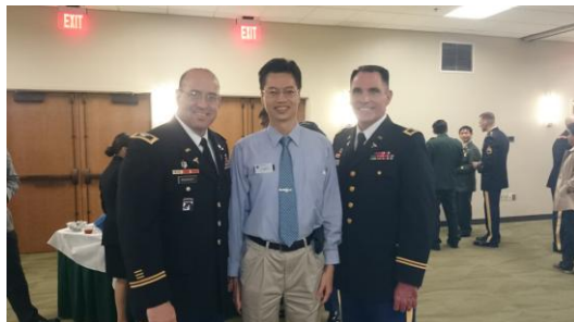
Figure 與同學們享用晚宴

今晚是由校長親自招待的自助餐式晚宴，對象是近期報到受訓的學員，由國際學生辦公室主任向校長一一介紹學員的背景，每位學員走一段紅地毯出場，並與校長及總士官長合影留念。場邊還有士官們組成的小樂團，過程中為大家演奏動聽曲目，令人感受到用心及尊榮，職也趁這機會認識不同班隊世界各國的學員，為這兩週在德州的生活畫下句點。