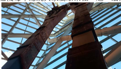
Figure 倖存的鋼樑屹立不搖

上午先到世貿中心遺址參觀九一一紀念館，館中有大部份地方保留了2001年當時清理善後的遺跡，包括地下室中一大面牆壁，兩根粗大的鋼樑。事實上1993年，恐怖份子就曾在世貿中心地下室引爆過炸藥，當時有六人死亡，上千人受傷。2001年攻擊事件，包括四百名救難人員，總共有將近三千名罹難者。之後每年總統與家屬聚集在一起，緬懷受難人員表示哀悼。