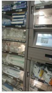
Figure 先進的衛材管理櫃

心臟、腹部超音波也有假人可以模擬，可以同時出現黑白畫面與內臟器官之立體彩色畫面，讓學員更容易學習。而支氣管鏡與腹腔鏡也可以設定各種模擬情境，有各種支氣管腫瘤位置可以測驗學員操作能力，測驗完畢可以回顧畫面以及根據記錄考核，甚至學員沒有抽吸痰液或麻藥劑量不足，假人會出現咳嗽反應。腹腔鏡模擬器已是許多國家認為重要的訓練工具，可以呈現肝膽、泌尿與婦科系統相關之情境，腹腔、骨盆腔內之畫面也幾乎接近真實，操作者必須熟練雙手中的器械，也要適當的調整鏡頭的位置，有手忙腳亂的感覺，若膽汁或血液流入體腔則會造成血水液體累積，要記得善用抽吸器。