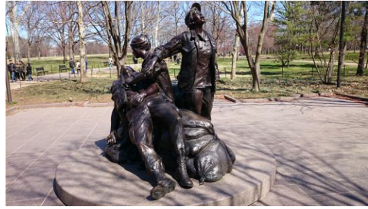
Figure 越戰紀念女性殉職人員區