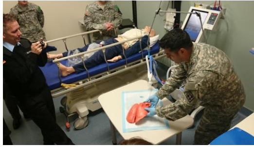
Figure 戰鬥醫務員訓練情形

中午在 Little Red Barn 用完肉排餐後，下午到戰鬥醫務士訓練部門 (Department of Combat Medic Training) 簡稱 DCMT，由一位曾參與過越戰且慈祥面容的退役上校，他的背景是醫師助理(physician assistant)，為大家簡報，內容是有關軍醫務士受訓的內容。學員至少是高中畢業，當他們畢業後，不知道自己要做什麼，來到這裡受完訓後，就能成為戰鬥醫務士而在戰場上服務。為了在戰場上保護自身安全，他們也接受基本的兵器訓練。訓練內容相當扎實，學員也可以參加國家級的 NREMT 的證照考試，當一般國民的平均通過率只有 64% 時，他們可以達到 80% 以上的通過率，在經過三次的嘗試後，通過率可以高達 95%。根據過去資料統計，戰爭中的死亡 82% 是無可避免的，其餘可以搶救的部份以出血的戰傷占 90% 為主，另外 8% 是因為爆裂物傷害，造成人員呼吸道異常，所以裝備中以這兩項戰傷處理的裝備為主。裝備愈多體積愈大，在敵人眼中被認為是重要的人，所以美軍也是設法努力要縮小醫務士背包的體積。接著是參觀戰傷模擬環境，燈光昏暗，煙霧氣味等讓環境更加逼真。有模擬城鎮中炸彈客攻擊，模擬傷患甚至會流血，有會動的受傷患肢，斷肢、灼傷、開放性骨折等，可以讓學員疲於奔命。職問了教官問題，是否有以獎賞鼓勵戰鬥醫務員更努力救援。教官說：不斷灌輸他們觀念，受傷的同胞是每天一起生活的兄弟，怎能不努力救援呢？