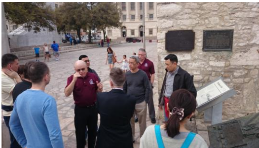
Figure 古城牆外，班主任向大家講述歷史

原來我們住的旅舍是在觀光區旁，傍晚班主任帶著國際學員參觀古城阿拉莫，故事是敘述 Sam Houston 將軍抵抗西班牙軍隊的歷史，當時也是一番長期艱苦的戰役，贏得勝利後，使得德州在日後才有機會加入聯邦政府，否則可能成為墨西哥的一部份了。繼續走向熱鬧的觀光小河旁，河道兩邊幾乎都是餐廳，還有一些手工藝品小販，看見穿著軍服的軍人也是有自信的走在路上，班主任沿路介紹某幾家餐廳的特色，怕大家日後選到不及格的餐廳了。