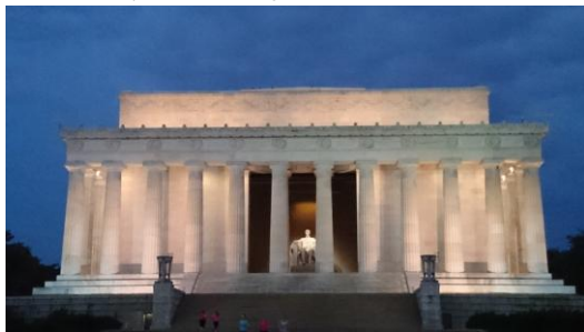
Figure 晨跑時經過的林肯紀念堂

今日上午是參觀白宮的行程，其安全檢查相當嚴格，每個人需檢查有相片之雙證件，外國人的另一證件(通常是課程結束需繳回的軍人身分證)姓名與護照寫法不一致時則安全檢查時間較久，進去後也是禁止拍照。進入參觀時導覽員表示，現任總統較少去翻修一、二樓大家參觀的部份，有中國瓷器房、卸任總統夫人畫像展示廳，二樓有綠、藍、紅三間小客廳，從傢俱到牆上的油漆底色是固定各自的綠、藍、紅三色，由於年代久遠，翻修時務必會找到相同的花色材進行整修，以及兩間宴會廳，除了用餐之外，可以容納藝術表演人員。從二樓窗戶看出去有一大片綠草地，根據記錄通常是復活節、感恩節等戶外活動舉辦之場所。並不是每位總統都是住在白宮內，而現任總統下班後住在三樓，且三樓不開放參觀。