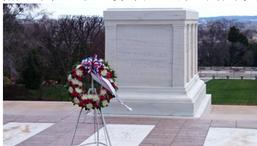
Figure Arlington 公墓內向英雄獻上花圈

接著前往 Arlington 公墓，這是國防部也編列許多預算維持的地方，所以環境如公園一般整齊清潔。本班隊以著陸軍軍醫團隊名義，搭配儀隊人員獻上花圈軍禮，對犧牲的英靈表達無限崇敬之意，此軍禮儀式引起民眾圍觀與拍照。不僅止於埋葬軍人，有些對國家有特殊貢獻而犧牲者，亦可埋葬於此。