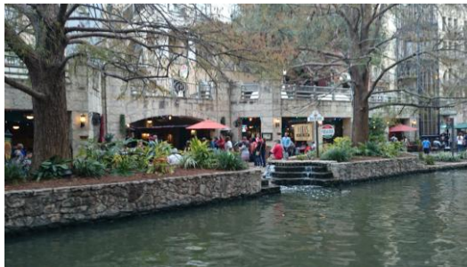
Figure 觀光小河旁都是餐廳

到了 Iron Cactus 墨西哥式餐廳，這應該是生平第一次墨西哥式餐，簡單說就是酸味、辣味與多種佐料，還有雞尾酒飲料。用完餐後，路上還是很多人，河道上的小船上仍有許多觀光客，經過大賣場就各自去購物了。