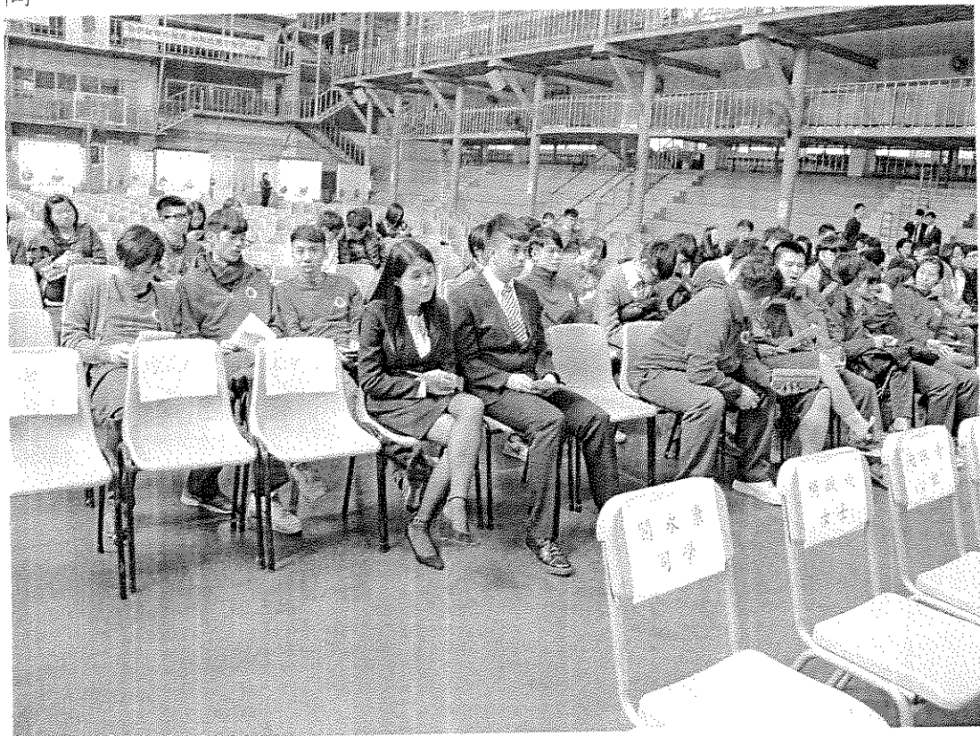
相片四：活動現場情形