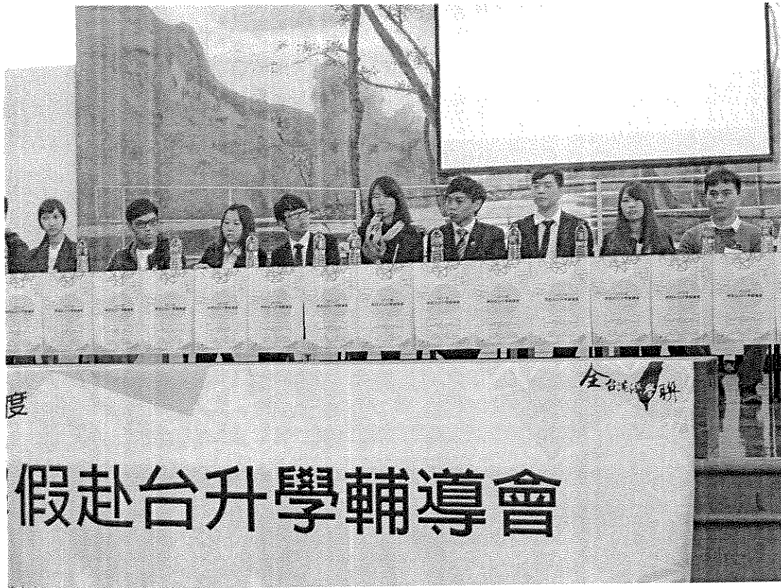
相片三：海外聯合招生委員會率在臺就學同學進行在臺生活經驗分享及回應提問。