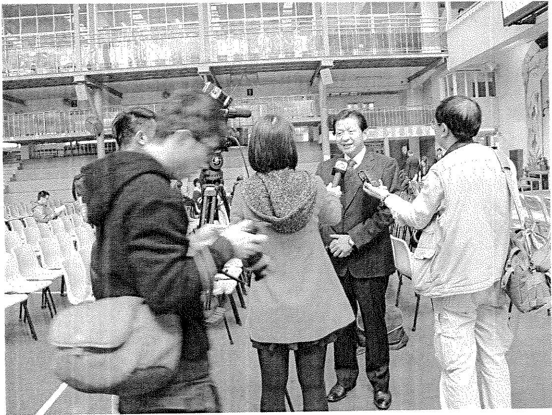
相片一：澳處盧處長於活動前接受澳門媒體採訪