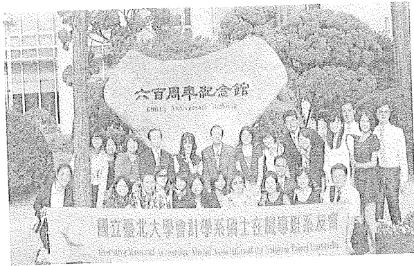
(全體團員於成均館大學六百周年紀念館前合照)