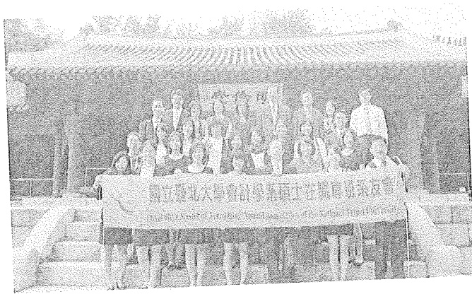
(全體團員於成均館大學明倫堂前合照)

舟車抵達成均館大學時趁著天色未暗，該校教授即帶領著大家來趟校園古蹟之旅，並敦請專業導遊全程英文解說各大堂殿種種歷史，暫時撇開「成均館緋聞」那韓國熱播的談諧戲劇等印象，站在現地搭配著古色古香的背景，一邊聆聽校園介紹時也讓大家漸漸徜徉於充滿書香的歷史中，在詳細的解說之後，讓大家對該校的歷史與近期之發展有一個完整的了解。