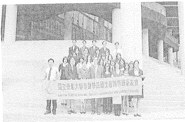
(全體團員於首爾女子大學教學大樓前合照)