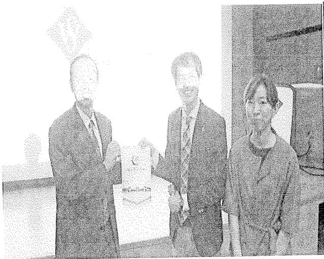
(會議結束後致贈本校錦旗)