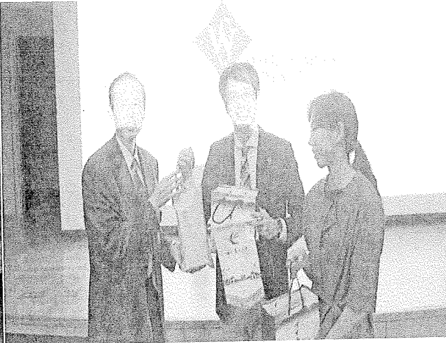
(會議結束後致贈伴手禮)