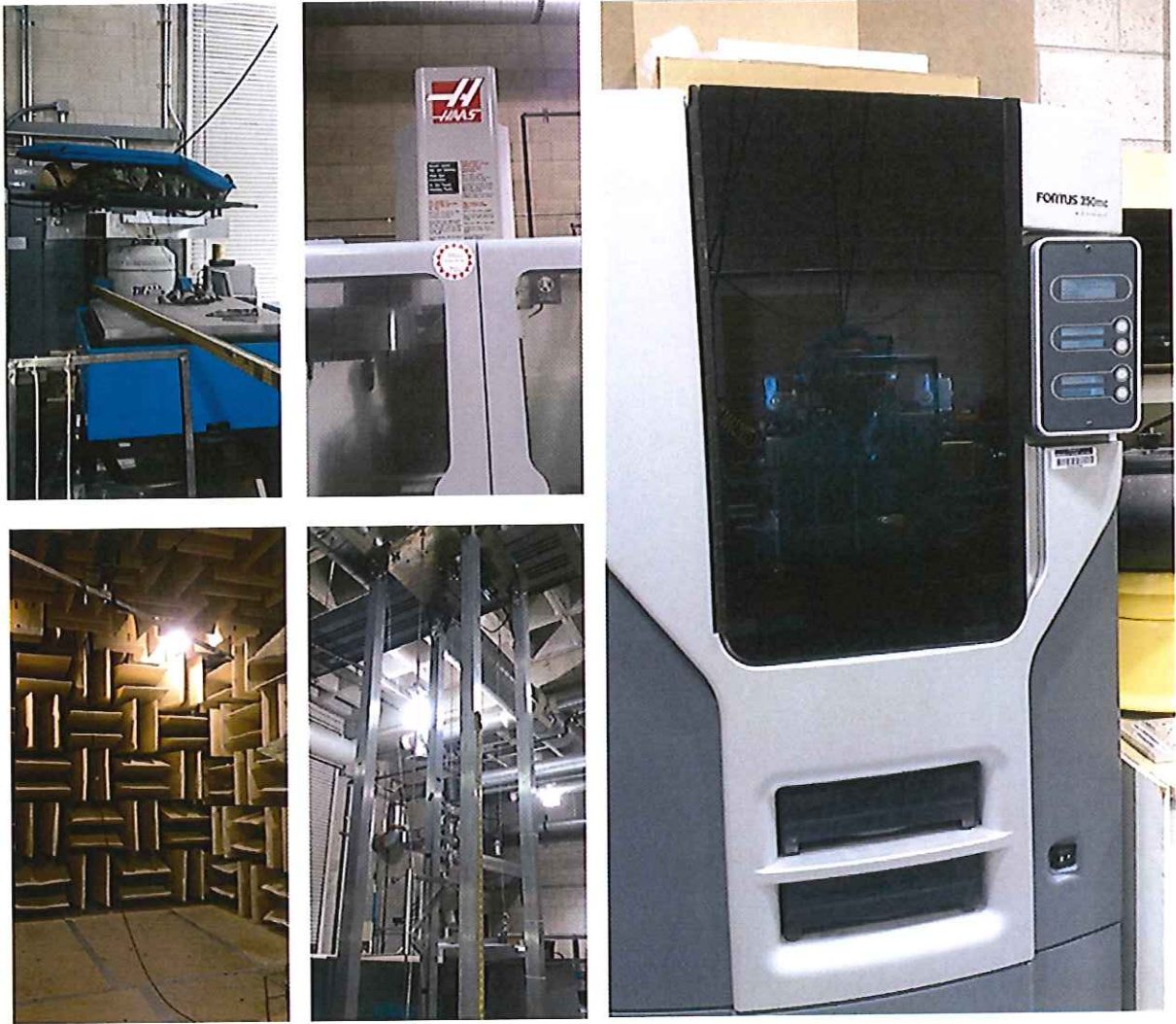
圖 5 全無迴響室噪音實驗室及 Stratasys 3D Printer