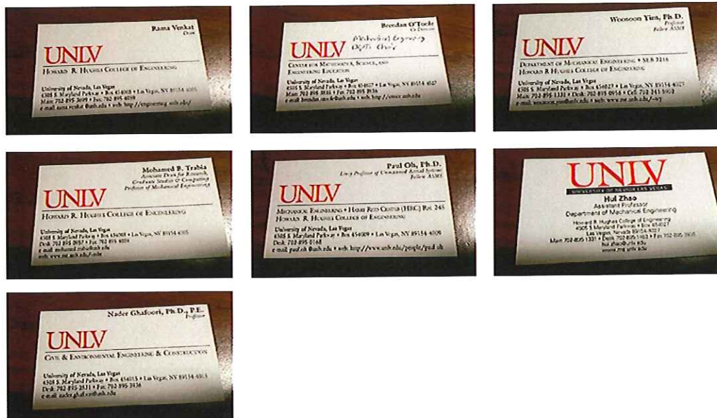
圖 2 相關與會人是名片