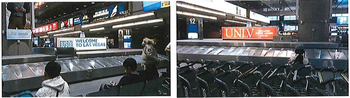
圖 1 Las Vegas 之 McCarran 國際機場