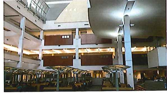
圖 3UNLV 校園建物及景色