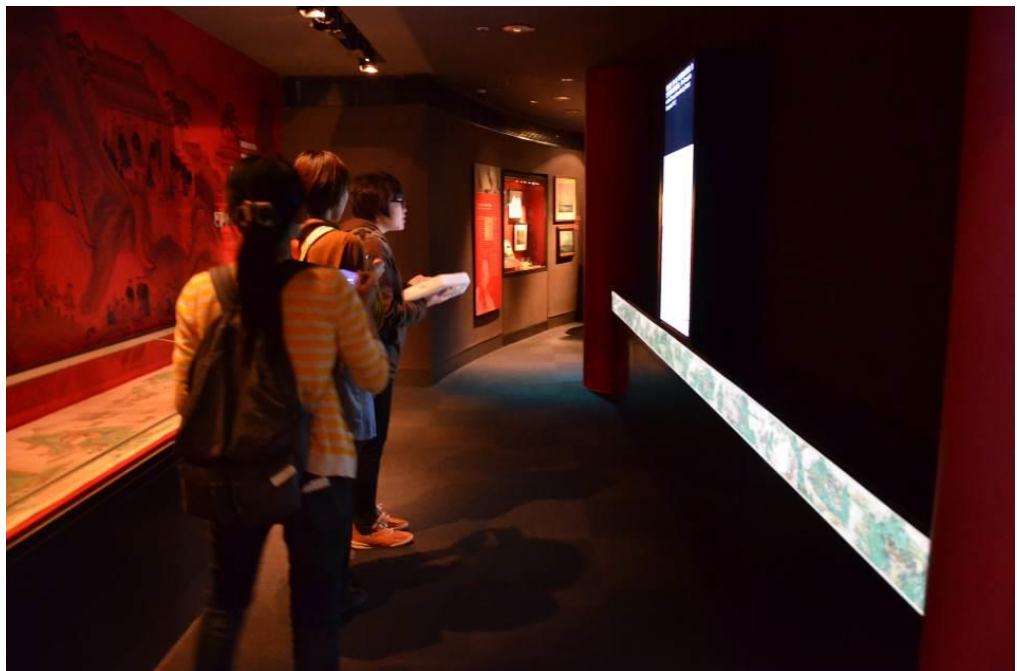
圖3 香港海事博物館展示場中可讓觀眾與之互動的數位《靖海全圖》。