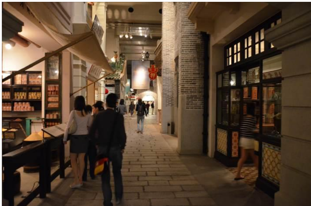
圖 4 大量運用場景復原，讓難以用文字描述的文化內容呈現在觀眾眼前。