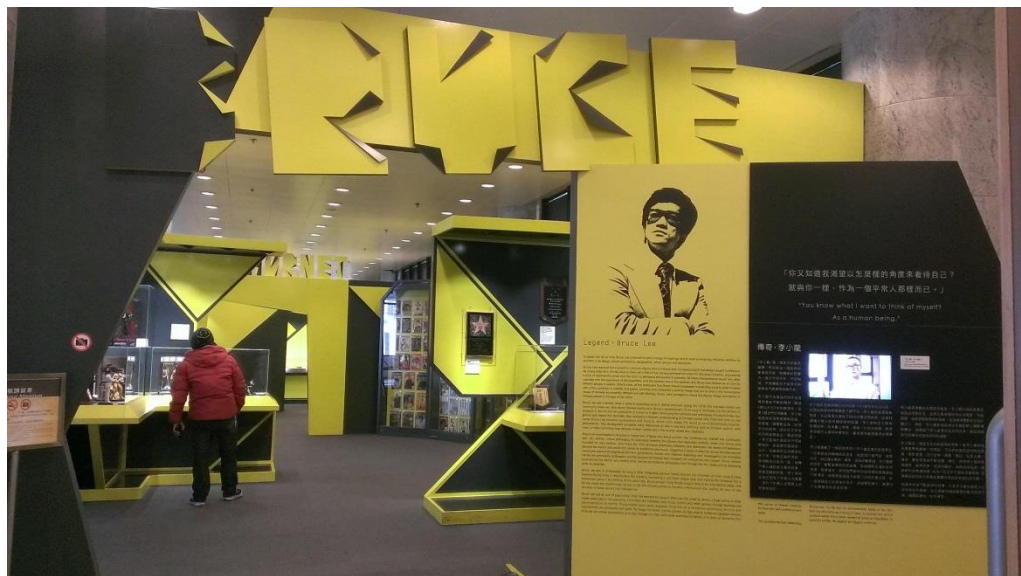
圖 8 香港文化博物館舉辦李小龍特展，介紹紅極一時的電影明星。