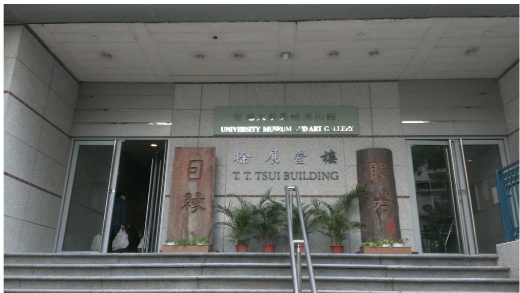
圖6 香港大學美術博物館的徐展堂樓入口。