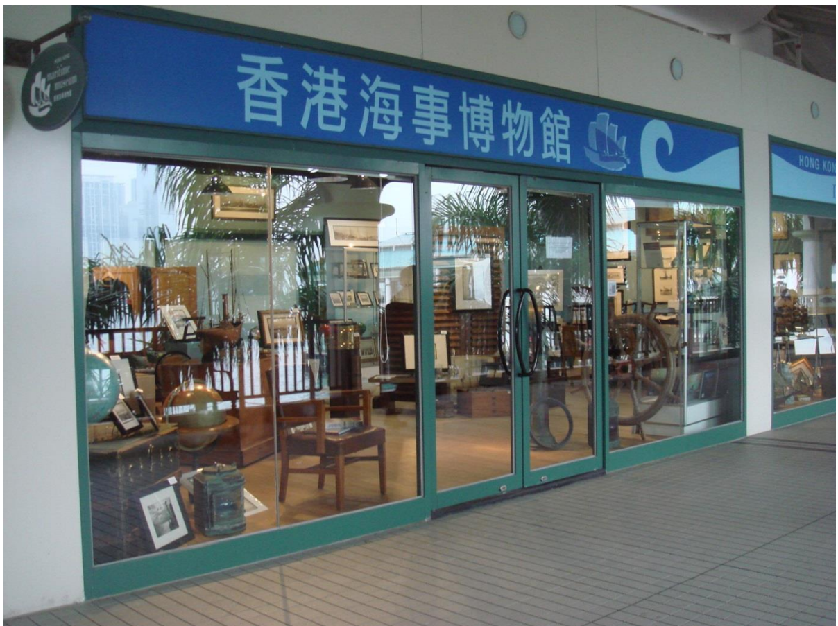
圖 1 參觀香港海事博物館，位於香港島的中環碼頭區，位置絕佳。

本次出國研究參訪與交流計畫，藉由研究成果，增進對於香港博物館學與博物館發展的了解，除了作為未來課程教學之基礎資料，未來也可以透過本計畫，期望有機會可以提供師生互訪，甚至簽訂合作協書之可能性。