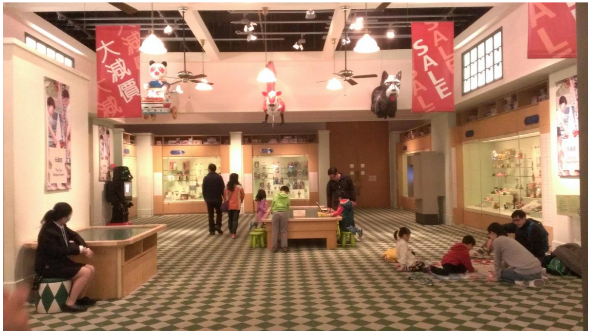
圖 9 香港文化博物館中，家庭觀眾正在使用寓教於樂的教育活動設施。

香港博物館的展示呈現上，主要在強調與觀眾生活的連結，不論是香港歷史博物館、香港科學館、香港文化博物館或是香港海事博物館，觀眾都有機會可以在博物館中看見與生活息息相關的文物與故事，引發觀眾的興趣。近年來，展示手法上日益重視互動性與數位展示的可能性，也反映在博物館展示廳中，到處可見互動展示的內容。同時，在教育活動規劃上，博物館為了配合教育的使命與宗旨，在展場與公共空間中也增設教育空間，不只在科學館，歷史博物館與文化博物館也看得到觀眾在展示區與教育活動區快樂地學習。