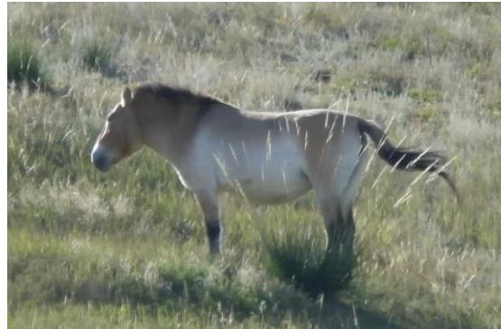
復育之蒙古特種馬