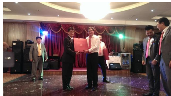
代表致贈紀念品給蒙古新理工學院