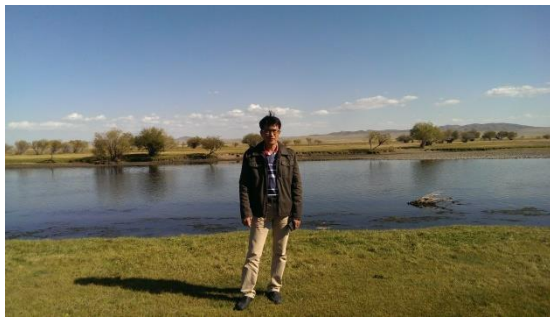
哈斯臺國家公園之土拉河