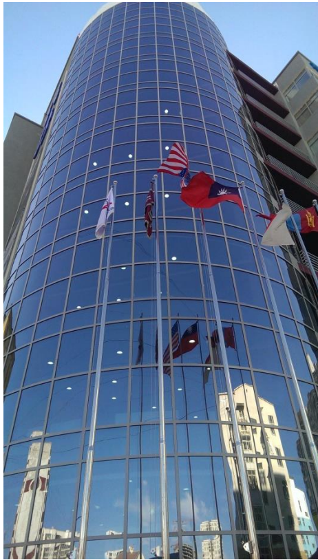
該校大樓外觀、我國國旗與他國國旗一同飛揚