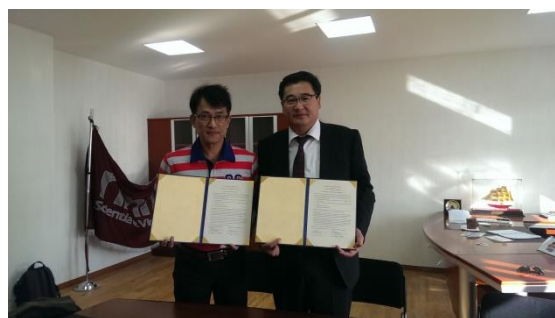
簽署新的姐妹校合約