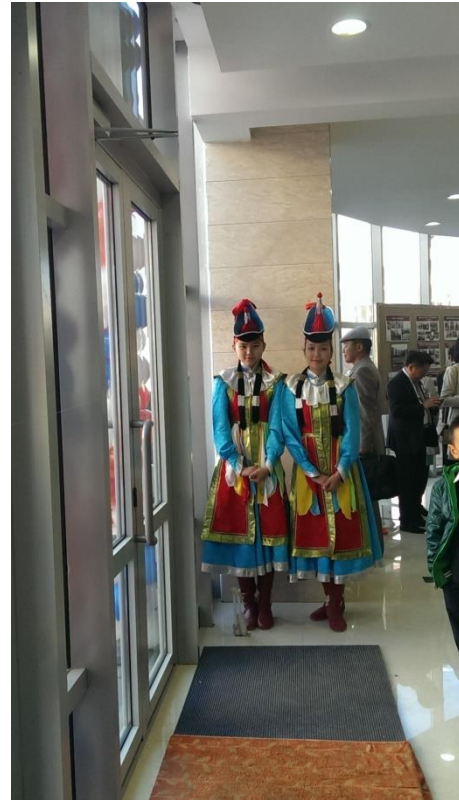
著蒙古傳統服飾之接待人員