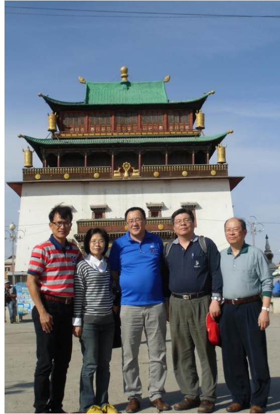
與 NMIT 董事長於甘丹寺合影