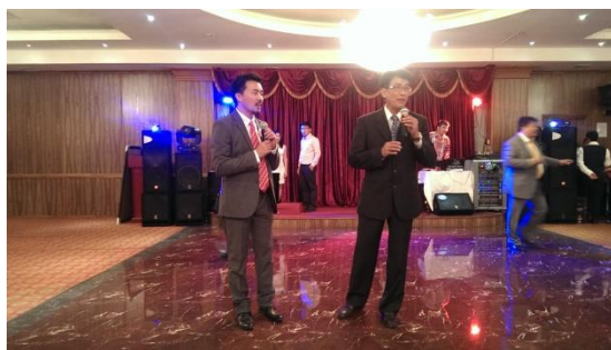
應邀於開幕慶祝晚宴中致詞