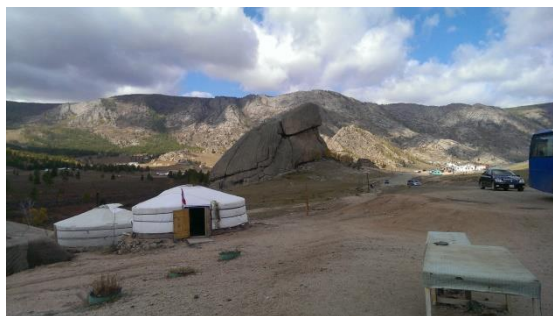
特勒吉國家公園一隅