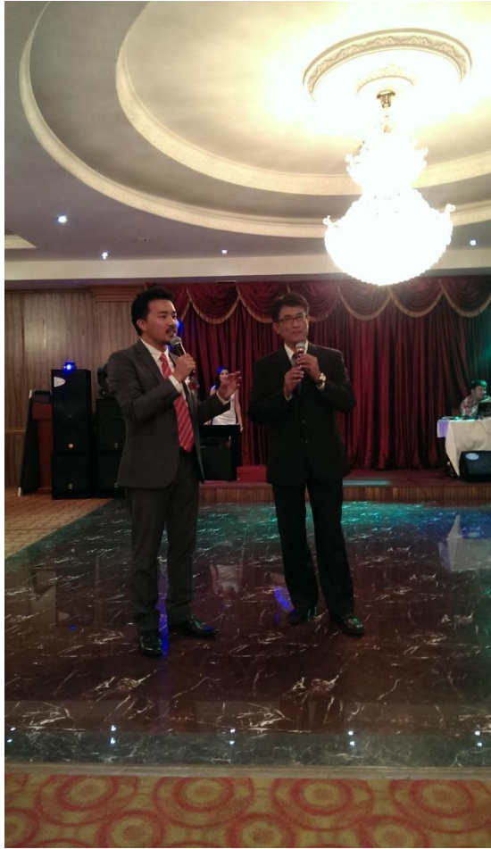
應邀於開幕慶祝晚宴中致詞