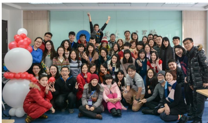
與吉林大學法學院同學在座談會後合影留念