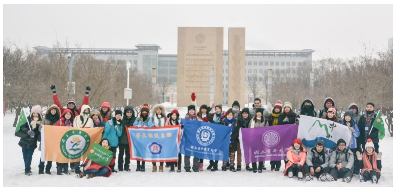
參與同學在吉林大學校園內合影留念