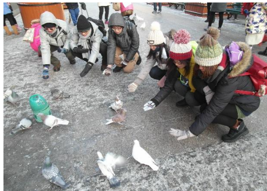
參觀哈爾濱聖索菲亞大教堂