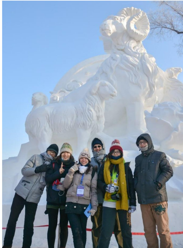
參觀哈爾濱太陽島雪雕