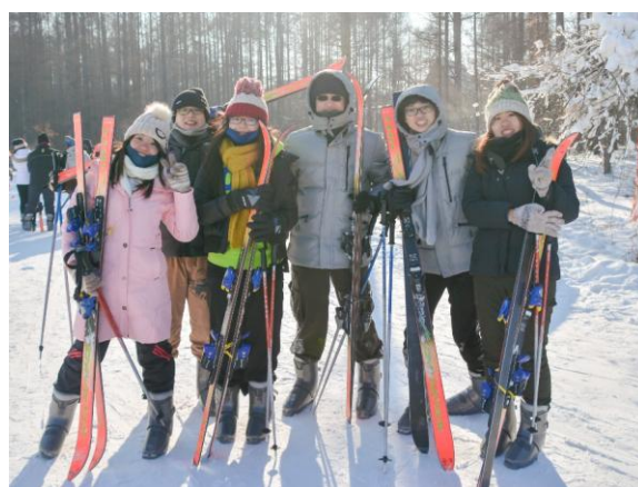
長春市淨月潭滑雪