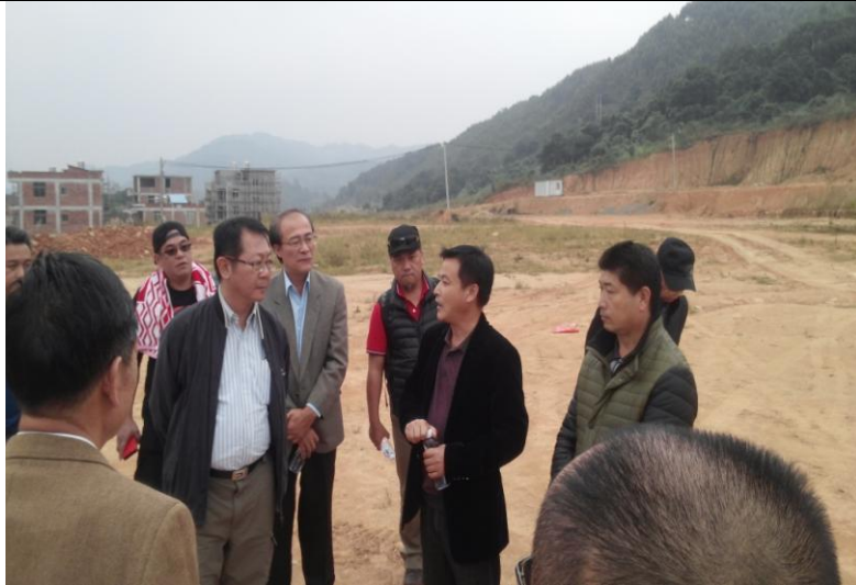
解說東湖鎮羅山基地建設情況