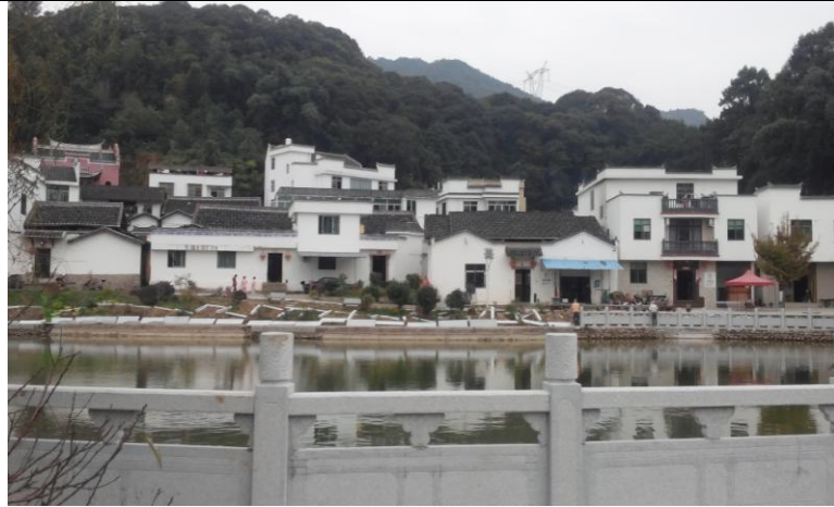
甯德金涵畬族鄉上金貝畬族寨景區