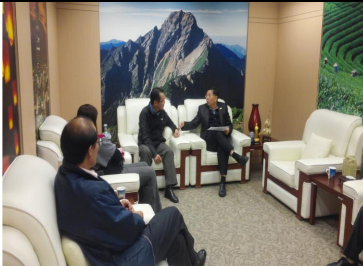
本會與臺旅會晤談