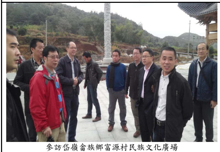
參訪岱嶺畬族鄉富源村民族文化廣場