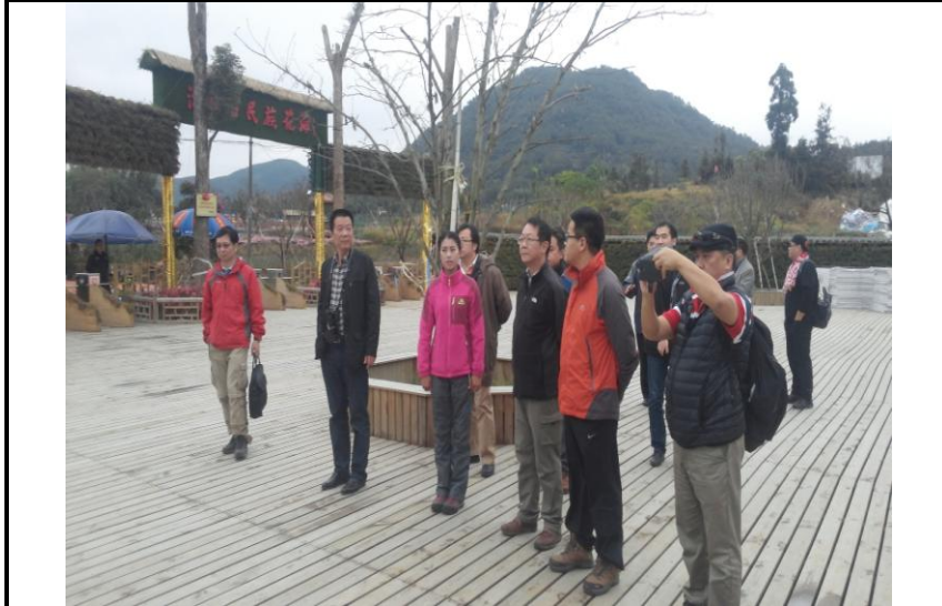
參訪浙閩台民族花海生態園