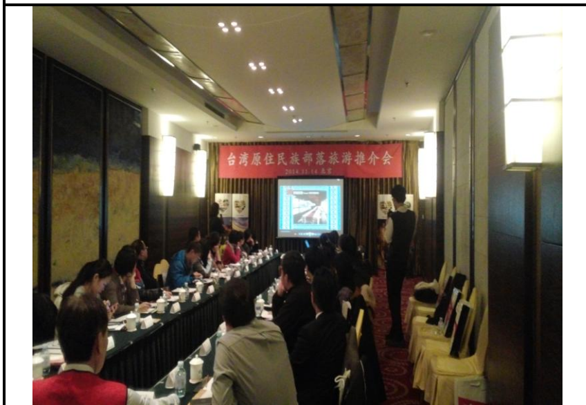
臺灣原住民族部落旅遊推介會