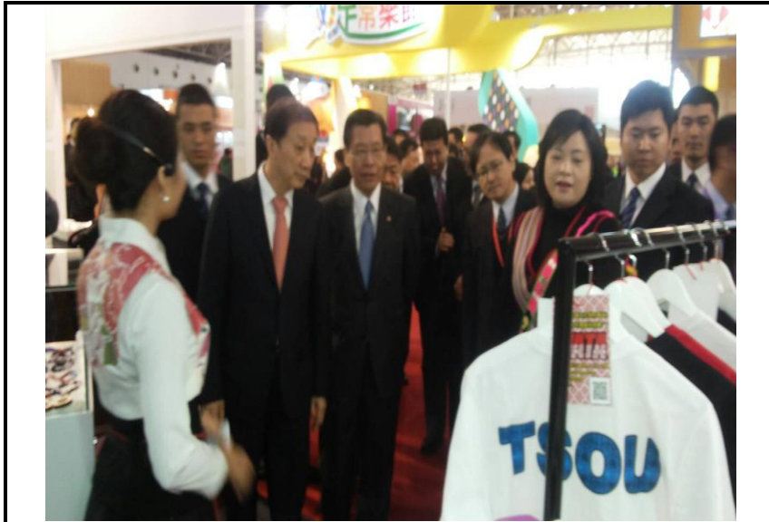
外協董事長梁國新參觀臺灣原住民族產業館