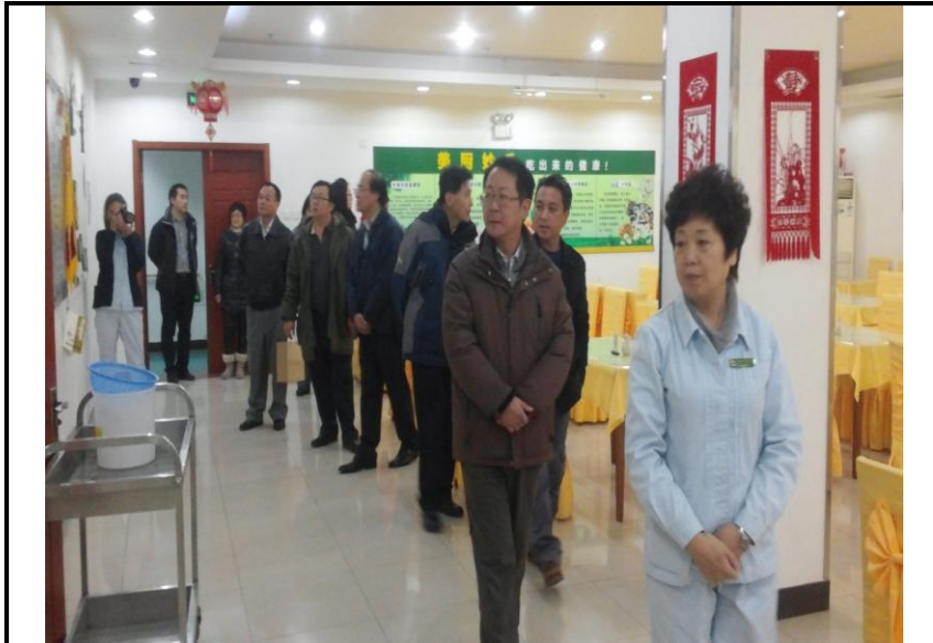
參訪牛街民族敬老院