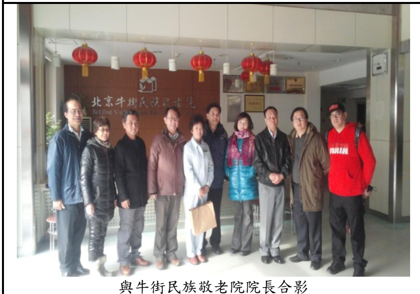
與牛街民族敬老院院長合影