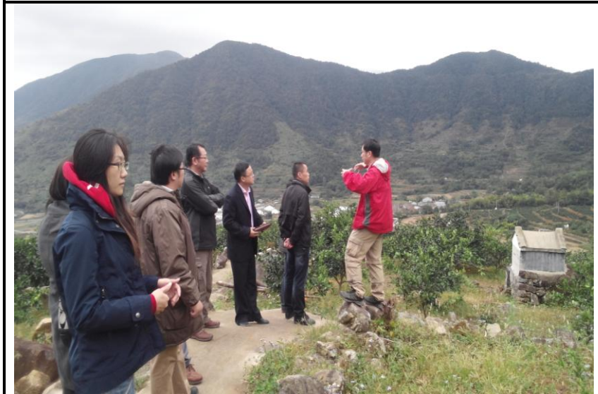
蒼南縣岱嶺畬族鄉富源村柑桔精品園現地