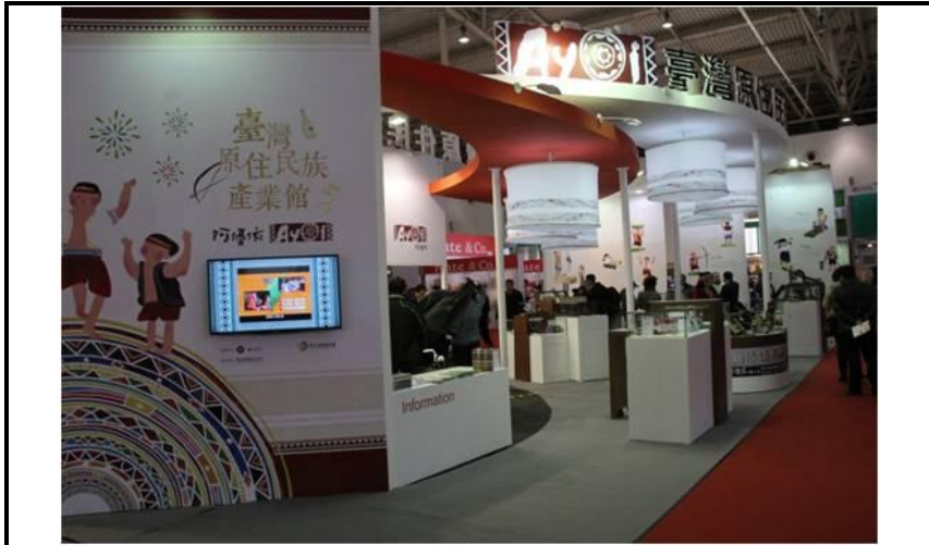
臺灣原住民族產業館