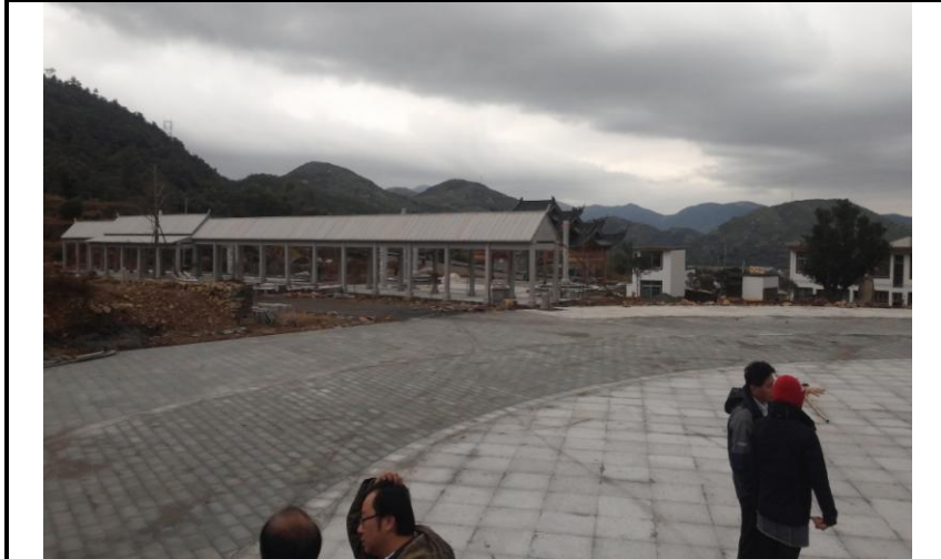
參訪岱嶺畬族鄉富源村民族文化廣場