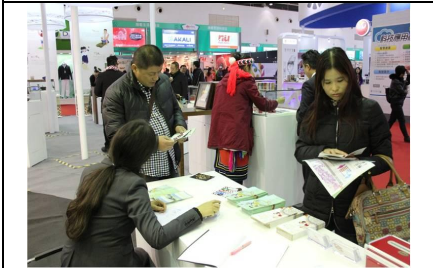
臺灣原住民族產業館服務台