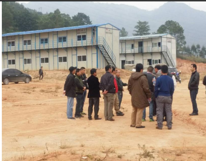
訪視福建省東湖鎮少數民族重建搬遷基地