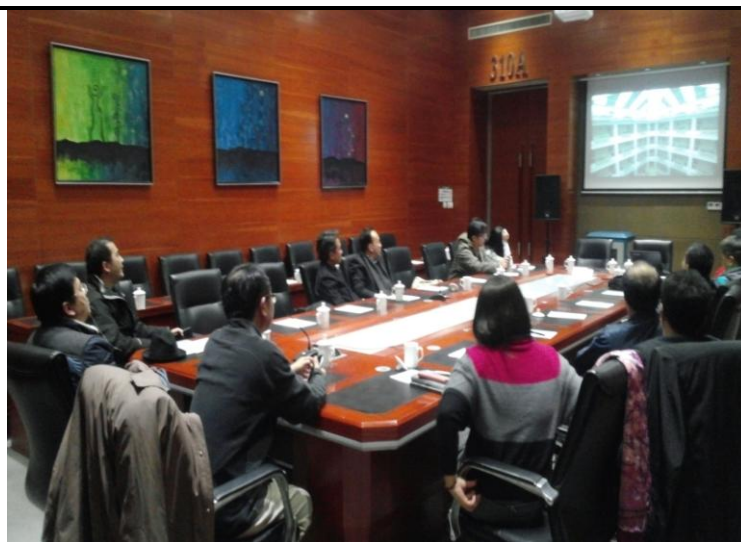
聽取蟹島綠色生態度假村簡介