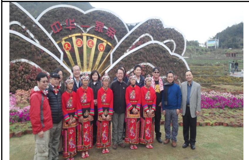
浙閩台民族花海生態園合影