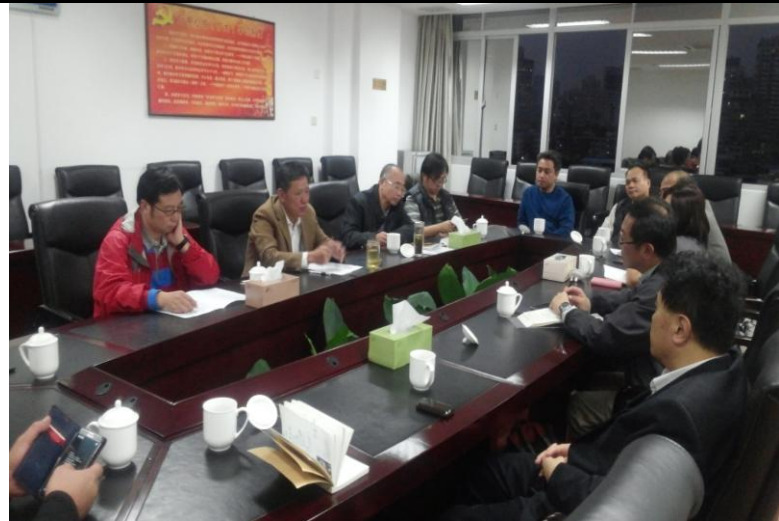
與福建省民族與宗教事務廳座談