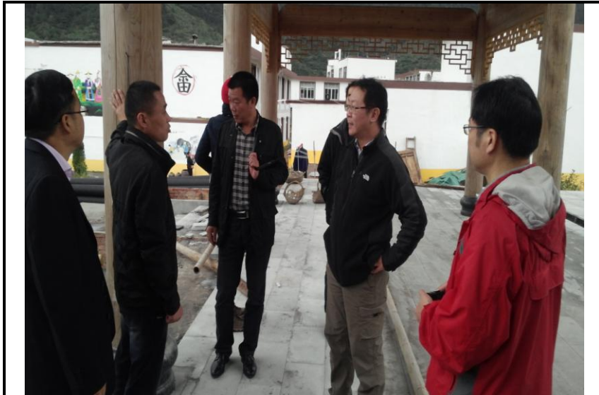
參訪岱嶺畬族鄉富源村民族文化廣場