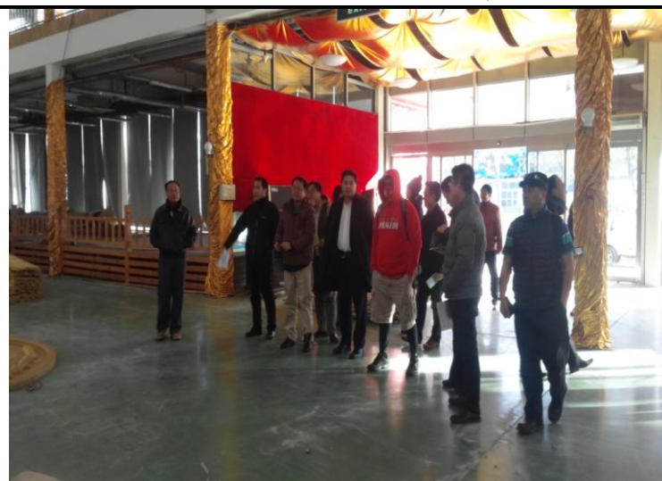
參觀蟹島集團規劃之「中國民族商品展示交易基地」