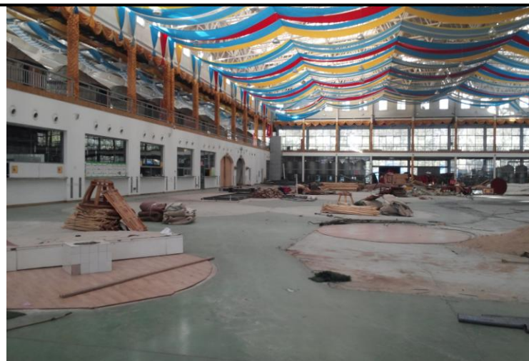
蟹島集團規劃之「中國民族商品展示交易基地」