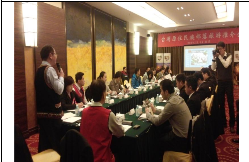
臺灣原住民族部落旅遊推介會