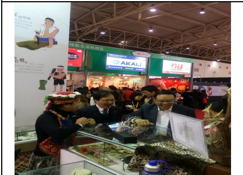
臺灣原住民族產業館銷售情形