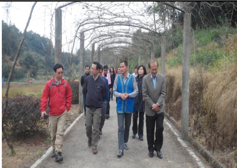
參訪上金貝畬族寨景區