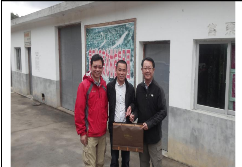
劉主任秘書維哲致贈伴手禮予富源村書記