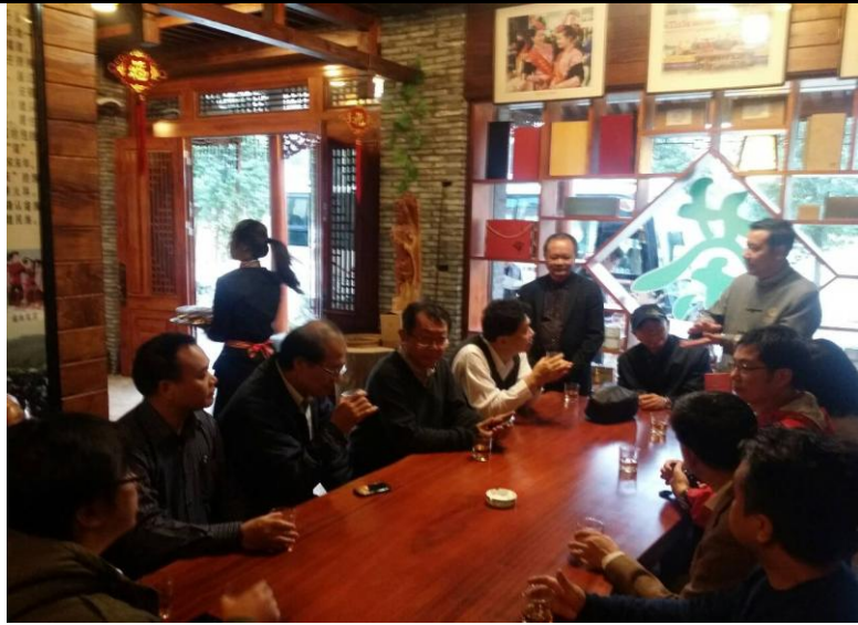
訪視福鼎市畬香茗茶業有限公司