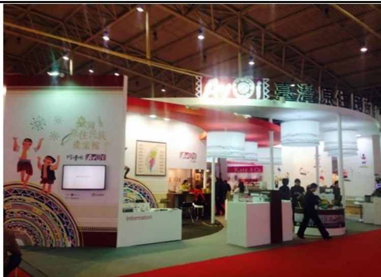
臺灣名品博覽會-臺灣原住民族產業館展場