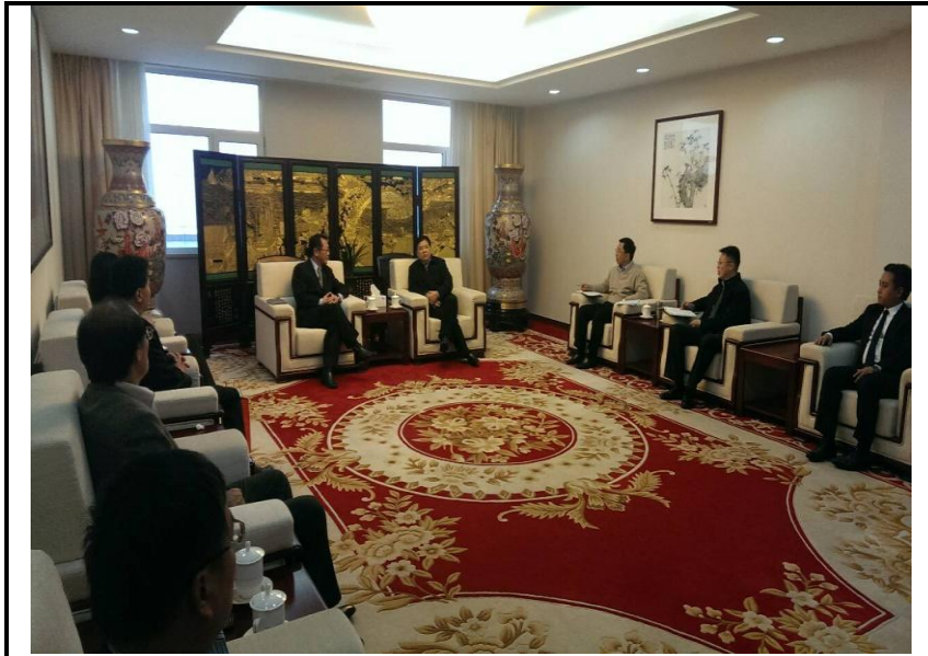
與國家民族事務委員會會談