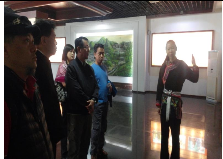
中華畬族宮導覽解說