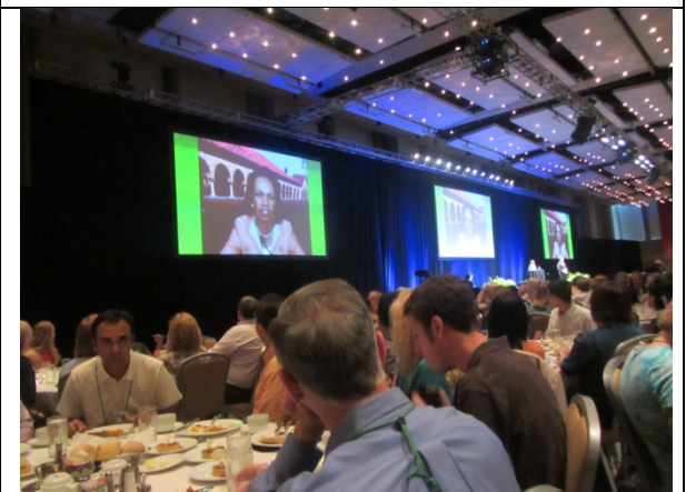
美國前國務卿萊斯(Concoleeza Rice)演講