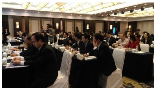
第 26 次孫宋紀念地聯席會開會情形 (2014//10/30)

本館於 1990 年 8 月第二次在廣東翠亨村舉行時，首次派員參加，聯席會迄今已舉辦 26 次，計派員參加 17 次，本館參加歷次孫宋紀念地聯席會情形附表一。本館曾於建國 100 年(2011)在臺北市舉辦第 23 次孫中山、宋慶齡紀念地聯席會議，共有來自海峽兩岸、香港、澳門、美國、日本、菲律賓、馬來西亞及新加坡等地的 76 名代表與會，並邀請中國國民黨黨史館邵銘煌館長主講「孫中山與臺灣」，說明國父與臺灣那看似「短暫卻又影響深遠」的關係，以及國立臺灣大學國家發展研究所鄧志松教授主講「孫中山的革命行旅」，剖析國父為籌措革命及建設國家而踏遍全球，於日本、夏威夷、美洲、歐洲及東南亞等地皆留下足跡。會後並安排與會代表參觀國父史蹟紀念館(梅屋敷)、故宮博物院、101、鶯歌、日月潭、阿里山、太魯閣、花蓮等臺灣風景名勝等。