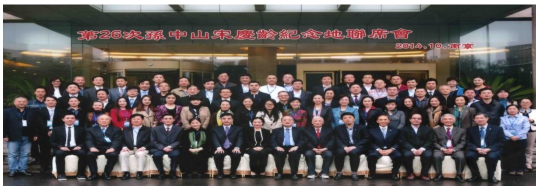
第 26 次孫中山宋慶齡紀念地聯席會議出席代表合影 (2014/10/31)

隨著參訪行程的結束，「第 26 次孫中山宋慶齡紀念地聯席會議」也劃下句點。大部分與會代表於第二天(11 月 1 日)上午返程離開，本館人員也於該日上午離開南京赴祿口機場，搭機返回台北，完成參加孫宋紀念地聯席之任務。