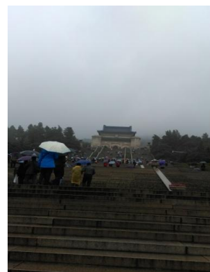
出席代表拜謁中山陵 (2014//10/31)

內幾乎沒有實牆，而是用竹子、荷葉等植物造景來作阻隔，由於用光影效果，使得館內視覺通透、很具空間感，讓參觀者進入館內有心曠神怡舒適感；館內主要展出六朝時期（距今約千年）的瓷器 and 陶俑等珍貴文物，是中國大陸第一個以『六朝』（東吳、東晉、宋、齊、梁、陳）為主題的博物館 2 。此博物館不管是在展件之擺放、光影效果之製作及參觀動線之規劃上，均屬一流，頗值博物館界學習。