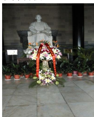
出席代表向國父銅像獻花致敬

第二天(10 月 31 日)主辦單位則安排與會代表參觀拜謁中山陵、革命陣亡將士公墓及參觀南京博物院。