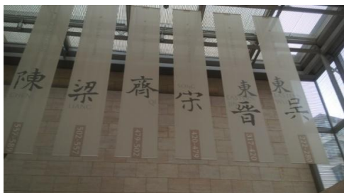
出席代表參觀六朝博物館 (2014//10/30)

臨時大總統，1927 年南京國民政府曾在此處辦公。目前總統府舊址仍陳設國父擔任臨時大總統時的辦公室、起居室及參謀本部等，國父孫中先生在此處開啓近代中國民主共和之航程，是國父重要史跡紀念地。 1 本館人員藉此特別拜會中國近代史遺址博物館王衛館長，除表達感謝盛情接待外，並對加強兩館間之合作與交流交換意見。