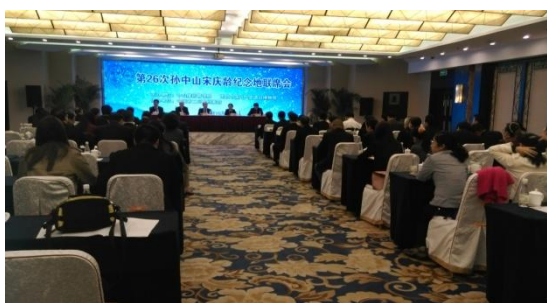
第 26 次孫宋紀念地聯席會開幕情形 (2014/10/30)

孫中山宋慶齡紀念地聯席會係全球孫、宋紀念地機構年度工作會議，亦是全球中山思想及其文物史料的重要交流平臺。本次會議本館係由推廣服務組龔錫家組長及研究典藏組羅美鎮副研究員代表參加，在會議中除發表工