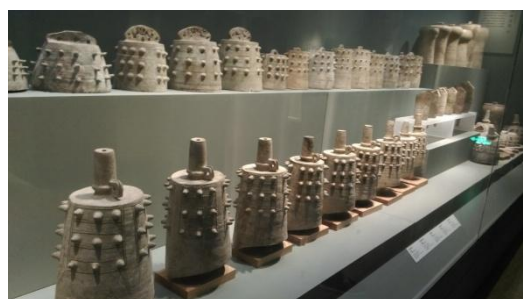
出席代表參觀南京博物院 (2014/10/31)

與會代表於參訪中山陵之後，當日下午則轉往南京博物院參觀。依南京博物院簡介說明，南京博物院坐落於南京市紫金山南邊，占地約 7 萬多平方公尺，是中國大陸第一座由國家投資興建的大型綜合類博物館。據統計，南京博物院藏品有 42 萬餘件，從舊石器時代所發掘的考古文物，到當代藝術作品均有收藏，有全國性的，也有地區性的；有宮廷文物，也有民間社會所徵集或捐贈之藝術品。所收藏的品項計有青銅、玉石、陶瓷、金銀器皿、竹木牙角、漆器、絲織刺繡、書畫、印璽、碑刻造像文物等。種類繁多，藏品豐富，參觀南京博物院這些歷朝歷代的歷史文物，好似見證人類文明的發展史，頗有可看性，值得細細品味慢慢欣賞，整個參訪行程於下午結束。