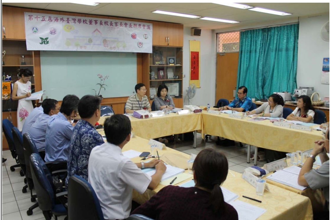
提案討論與綜合座談