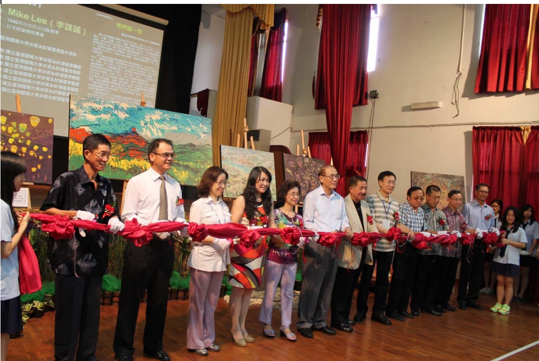
「劉其偉藝術特展」於雅加達臺校舉行開幕式。