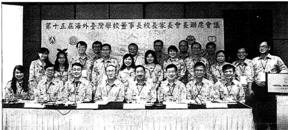
▲印尼雅加達台灣學校日前舉辦第15屆海外台灣學校董事長、校長暨家長會長聯席會議（簡稱三長會議），該會議也成爲教育部與各海外台灣學校間極爲重要的溝通平台。