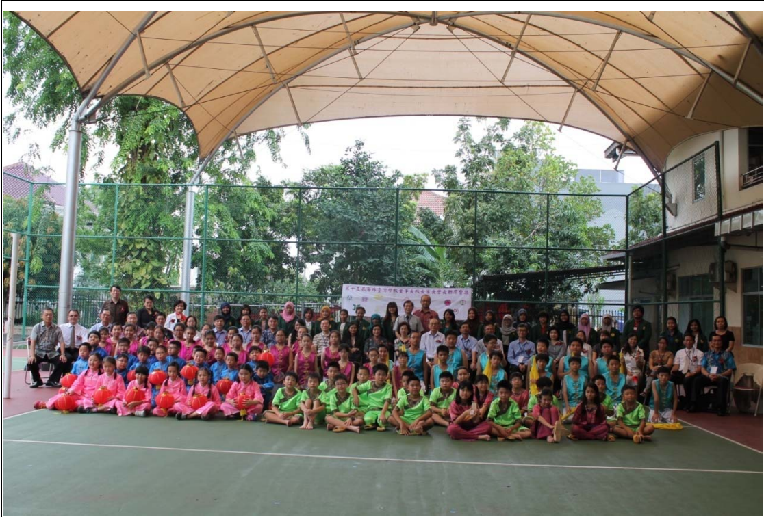
雅加達臺灣學校動態成果展合影