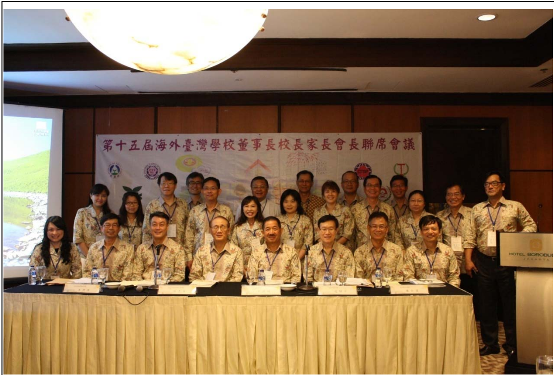
主要與會人員合影