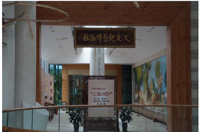
附設上海市人文紀念博物館