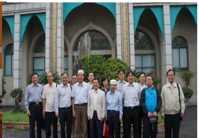
我方參訪團與回民公墓管理人員合照