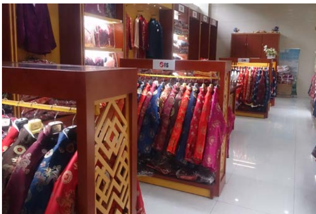
殯葬用品販賣部壽服展示