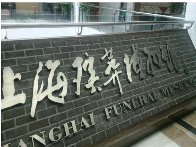
附設殯葬文化博物館