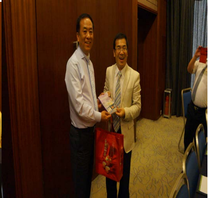
張副會長代表協會接受我方參訪團致禮