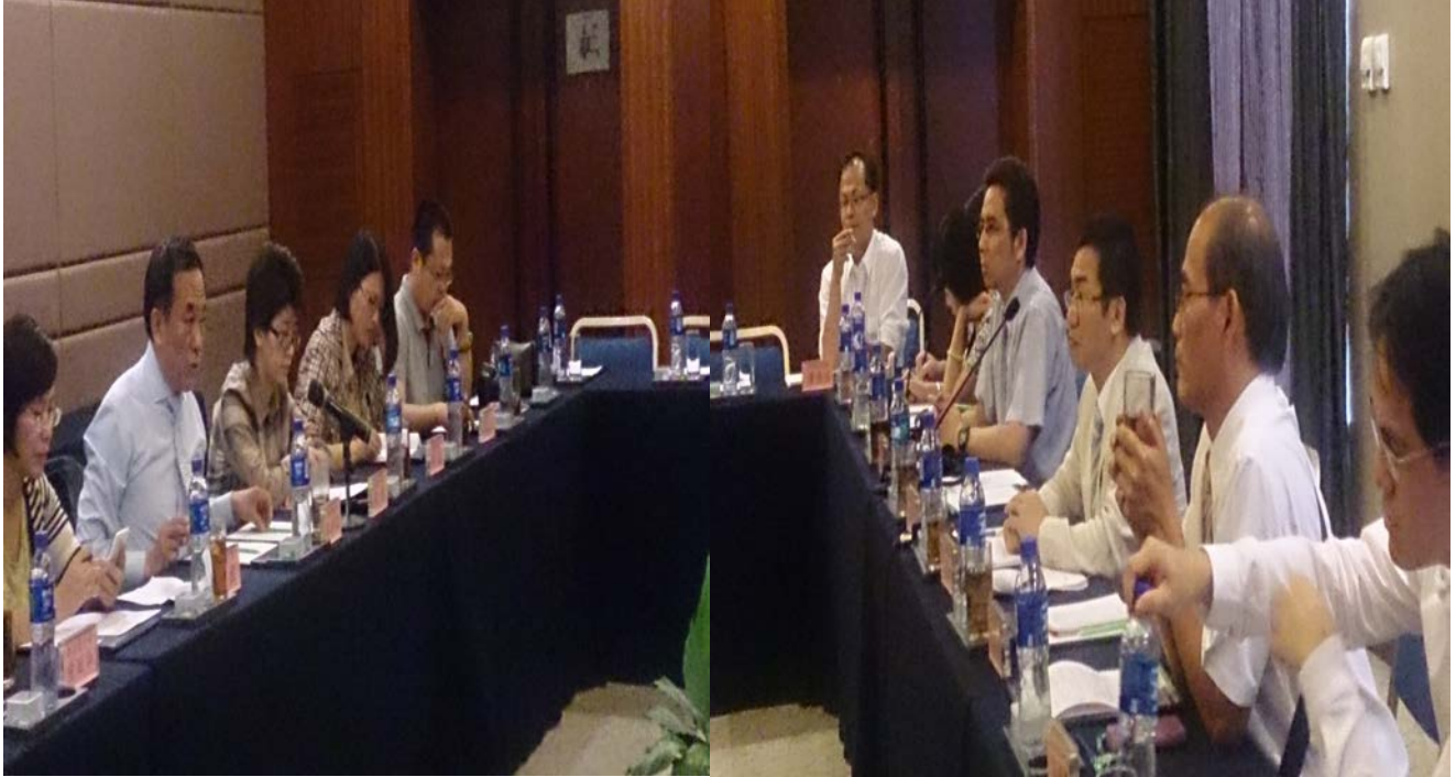
中國殯葬協會與我方參訪團交流兩岸殯葬行業發展現況