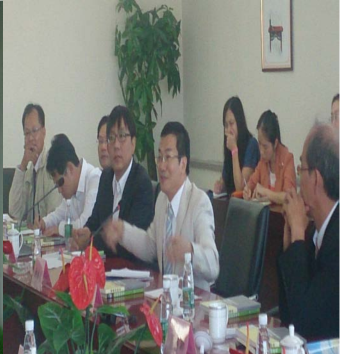
我方參訪團代表介紹我方殯葬業務現況