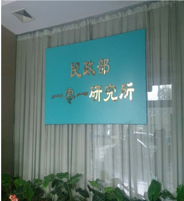
民政部一零一研究所入口處招牌