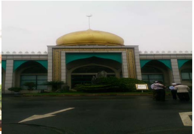
上海市回民公墓附設禮廳