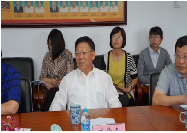
中國殯葬協會會長戚學森先生