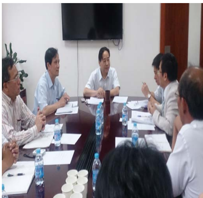
社會事務司與我方參訪團交流兩岸殯葬法規