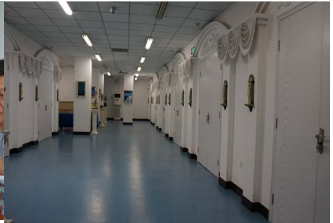
地下各間小型守靈室門外