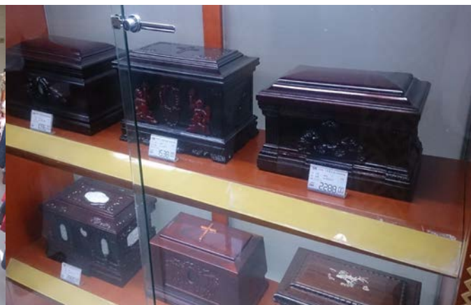
殯葬用品販賣部骨灰盒展示