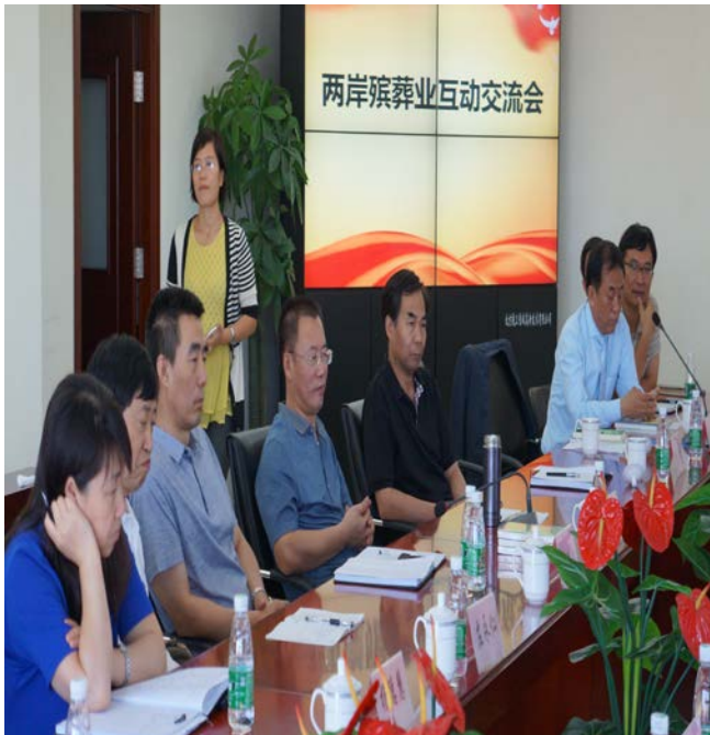
民政部一零一研究所出席人員