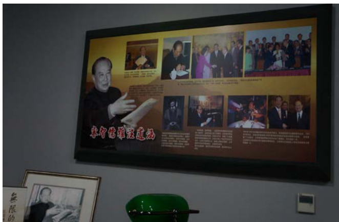
前海協會會長汪道涵紀念展示