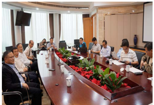
福壽園朱總經理向我方參訪團介紹園區狀況