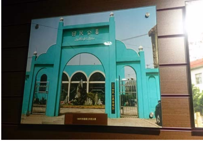
上海市回民公墓舊有照片