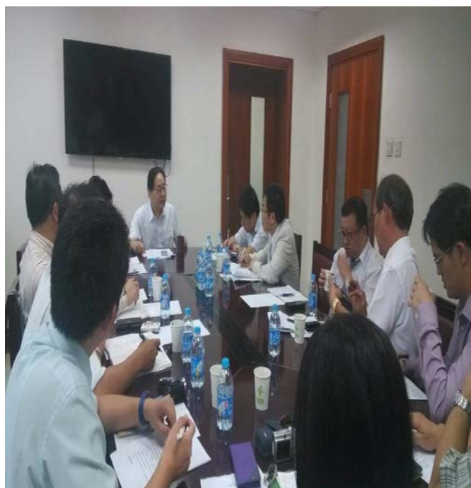
陸方社會事務司網站報導相片