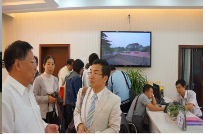
我方參訪團參觀殯儀館受理櫃檯