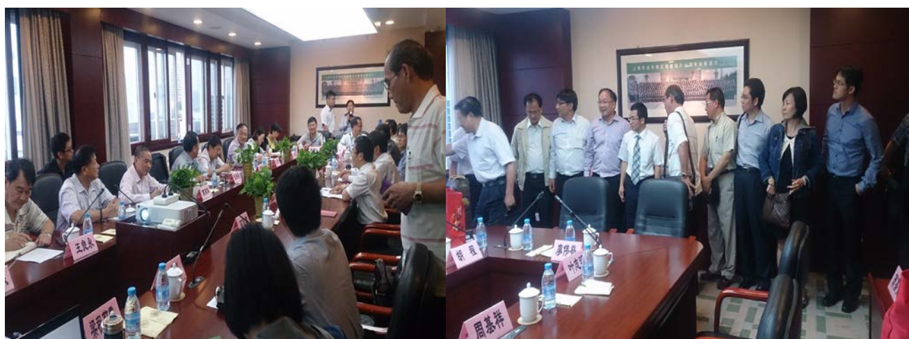
我方參訪團與上海市殯葬官員交流