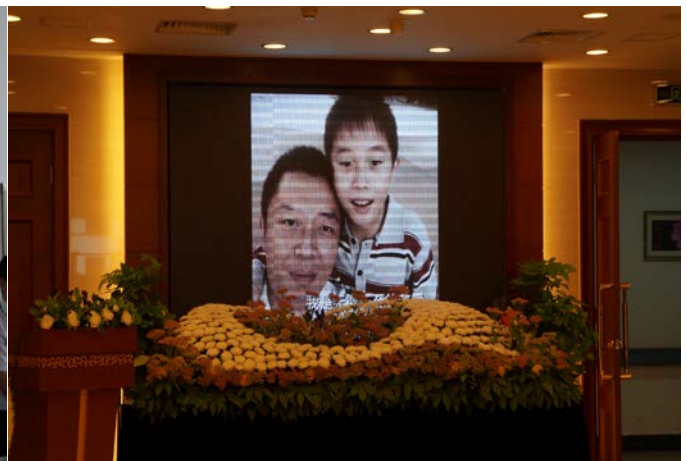
中型禮廳內個性化追思影片播放