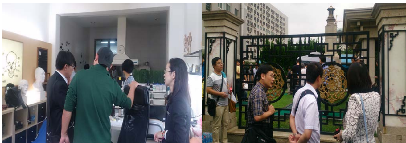
遺體儀容修復工作室