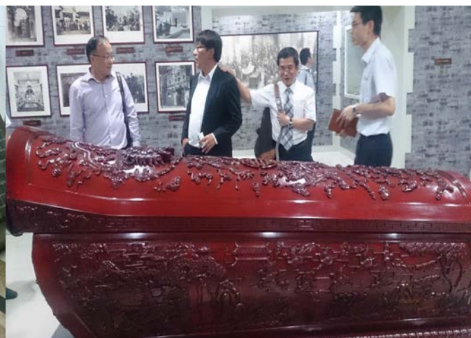
高級紅檜木製棺材展示