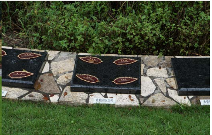
環保生態葬紀念碑