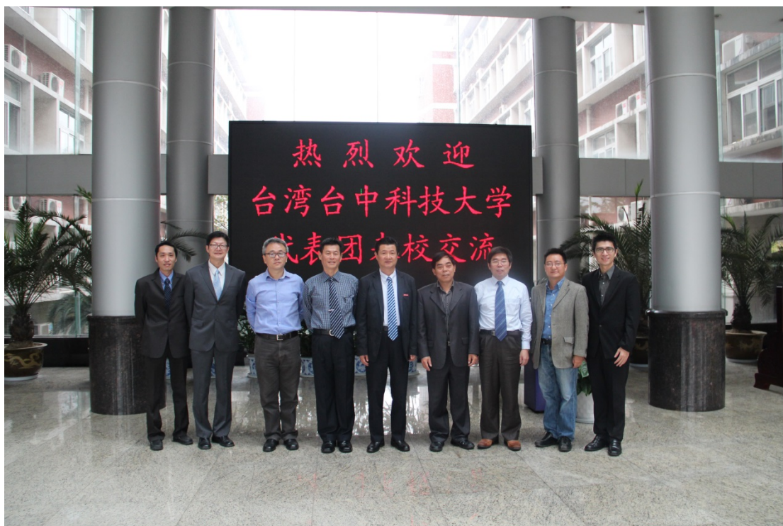
圖 15. 本校參訪團成員與中國計量學院成員合影留念