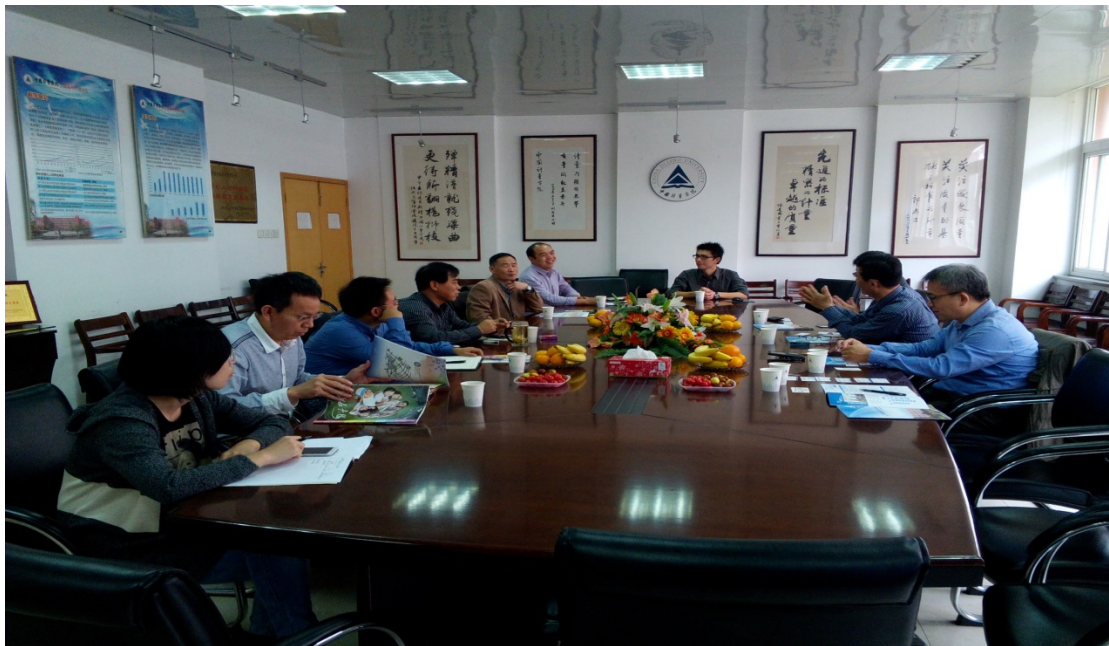
圖 9. 經濟與管理學院與我校參訪團分享教育經驗