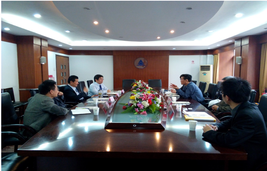
圖 8. 中國計量學院副校長與我校參訪團教育研討會