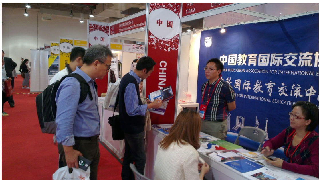
圖 18. 參觀中國教育國際交流處介紹