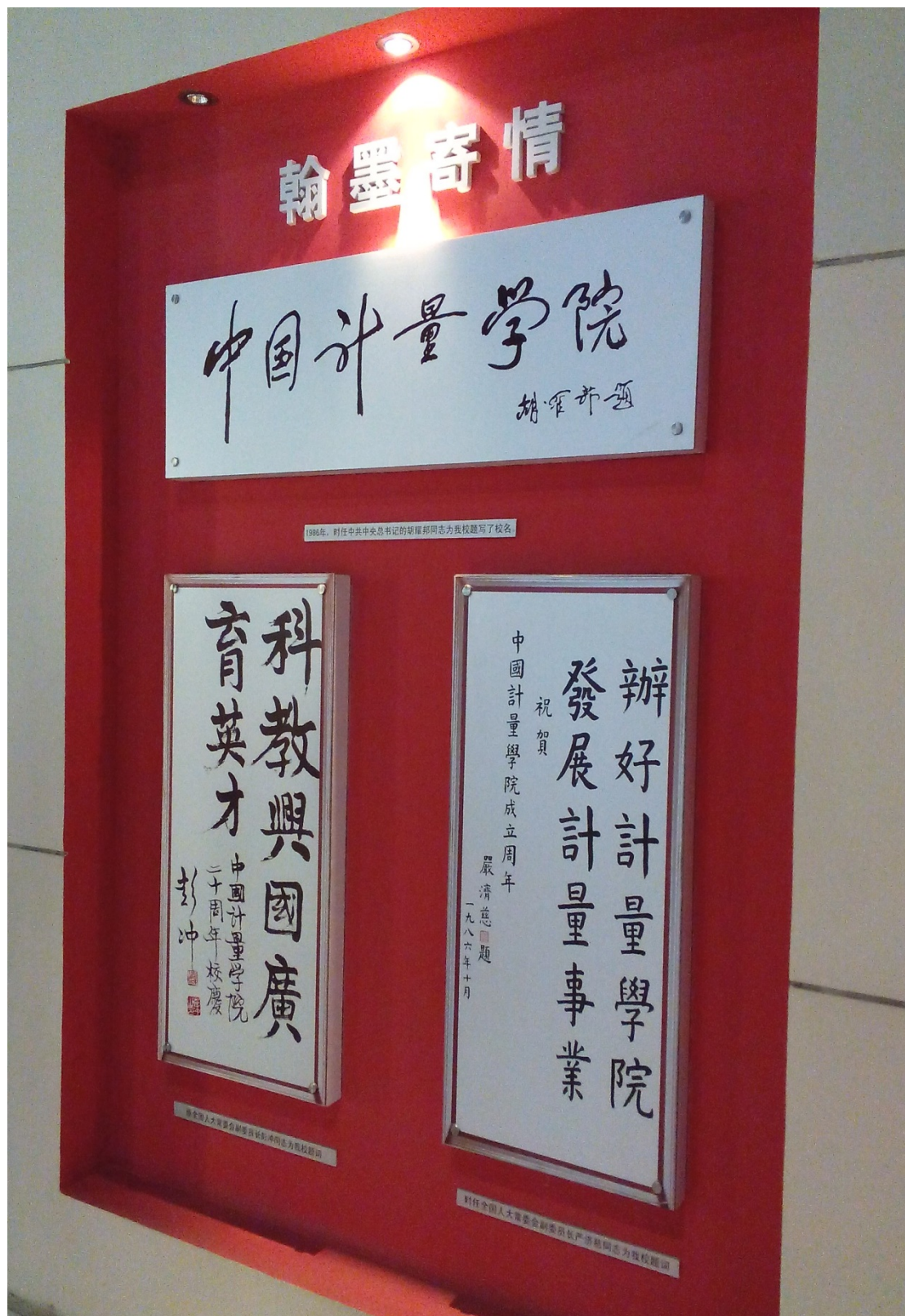
圖 1. 中國計量學院入口處標語