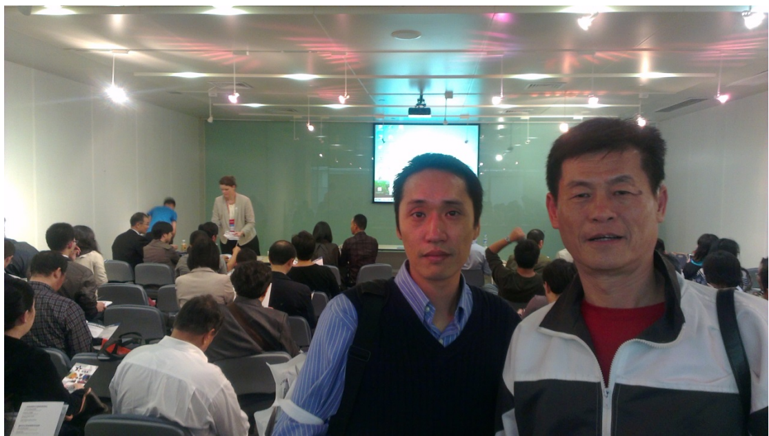
圖 20. 參與澳洲技職教育的說明會