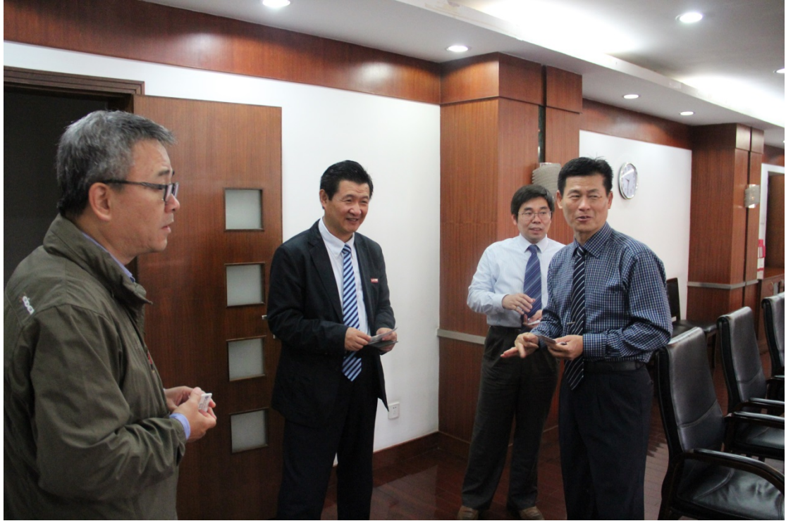
圖 4. 本校參訪團成員與中國計量校方人員交換名片