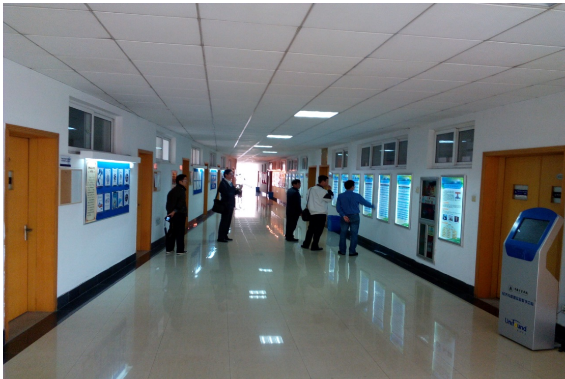
圖 11. 參觀經濟與管理學院