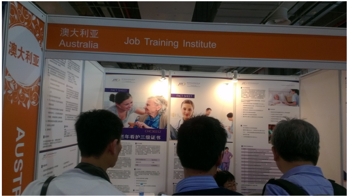
圖 19. 澳洲技職教育的講解