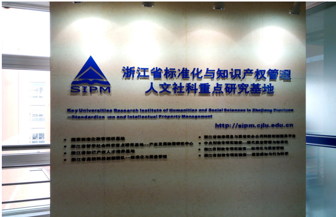
圖 10. 中國計量學院也是浙江省重點研究基地