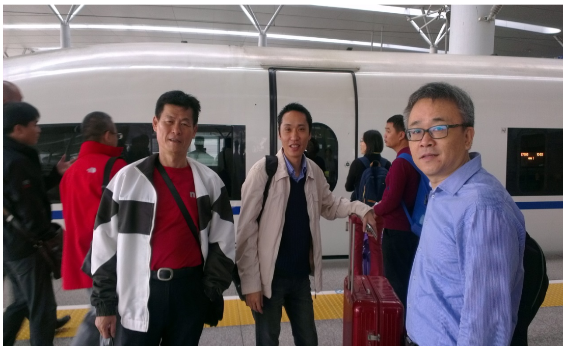
圖 16. 本校參訪團成員搭乘高鐵前往上海虹橋