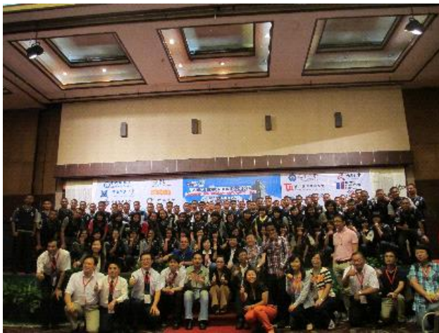
主辦單位特邀蘇門答臘北區的 Yayasan Soposurung SMAN2 Balige 高中師生前來觀展