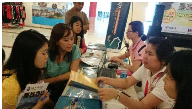
雅加達教育展攤位實況（一）