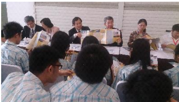
本宣導團向八華中學師生說明赴臺升學資訊