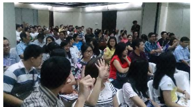
本團於棉蘭教育展宣導會場座無虛席參展學生及家長反應熱烈踴躍提問