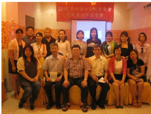
巴厘島招生宣導說明會與會人員合影留念