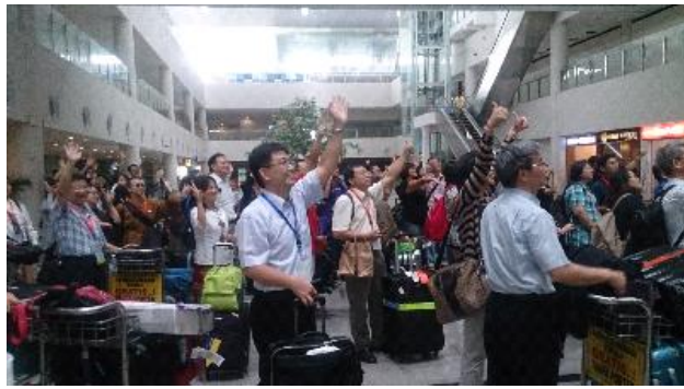
參展學校抵達棉蘭機場