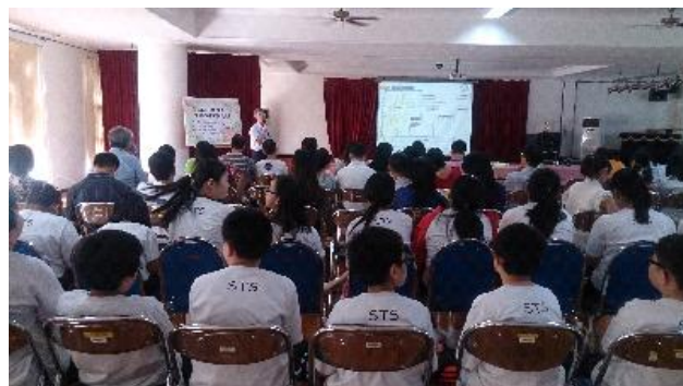
海外聯招會江總幹事大樹宣導赴臺升學管道