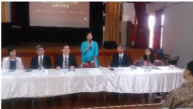
教育部林政務次長思伶蒞臨雅加達臺校宣導會場