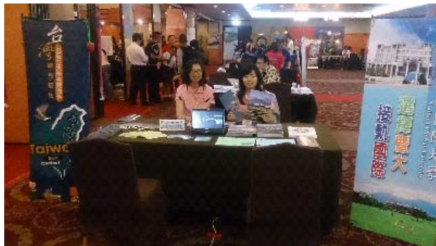
棉蘭教育展攤位布置妥當等候開展