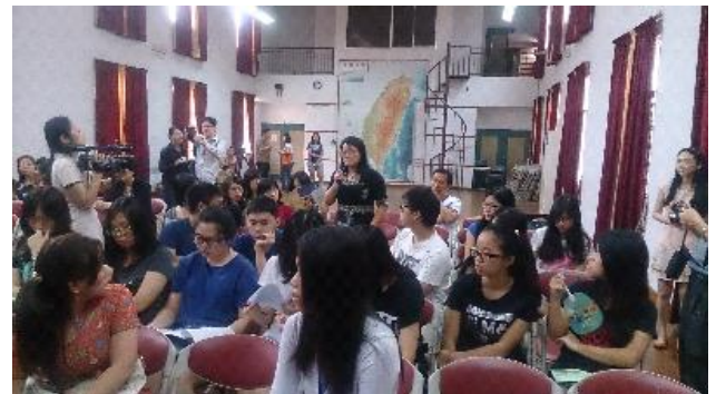
雅加達臺校師生及家長於宣導說明會踴躍發問