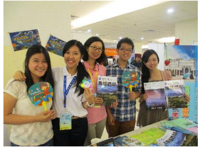
工作人員於雅加達教育展攤位合影