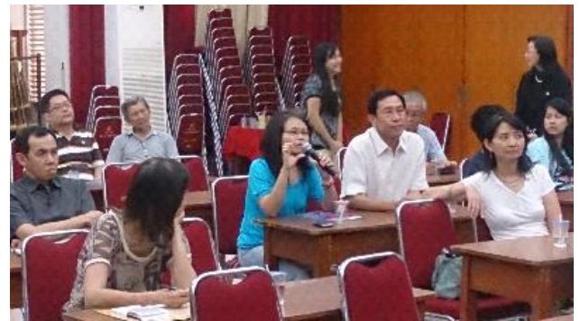
學生及家長積極詢問赴臺升學事宜