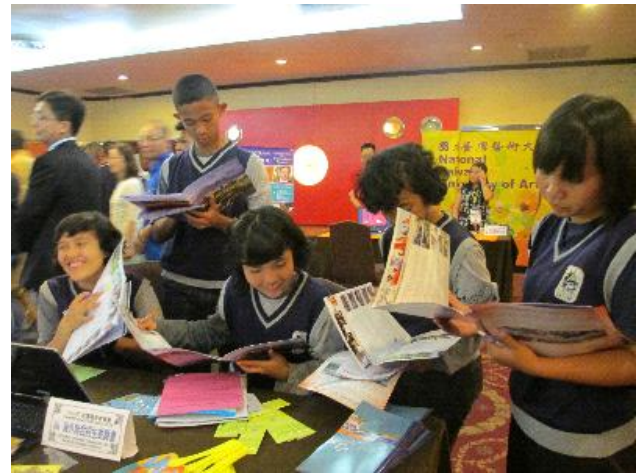
學生於棉蘭教育展攤位瞭解赴臺升學資訊