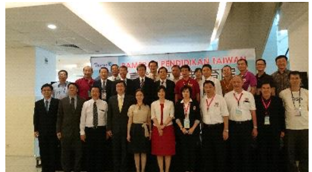
本團團員於雅加達教育展開幕式合影留念