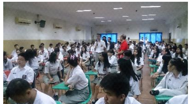
P.H.K.M 三語中學學生於宣導說明會中踴躍提問