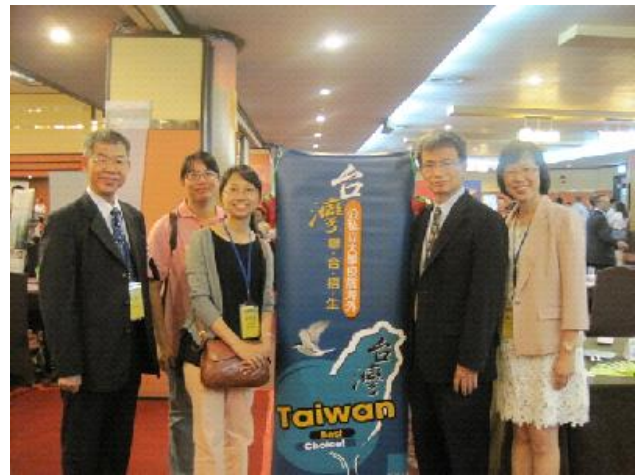
本團團員於棉蘭教育展攤位合影