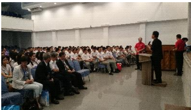
衛理中學第 2 校招生宣導說明會實況