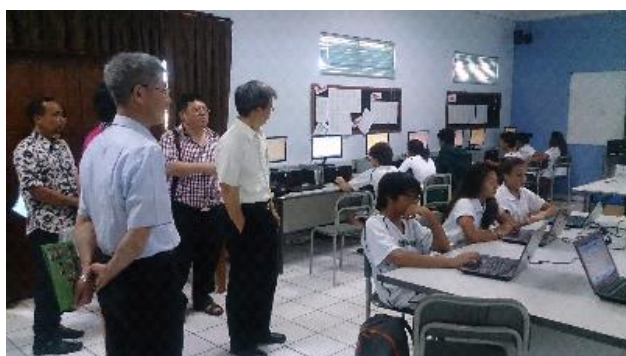
參訪峇厘島 Dyatmika School (雙語學校)