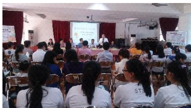
泗水臺灣學校招生宣導說明會實況