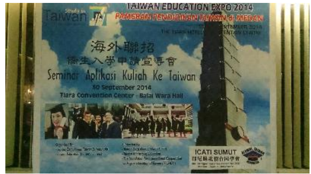
棉蘭教育展特闢專為僑生申請入學之宣導時段