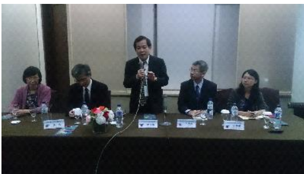
本團於棉蘭教育展場之招生宣導會實況