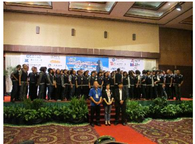
參訪學生合唱印尼歌曲答謝主辦單位及臺灣參展學校給予印尼學生了解赴臺升學之機會