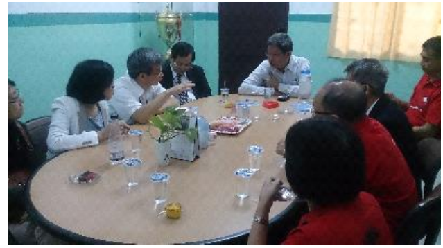
P.H.K.M 三語中學校董向宣導團員說明當地華語教師師資短缺、聘任外籍教師簽證