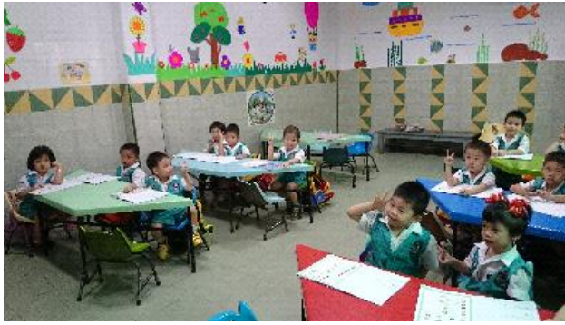
宣導會後參訪 P.H.K.M 三語中學校幼兒園，幼兒園小朋友以流利的中文與團員打招呼