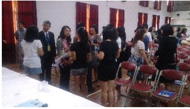
宣導會後學生及家長積極詢問來臺升學事宜