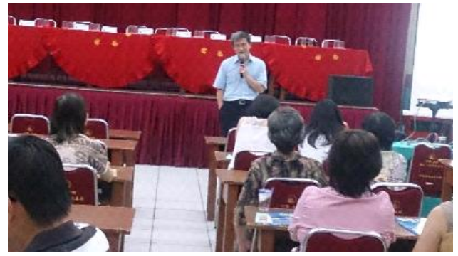
國立臺灣師範大學吳副校長正己宣導臺灣優質的高等教育