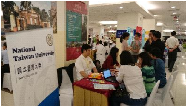
國內參展大學於雅加達教育展展場實況