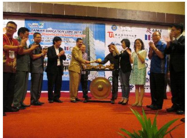
棉蘭教育展由印尼蘇北省副省長東姑艾利擔任開幕嘉賓