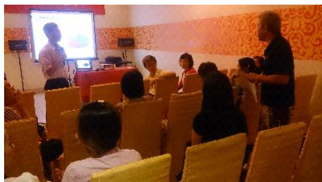
江總幹事大樹向與會家長解說赴臺升學事宜