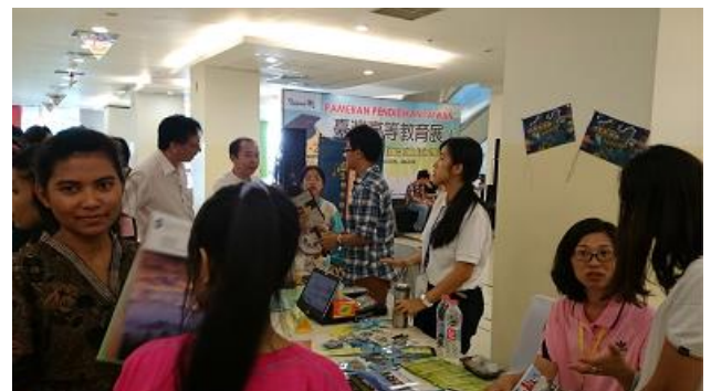
雅加達教育展攤位實況（二）