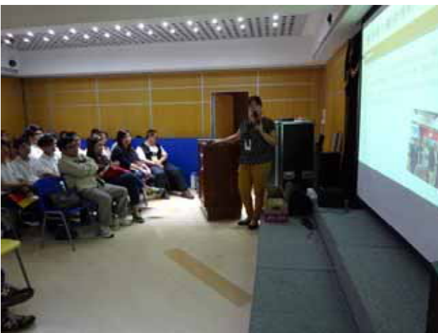
↪ 菜農子弟學校-東吳大學講座進行中。