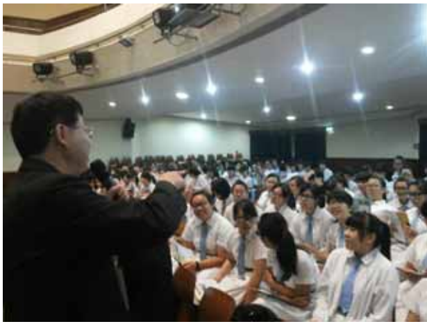
聖羅撒女子中學-朝陽科技大學講座進行中。