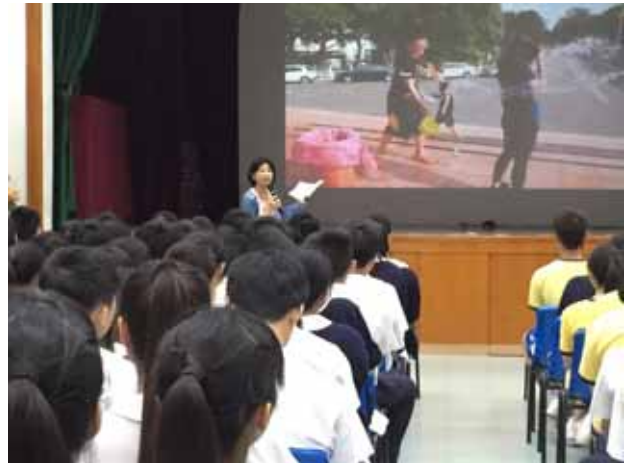
培道中學-淡江大學講座進行中。