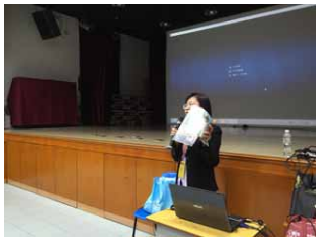
培道中學-高雄醫學大學講座進行中。