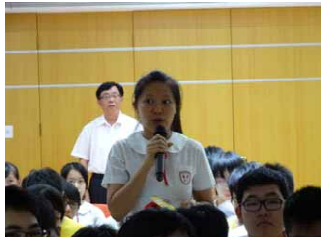
↪ 菜農子弟學校-學生提問赴臺升學相關問題。