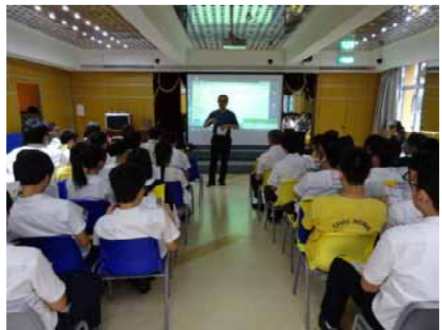
↪ 菜農子弟學校-國立東華大學講座進行中。