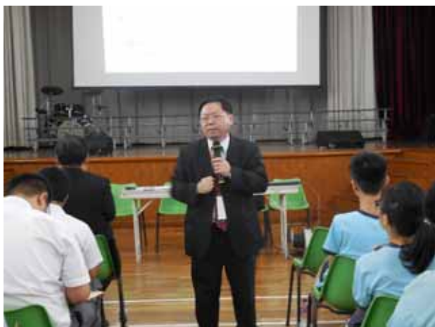
海星中學-輔仁大學講座進行中。