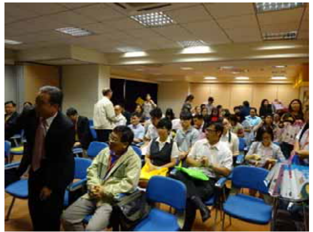
▶ 澳門試務座談會-團體報名學校老師就座。