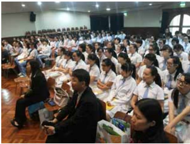
聖羅撒女子中學-專心聽講座的學生。