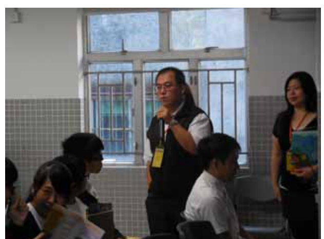
同善堂中學-景文科技大學講座進行中。