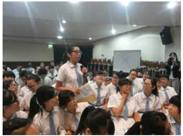
聖羅撒女子中學-學生提問赴臺升學相關問題。