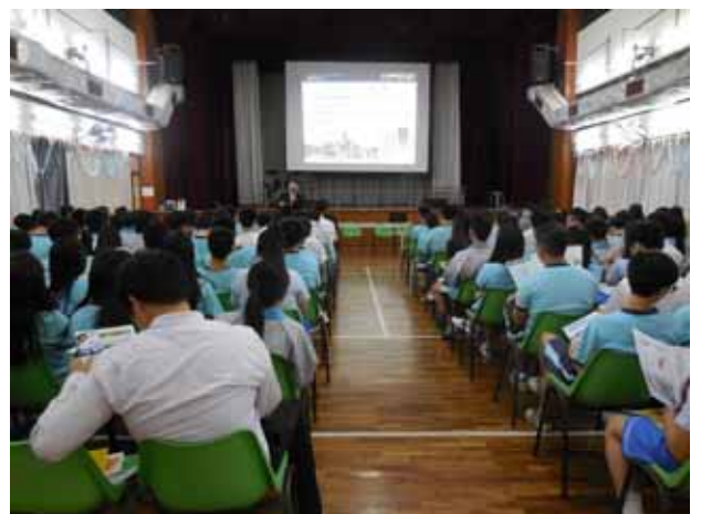
海星中學-朝陽科技大學講座進行中。