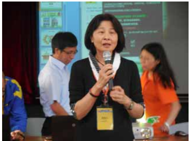
同善堂中學-淡江大學講座進行中。