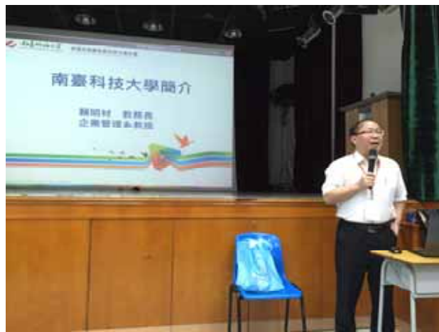
培道中學-南臺科技大學講座進行中。