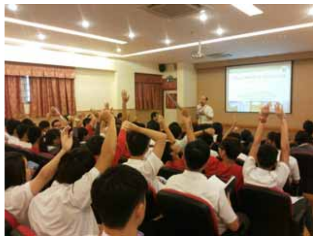
↪ 嶺南中學-國立暨南國際大學老師與學校互動熱烈。