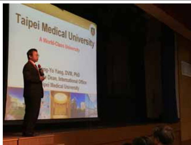
培正中學-臺北醫學大學講座進行中。