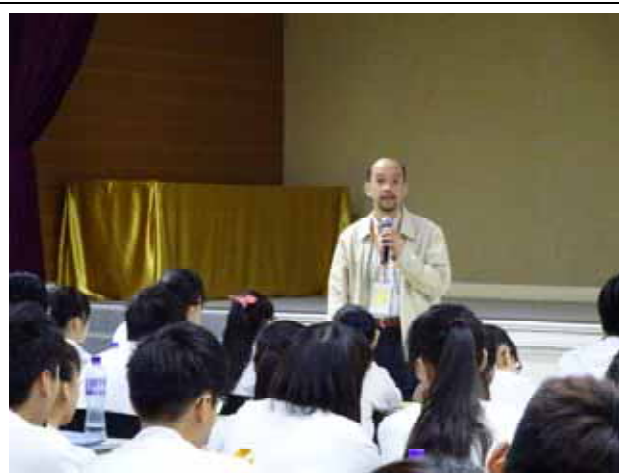
聖若瑟教區中學-國立暨南國際大學講座進行中。