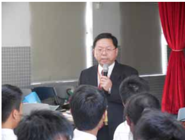
同善堂中學-輔仁大學講座進行中。