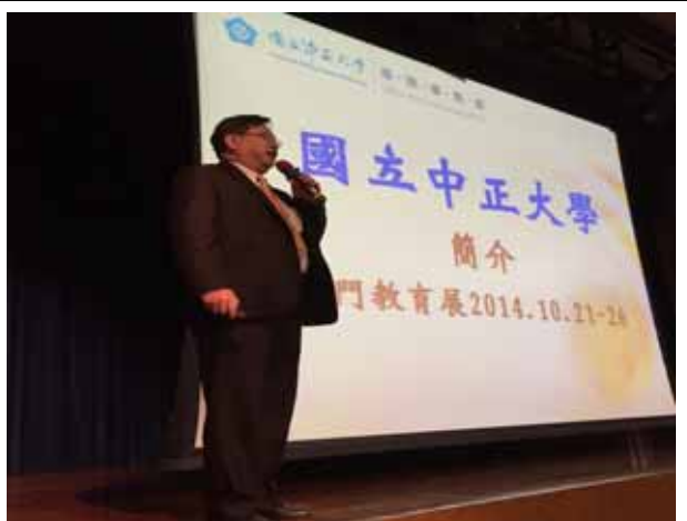
培正中學-國立中正大學講座進行中。