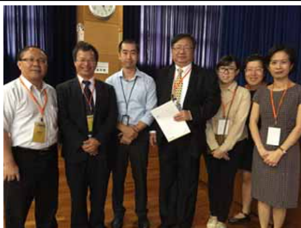
培正中學-各校代表與培正中學老師合影。