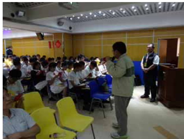
↪ 菜農子弟學校-景文科技大學講座進行中。