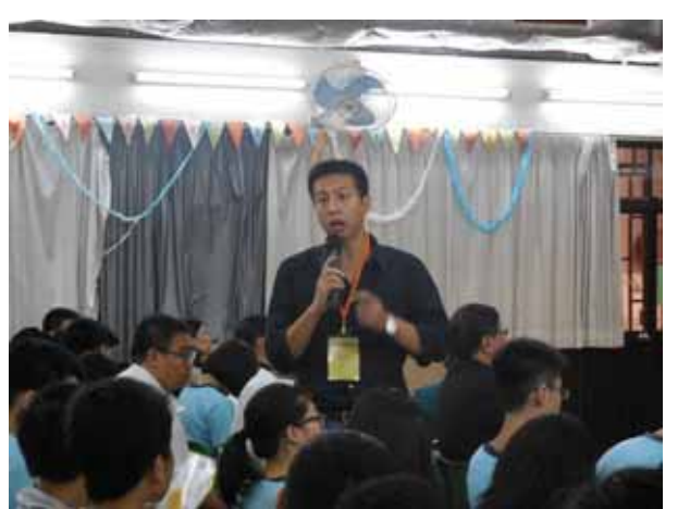
海星中學-東海大學講座進行中。