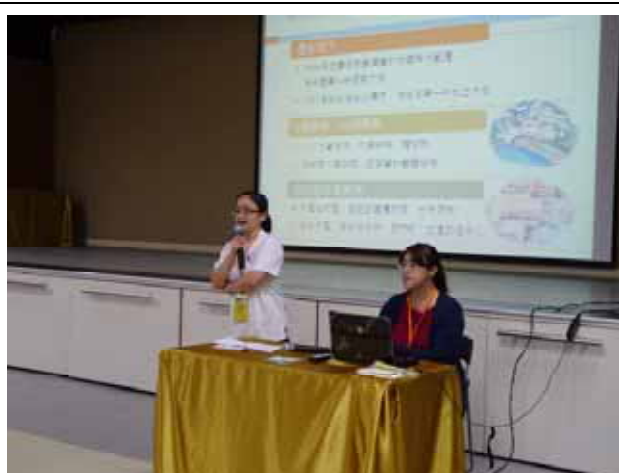
聖若瑟教區中學-東吳大學講座進行中。