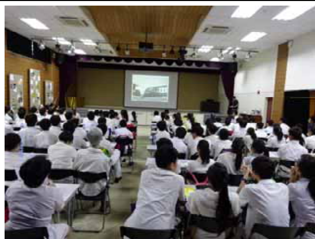
聖若瑟教區中學-弘光科大講座進行中。