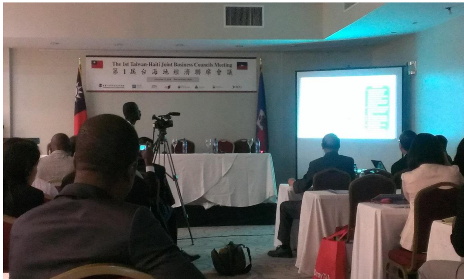
第 1 屆台海地經濟聯席會議