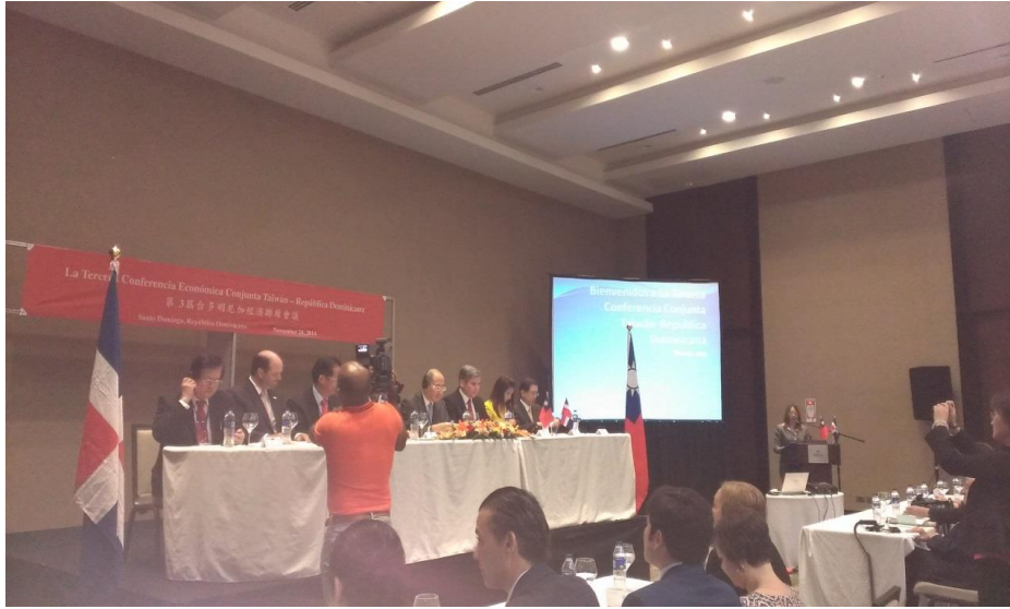
第 3 屆台多明尼加經濟聯席會議