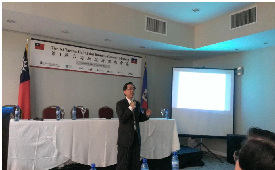
第 1 屆台海地經濟聯席會議