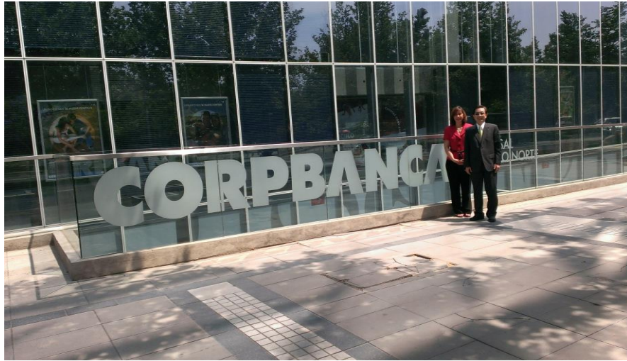
拜訪智利轉融資銀行 CorpBanca