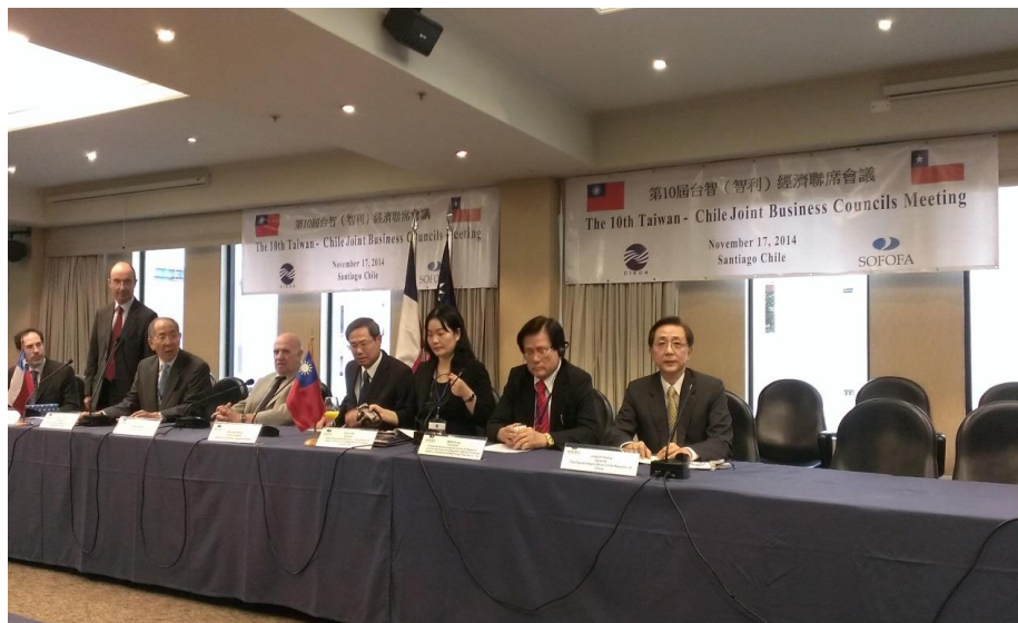
第 10 屆台智利經濟聯席會議