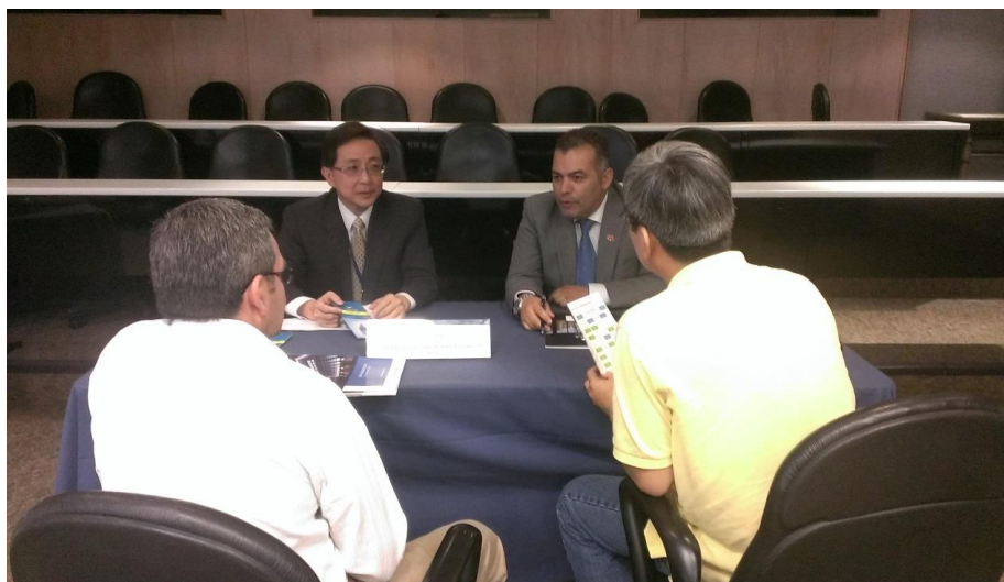
一對一貿易洽談會