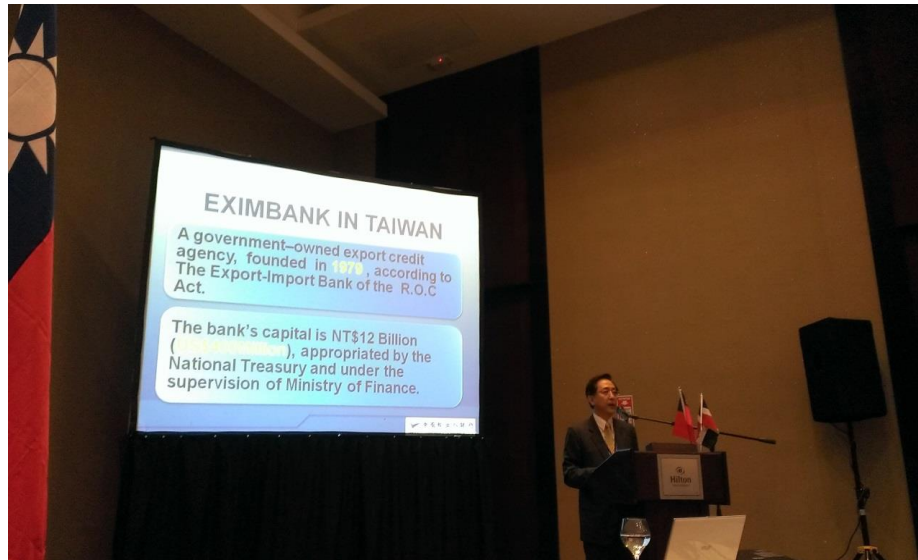
第 3 屆台多明尼加經濟聯席會議