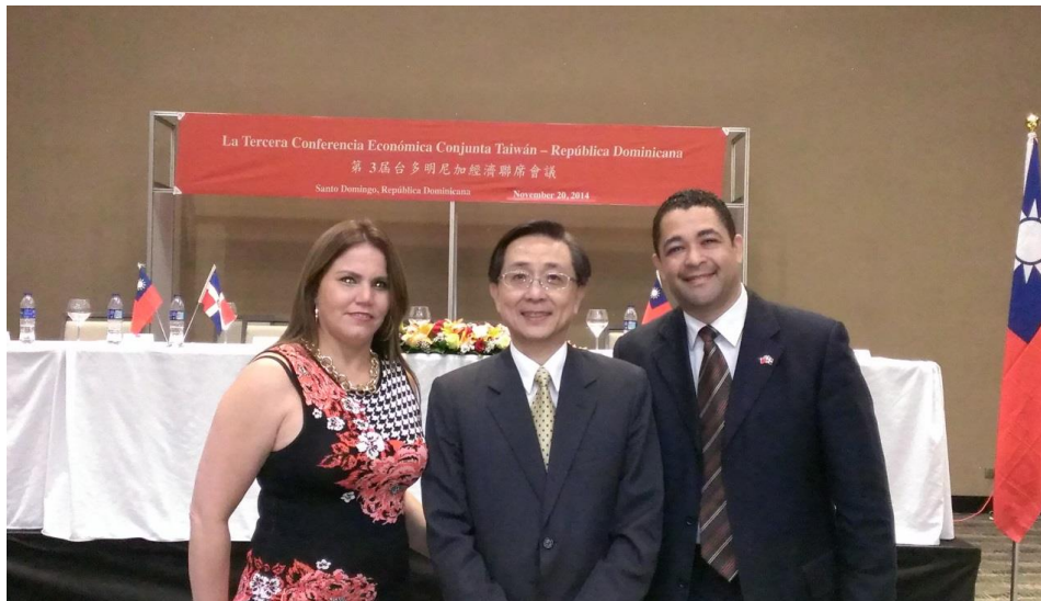
第 3 屆台多明尼加經濟聯席會議後與該國廠商合影