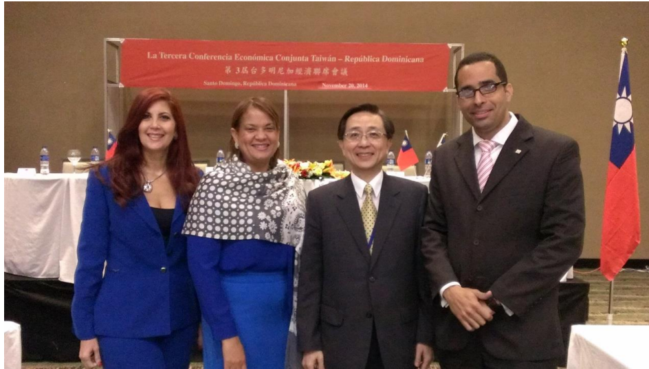
第 3 屆台多明尼加經濟聯席會議後與轉融資銀行 Banco Popular Dominicano 出席人員合影