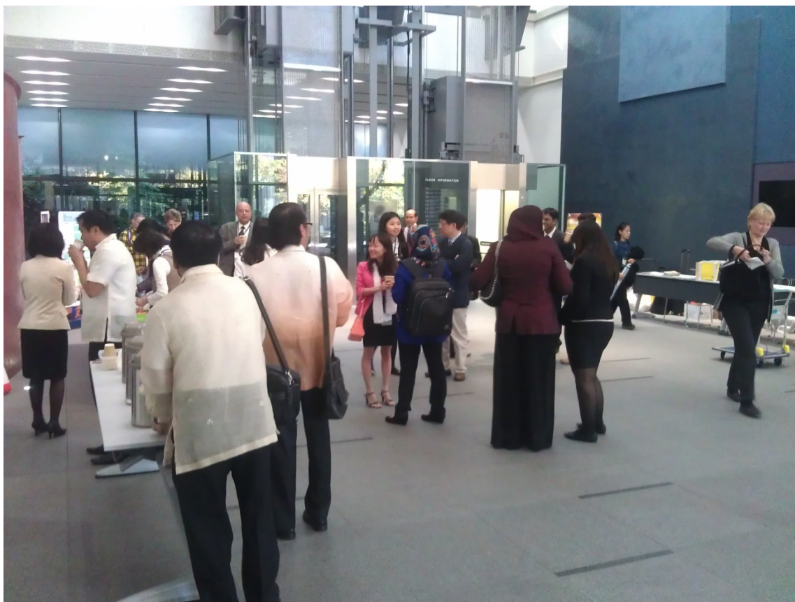
2014 ISEP 國際研討會交流