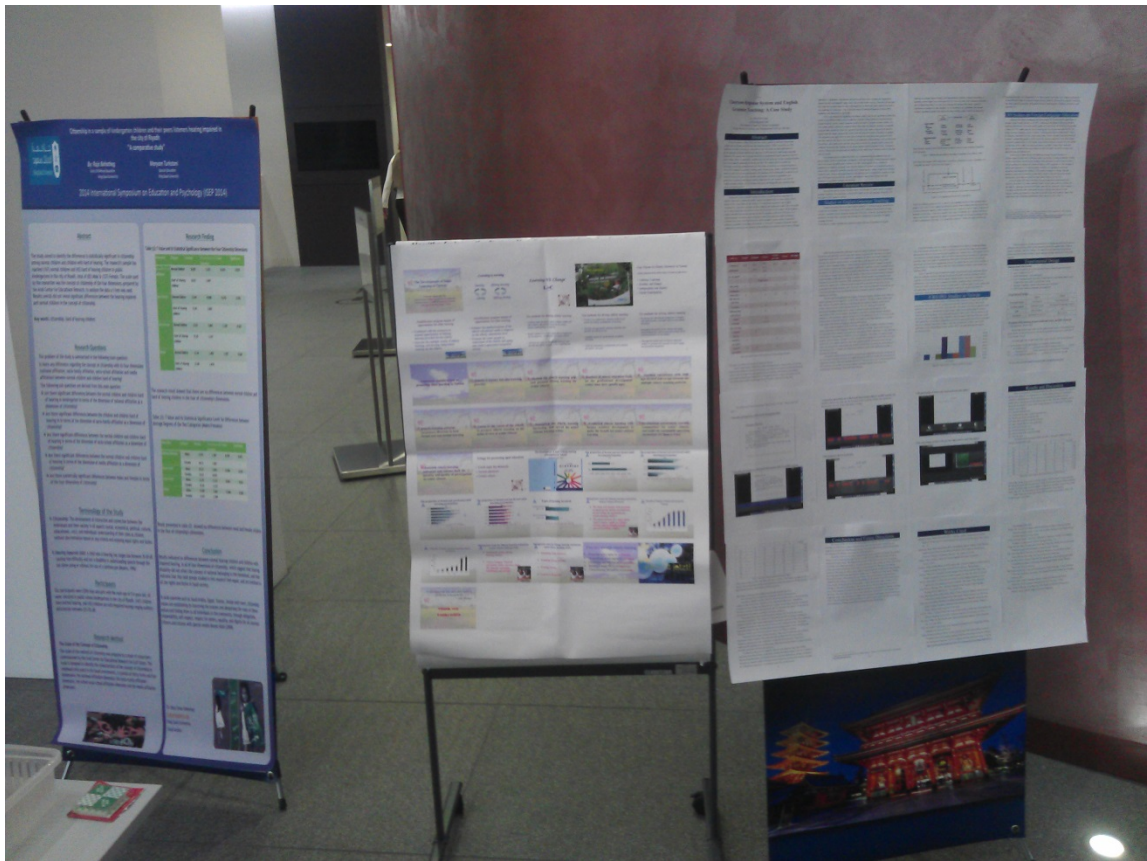
2014 ISEP 國際研討會論文發表