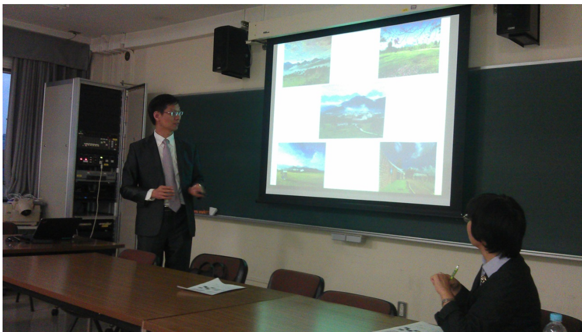
日本早稻田大學新保敦子教授學術交流