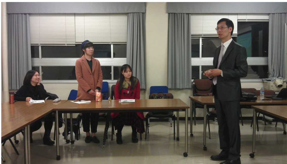
日本早稻田大學教育系師生學術交流