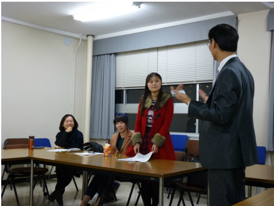
日本早稻田大學教育系師生交流合照