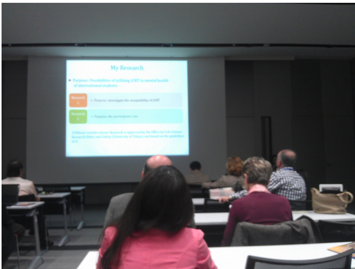
2014 ISEP 國際研討會寫實