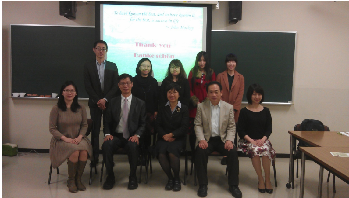
日本早稻田大學教育系師生交流合照