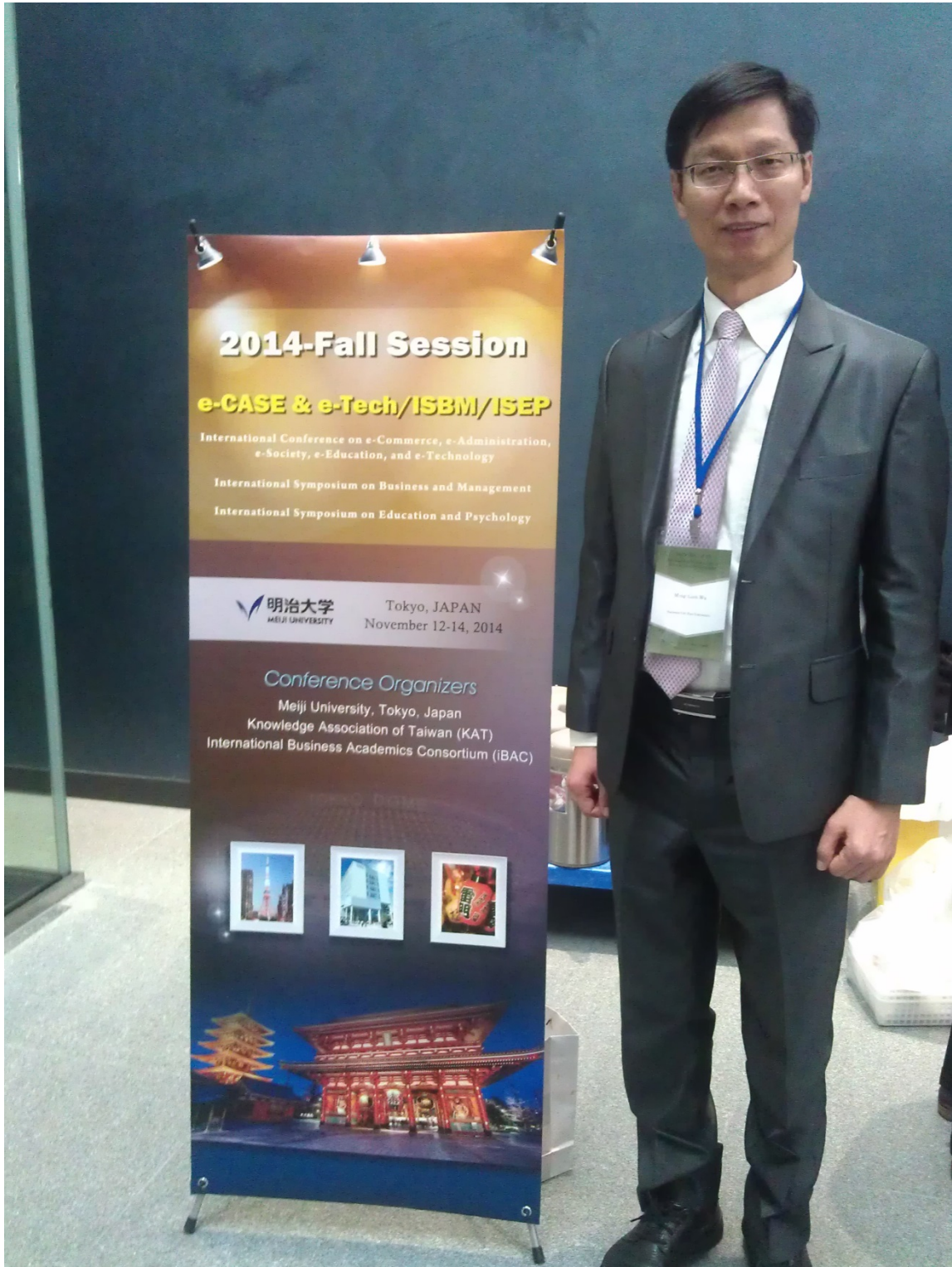
2014 ISEP 國際研討會論文發表