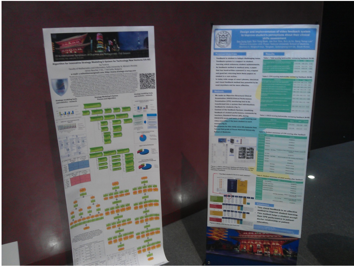
2014 ISEP 國際研討會論文發表