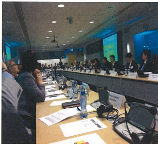
窗口會議場地即為平時歐盟司法組織 召開協調會議之會議室