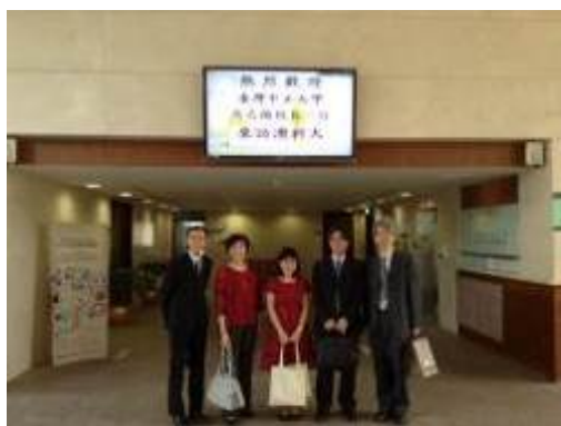
歡迎中正大學到訪澳科大

10月22日早上校長帶領國際長、文學院院長和教育學院院長,由校友會秘書長陪同,拜訪澳門理工大學,另一組中正人馬就委由國際處新成立之國際學院的執行長帶領3位同仁到澳門的高中招生。早上簽約儀式完成後我們去參觀了該校的醫學與生物研發建置,中午與該校校長,國際交流副校長(兼國際學院院長)及人文藝術學院院長一同聚會。因為澳門辦學政策著重多元、跨國及科際整合,澳門的兩所主要國立大學——澳門科技大學與澳門大學,已簽署為中正的姊妹校,澳門的學校在短時間內就成立了設備完善、人力充足且持續獲得經費補助的中醫研發產學合作單位,值得我們效法與學習,每次參訪姊妹校,都可以獲得不同的啟發,今天不論在簽約儀式上交換意見,或是午宴聊天之間,都從澳門科大校領導身上看見一個學校急速向上攀升的原因。