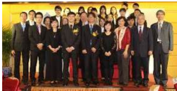
全體理監事與中正師長合照