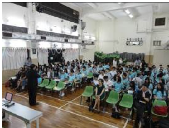
鎮教授向海星中學介紹本校

10月22日赴海星中學招生及參加教師座談，經由聯招會安排，與其他兩校共同赴海星中學進行招生，及參加聯招會為澳門中學教師安排之座談，介紹澳門僑生赴台升學之管道。本校成員亦藉此認識各中學負責升學業務之教師。