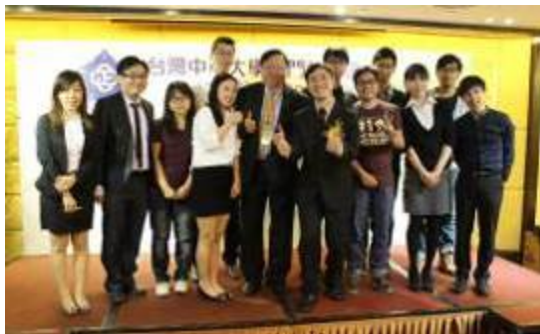
管理學院師生合照