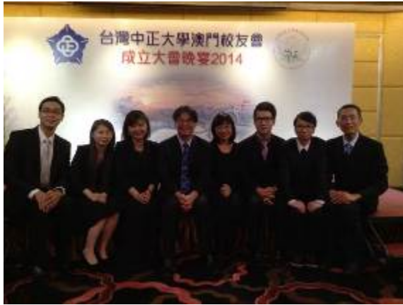
校長與法律系師生合影