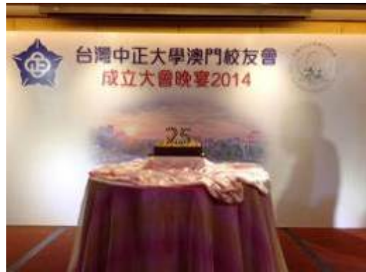
校友會精心準備的成立大會佈景