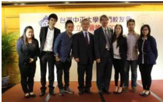
教育學院師生合照