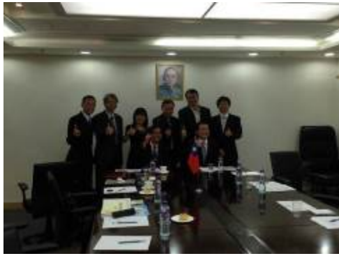
拜訪台北經濟文化辦事處(一)