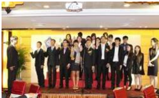
校友會全體理監事在吳校長監督下宣誓就職