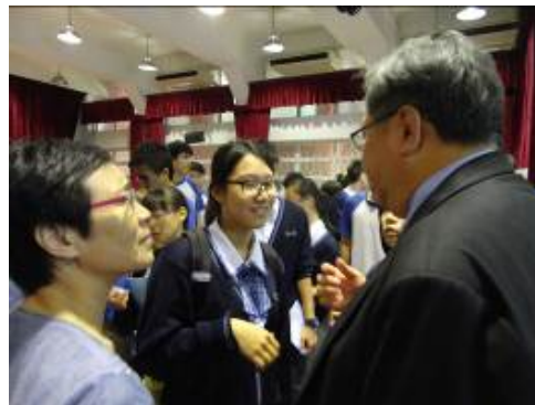
鎮副教授被學生包圍

10月23日上午，教育展同仁赴澳門高美士中葡中學招生，本場次由畢業校友安排赴高美士中葡中學招生。此場學生反應熱烈，就讀本校之意願頗高，會後鎮副教授被學生包圍，一一回答各項升學問題。