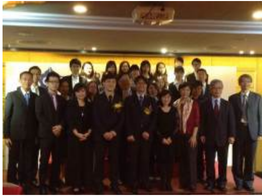
吳校長帶領中正師長團與校友會幹部大合照