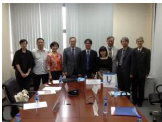
吳校長率團與姊妹校澳門大學合影

10月23日校長帶領教務長、國際長、文學院院長和教育學院院長，由校友會秘書長陪同，拜訪澳門大學。另一組中正人馬還是委由國際處國際學院執行長帶隊去高中招生。中午抵達澳門大學佔地廣闊的全新校區，由校長、第一副校長、書院(residential college)院長及國際長一起迎接我們，用完午餐後移動到會議室進行正式會談，在澳大校長的親自介紹中，可以清楚看見澳門大學在短短十幾年間從世界排名的千名之外向前躍升到泰晤士報(Times)世界排名第283位，從頂尖研究中心到專業與博雅並重，看見學校大且壯觀，設計細膩並體現全球化教育的多元化、跨界及整合功能並重。