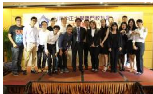
各學院師生與校長合照

10月23日上午，教育展同仁赴澳門高美士中葡中學招生，本場次由畢業校友安排赴高美士中葡中學招生。此場學生反應熱烈，就讀本校之意願頗高，會後鎮副教授被學生包圍，一一回答各項升學問題。