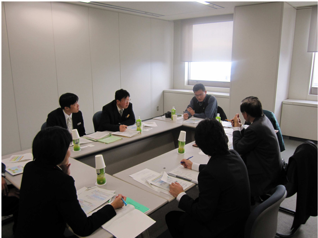
圖三、於群馬縣廳考察情形