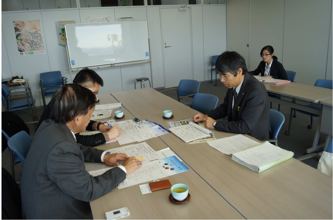
圖二、於茨城縣廳考察情形