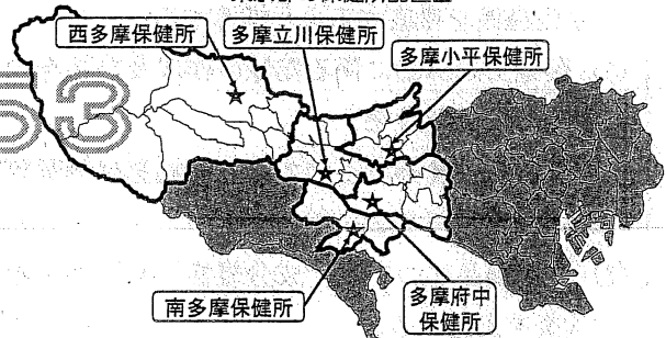
東京都の保健所配置図

特別区、八王子市及び町田市を除く地域における営業許可、食中毒等に係る調査及び健康安全研究センターにおいて対象としていない食品関係営業施設等に対する監視指導