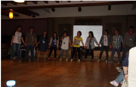
研習營雙方學生交流活動