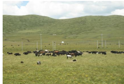
四川紅原縣高原藏族牦牛