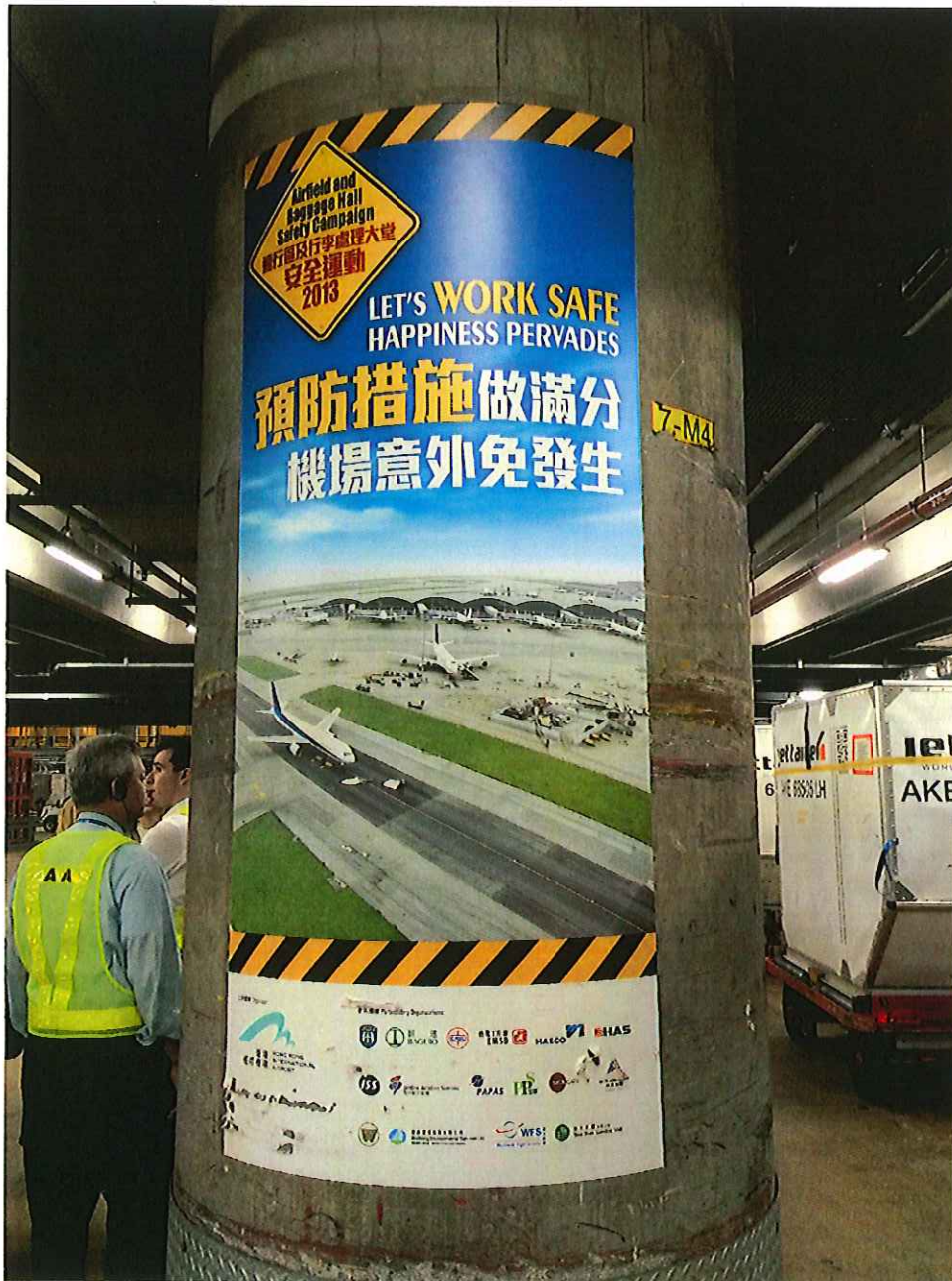
圖五、香港機場空側安全宣導之海報