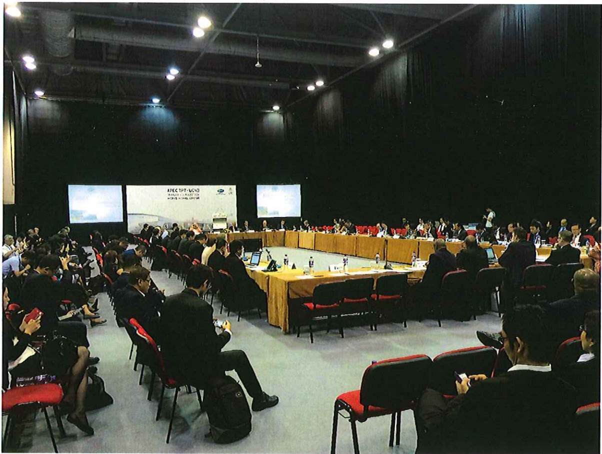
圖一、APEC 運輸工作小組會議照片