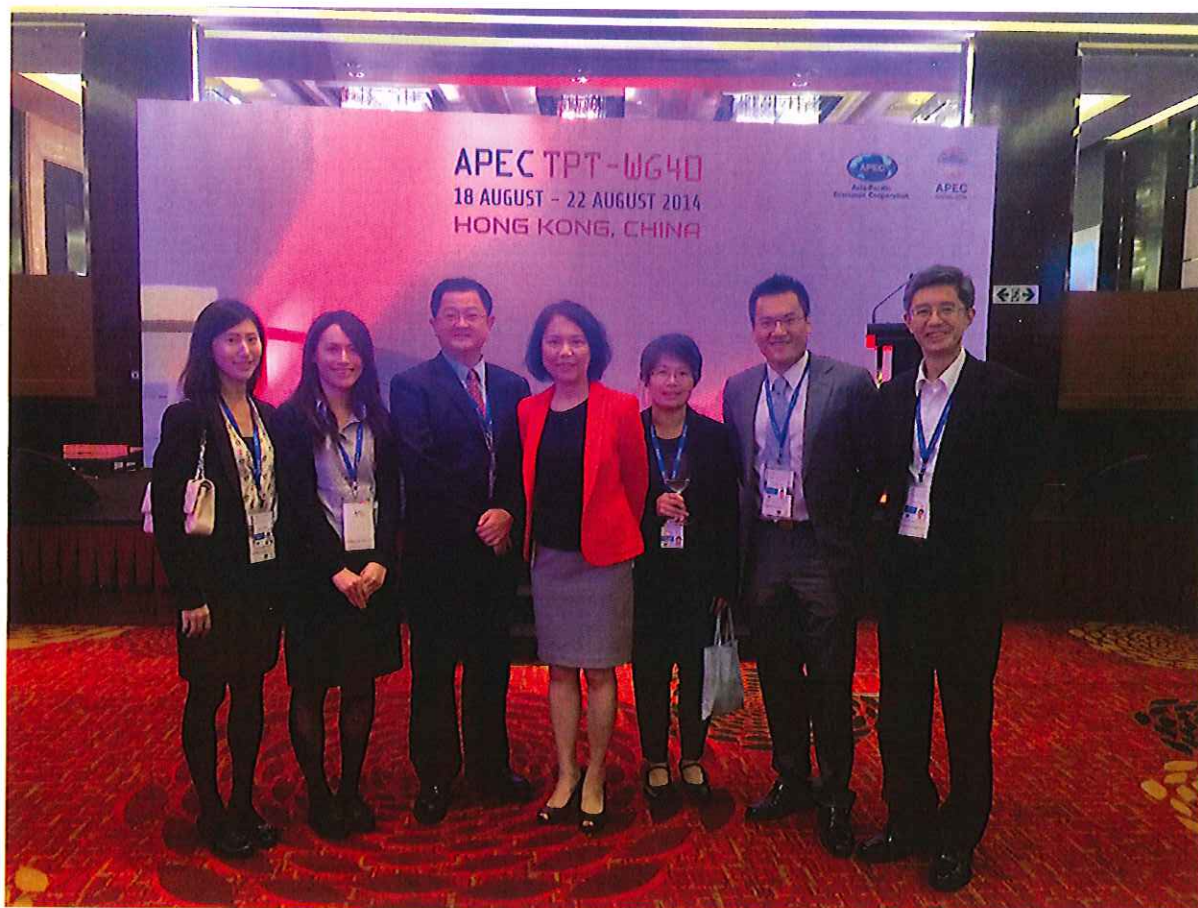
圖六、本公司、本國民用航空局及香港機場代表之合照