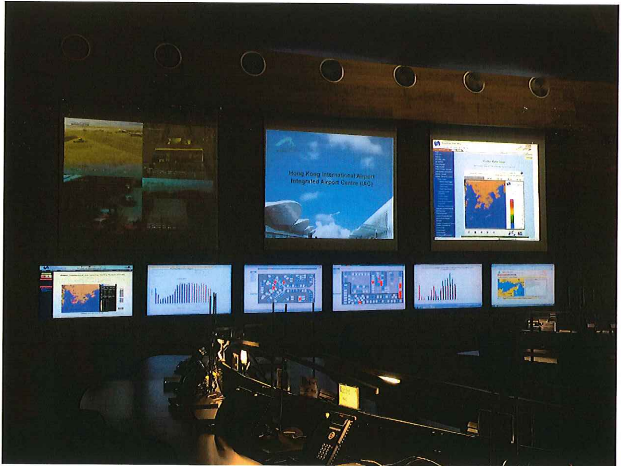
圖二、香港機場 OCC 照片