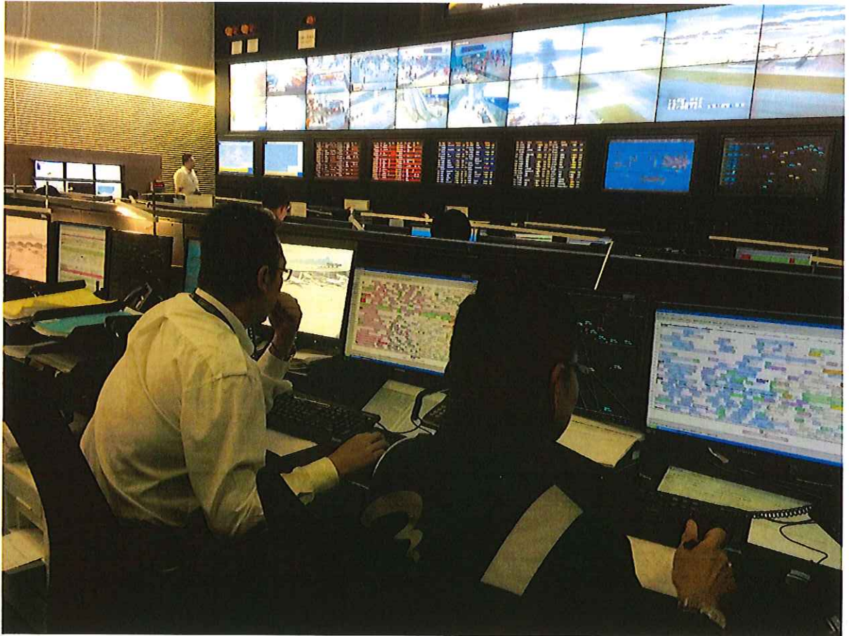
圖三、香港機場 OCC 排 bay 照片