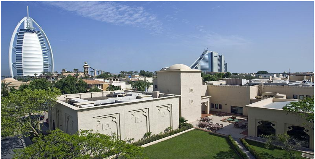
圖 1 ↑：阿聯酋酒店管理學院 The Emirates Academy Of Hospitality Management，該學院同時為國際朱美拉集團（Jumeriah Group）的一部分，董事長是阿聯酋現任副總統兼總理馬克圖姆閣下。學院受阿聯酋高等教育與科學研究部（the Ministry of Higher Education and Scientific Research in the United Arab Emirates）認證，同時是傑出酒店及旅遊教育國際中心（The International Centre of Excellence in Tourism &