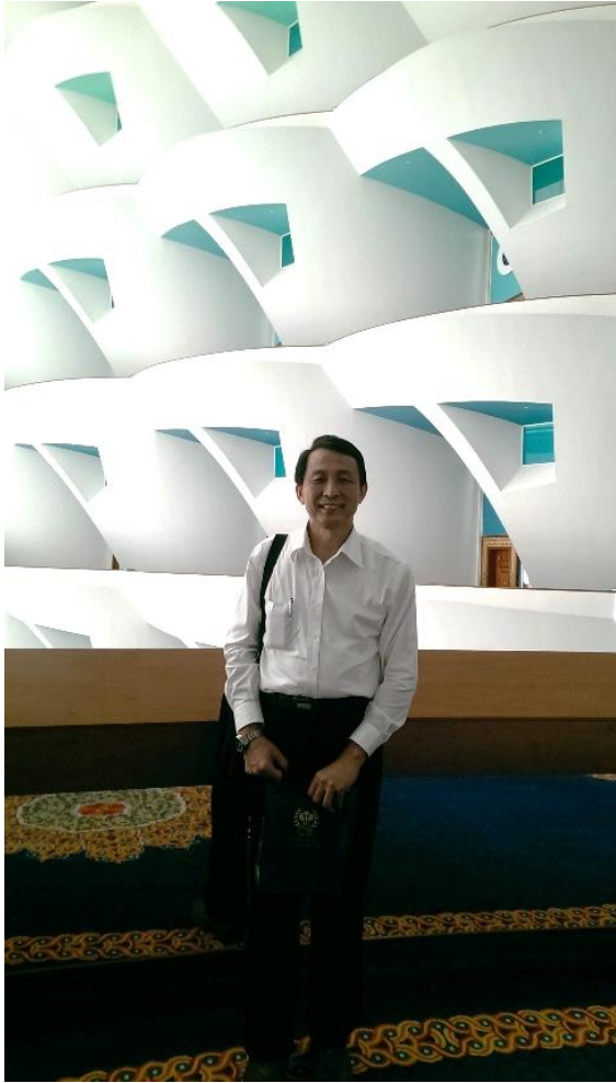
←圖 10：參訪杜拜卓美亞帆船酒店。