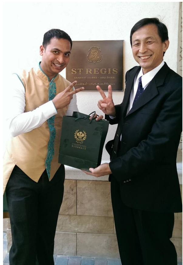
圖 9↑：與瑞吉酒店(THE ST. REGIS ABU DHABI)的 Butler 合影。