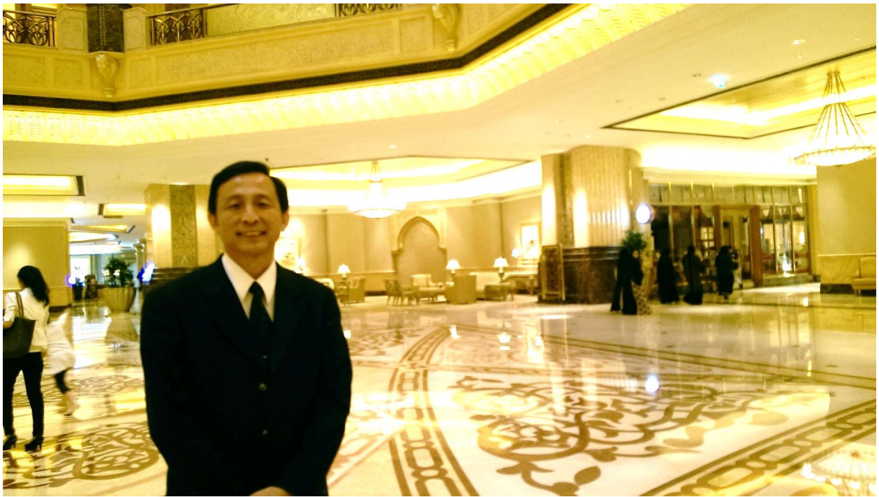
上圖↑：在阿布達比皇宮酒店(EMIRATES PALACE)內攝影留念。