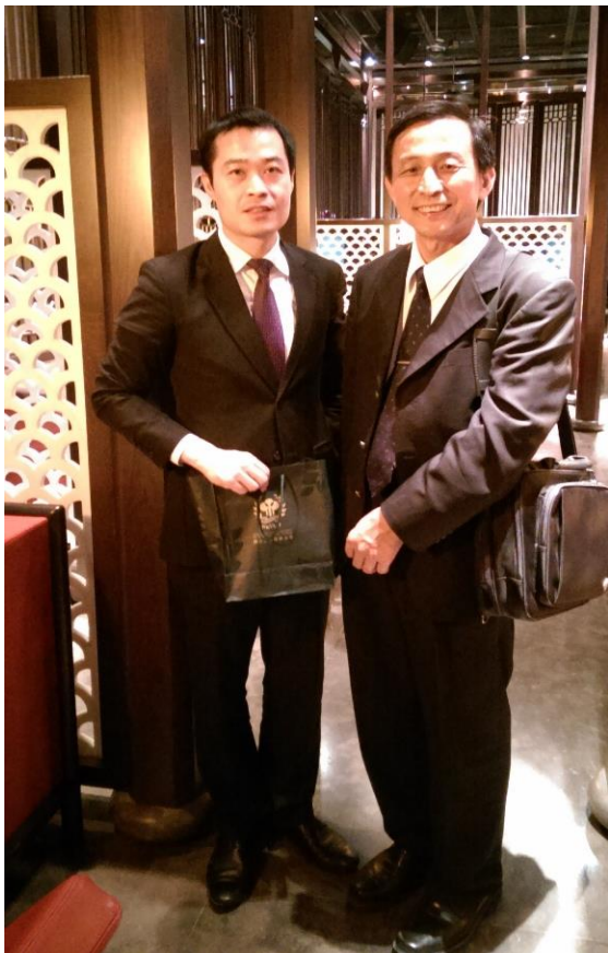
圖 8↑：與阿布達比皇宮酒店(EMIRATES PALACE)米其林餐廳經理攝影留念。