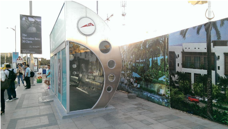
圖 5 ↑：杜拜市內的公車候車亭，幾何造型極有科技感，內部設有冷氣裝置。