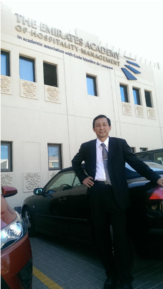
圖 6 ↑：在阿聯酋酒店管理學院建築前攝影留念。