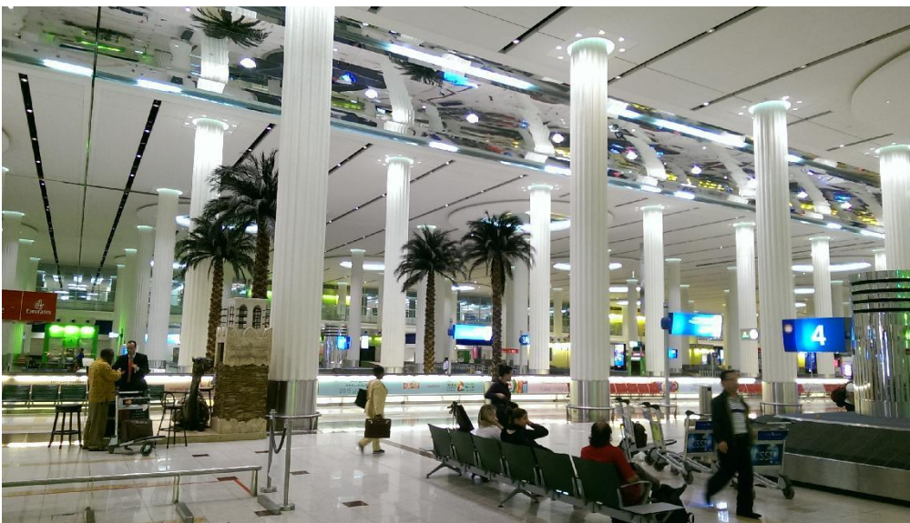
圖 4 ↑：杜拜亮眼及高科技感的機場。

來自英國的 COSTA 咖啡在杜拜機場的大型懸吊廣告，指在阿拉伯聯合酋長國內有 99。2010 年時，Costa Coffee 在英國超越了星巴克，成為英國市佔率最高的咖啡店和最大的連鎖店，可謂英國版的星巴克。