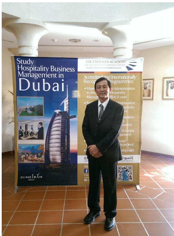
Hospitality Education，簡稱 THE-ICE）會員。學院提供國際領先的大學級酒店管理教育，其本科與碩士課程均針對培養未來的酒店精英。阿聯酋酒店管理學院與瑞士的洛桑酒店管理學院有密切學術合作，並且學院所有的課程都被阿聯酋教育部、英國的以及澳大利亞的所認證。學院也是的高級教育機構成員。