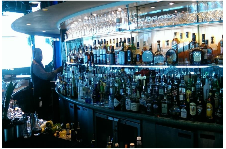
↓圖 11：杜拜卓美亞帆船酒店內的酒吧。