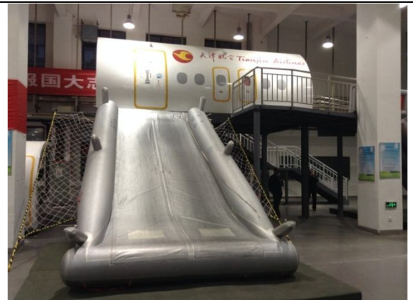
天津中德職業技術學院 實習座艙