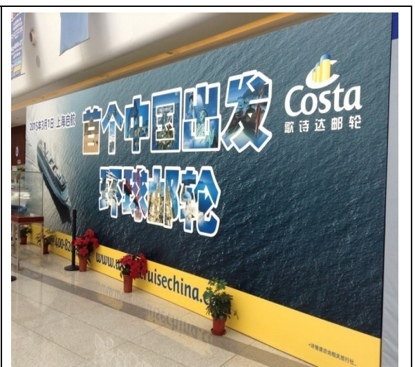
天津港郵輪登船處