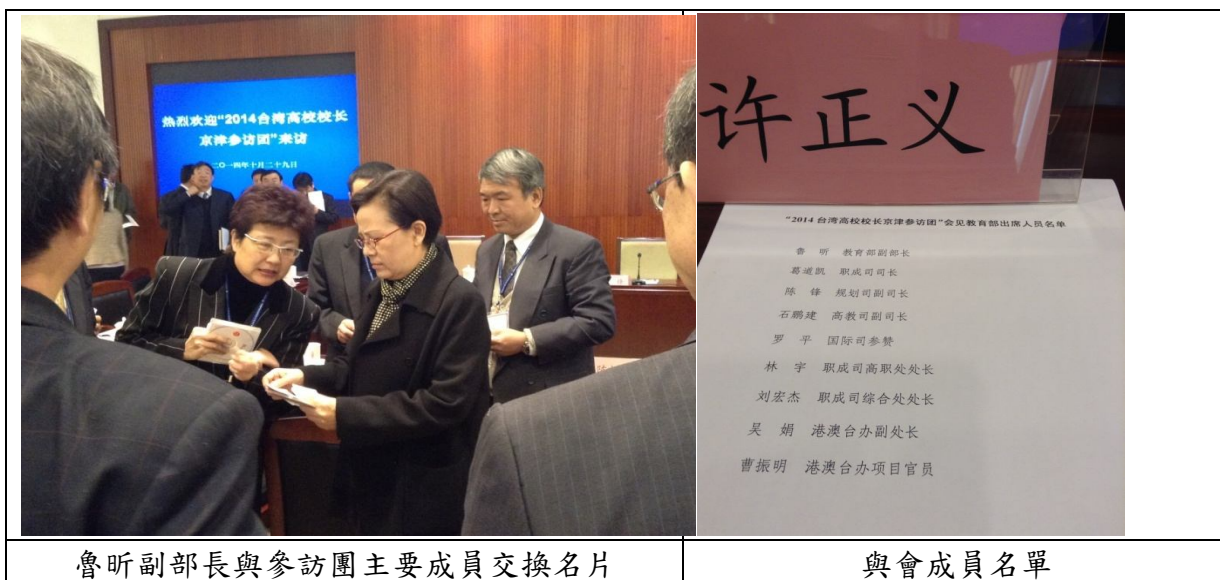
魯昕副部長與參訪團主要成員交換名片