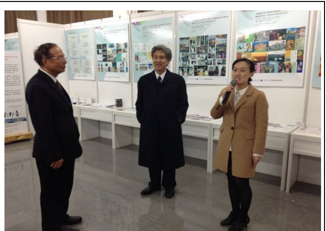
參訪團於天津中德職業技術學院