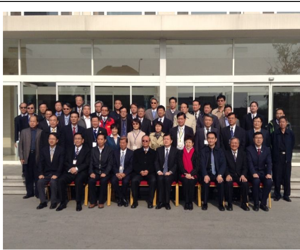
研討會主要成員合影

(4)未來可再推「雙聯學制」、「境外專班」、「校企合作-大陸出場地、台灣出師資」。