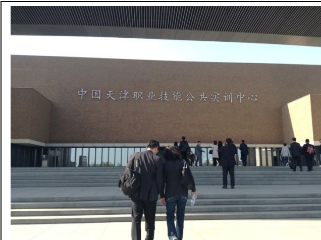
天津職業技能公共實訓中心