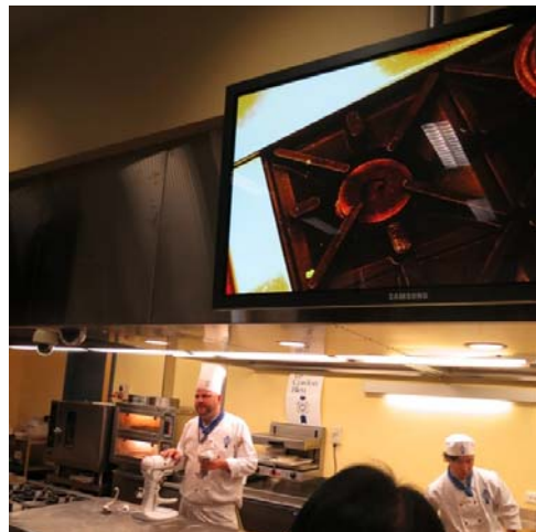
運用實物投影機教授廚藝課程