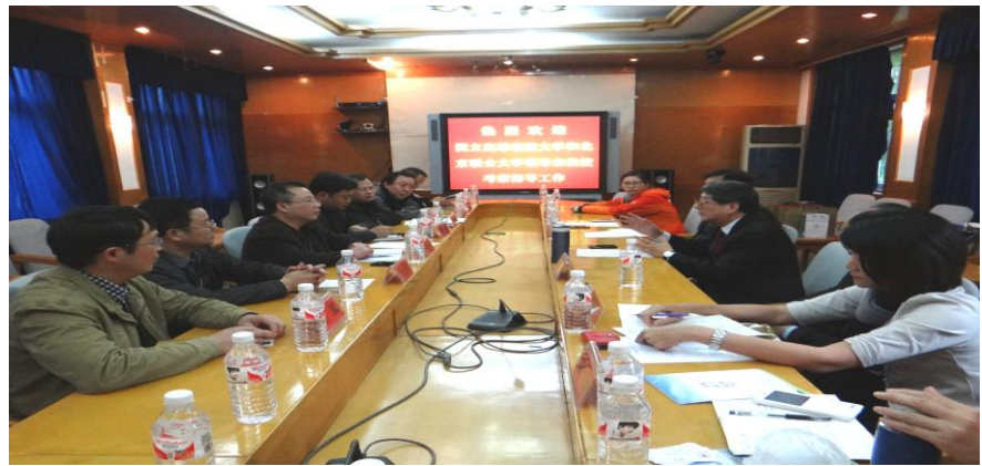
介紹本校及與會人員/雙方業務會談