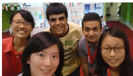
與約旦 Jubilee School 的學生合影

抵達會場後，報到領取參展手冊及相關資料後，代表團開始布置展覽攤位，學生們把作品海報及臺灣簡介海報貼上攤位牆面，並在桌上擺上宣傳單、臺灣明信片以及紀念手環等宣傳品，很快地布展完成，接著與約旦的學生及老師們一起享用午餐。享用完午餐後代表團在會場跟其它外國學生進行交流，並練習解說海報，完成後依大會排定行程回到飯店，於飯店餐廳享用晚餐。約旦的菜餚與臺灣的口味相較，比想像中的還要合胃口，很美味！