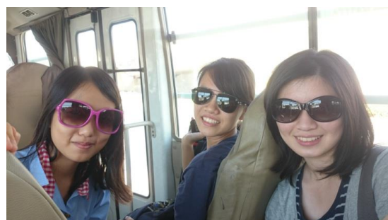
從機場到飯店搭乘大會接駁校車