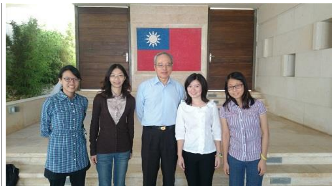
我國代表團與駐約旦代表處代表李大使世明合影

的政治經濟狀況，用餐氣氛相當愉快。代表團全體成員皆十分感謝他們的關懷及照顧，帶著滿滿的收穫，搭乘 12 日下午 5 時的班機，經由杜拜轉機，於 13 日返抵國門。