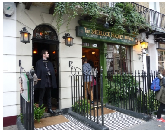
福爾摩斯紀念館吸引全世界偵探迷的到來。