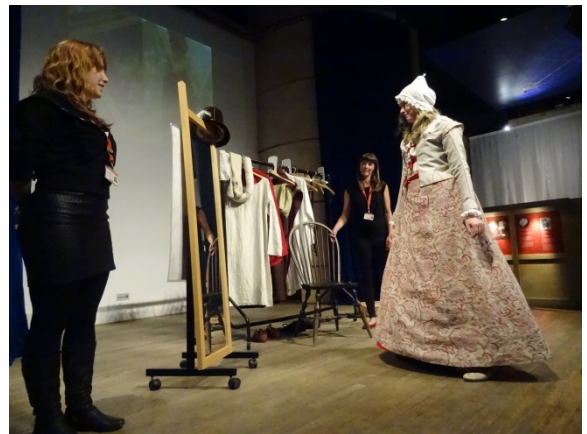
在環球劇場展館內，遊客可親身體驗 16 世紀舞台演員的穿著與裝扮。