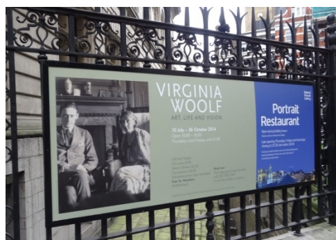
國家肖像館正展出英國作家維吉尼亞·吳爾芙人物攝影特展。