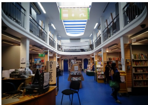
查寧閣圖書館是倫敦主要的中文圖書館。

此行雖以探訪莎士比亞和英國博物館為主要目標，但在駐倫敦代表處文化組的建議之下，我們也參觀了一處公共圖書館：查寧閣圖書館（Charing Cross Library）。這座圖書館隸屬於大倫敦西敏自治市政府，位於前述國家肖像館前對面，是一個對公眾開放的市立圖書館。但它同時也是倫敦市最大的非學術性中文圖書館，陳列眾多中文圖書、報紙、兒童繪本，及中文 CD、影片等影音資料。