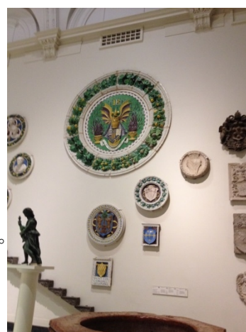
V&A 博物館內展出各樣精細的工藝美術品。