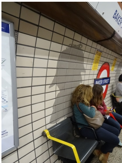
貝克街地鐵站內也可見福爾摩斯的身影。

由於此處是私人設立的紀念館，因此參觀門票要價 £10，並不便宜，但這個紀念館還是吸引全世界福爾摩斯偵探小說迷的到來，狹窄的舊式公寓內擠滿了慕名而來的遊客，其中不乏大量的亞洲讀者，而位於一樓的商品區也是始終大排長龍，各式以小說人物、場景為主題的紀念品銷售得非常好。同因這系列小說聞名的貝克街，在街上各處也都不約而同裝飾以福爾摩斯的肖像造型或字樣，就連倫敦地鐵「貝克街站」站內月台，也充滿著相關圖形，足見福爾摩斯的魅力，和英國人對他的喜愛程度。