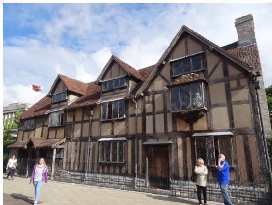
莎士比亞故居已有超過 450 年歷史，至今保存良好，吸引大批遊客前來。

安海瑟薇故居是史特拉福近郊一處美麗的農莊，房舍屋頂為當時甚為通行的茅草厚氈形式，保存得非常完整。而廣大的農場與花園據信是莎士比亞追求妻子時散步和互訴衷情的場所，在 SBT 的細心照料下，花朵盛開，草木茂密，令人流連忘返。在這花園裡所種植