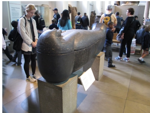
大英博物館著名的玻璃天頂，和絡繹不絕的參觀遊客。