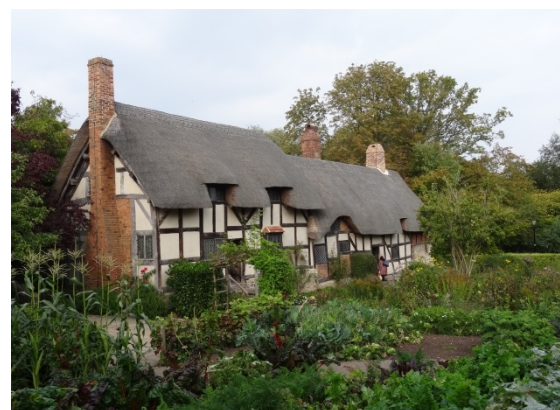
安海瑟薇故居保留中世紀農舍樣貌，並有著美麗的花園圍繞。