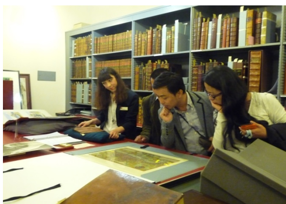
一行人在 SBT 館員陪同下，於文物庫房內仔細檢閱莎士比亞珍貴文物。

方式進行莎士比亞文化資產的管理，其好處是不受政府財政預算與法律的囿限，能較為彈性地處理相關事務，也能更為有效地廣納學術等各界的資源、力量與監督。其主要財源是每年來自世界各地的廣大遊客門票與紀念品收益，也包括部分商業收入、授權費與公開募捐等，但並無政府機構的直接補助或預算資助。而 SBT 也是英國第一個以信託方式進行文化遺產的成功案例。