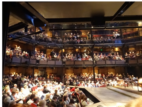
皇家莎士比亞劇團演出莎翁的劇作，口碑與票房都非常好，現場座無虛席。