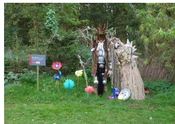
孩童們利用樹枝、零件等小物品製作莎翁劇作《仲夏夜之夢》人物造型。