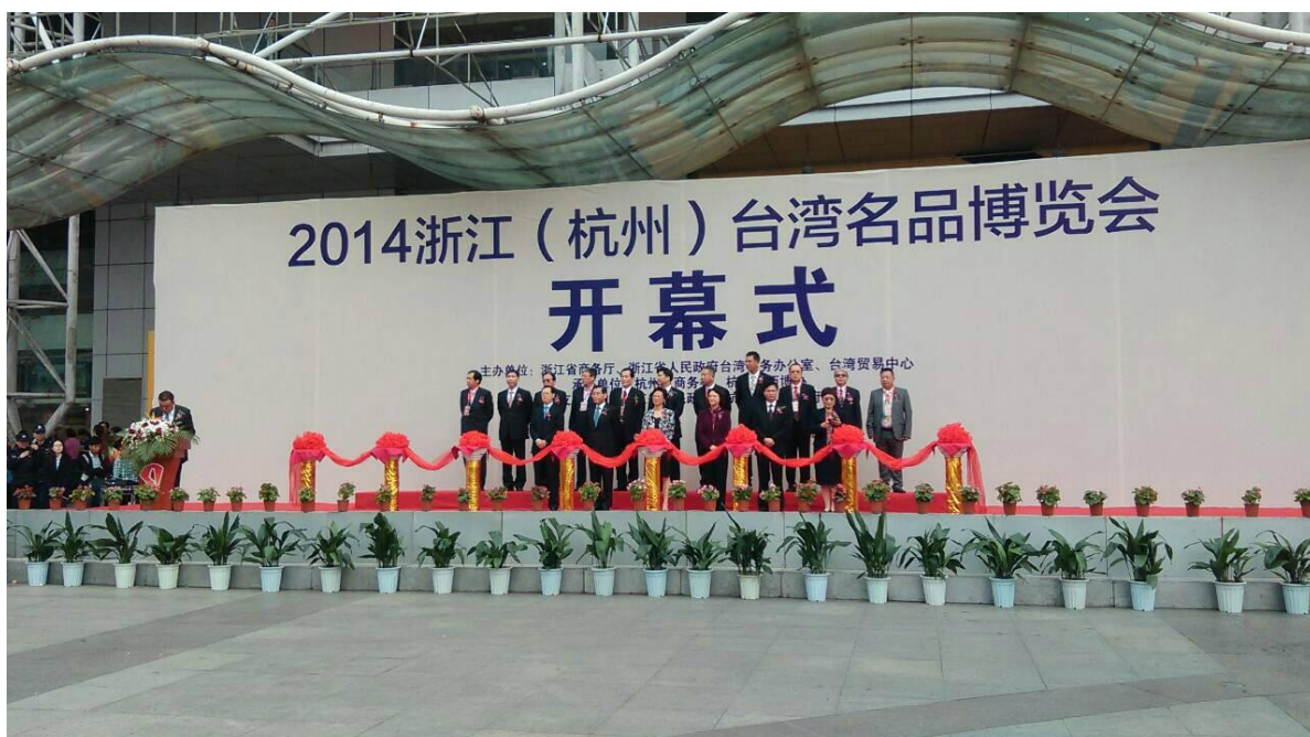
參加「2014 浙江(杭州)台灣名品博覽會」開幕式