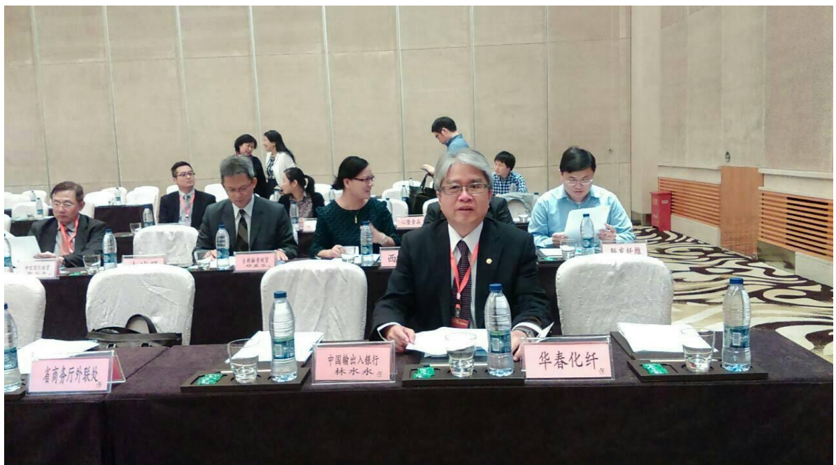
參加「2014 浙台經貿(杭州)交流會」