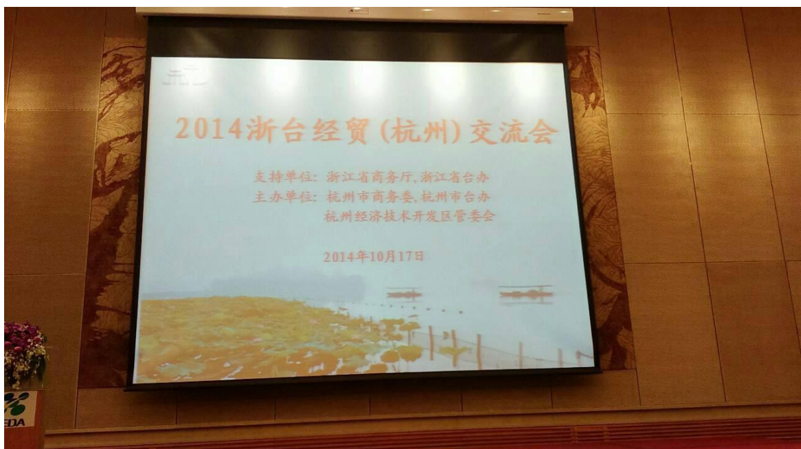
參加「2014 浙台經貿(杭州)交流會」