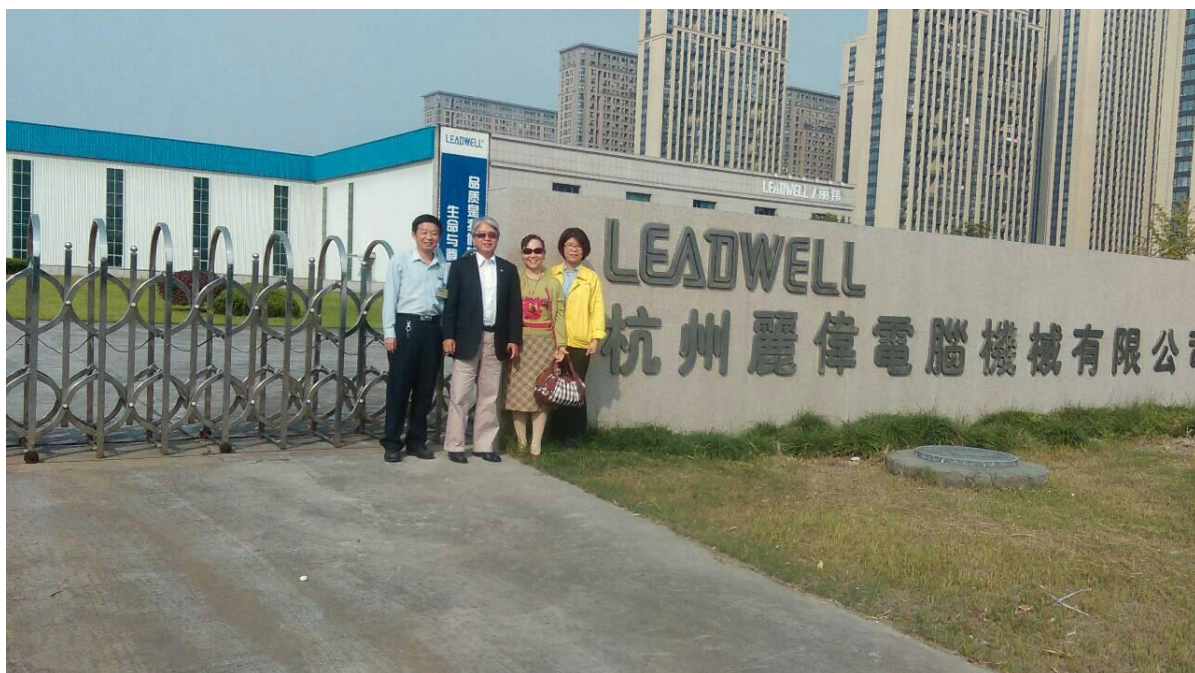
拜訪本行客戶大陸子公司杭州麗偉機械有限公司