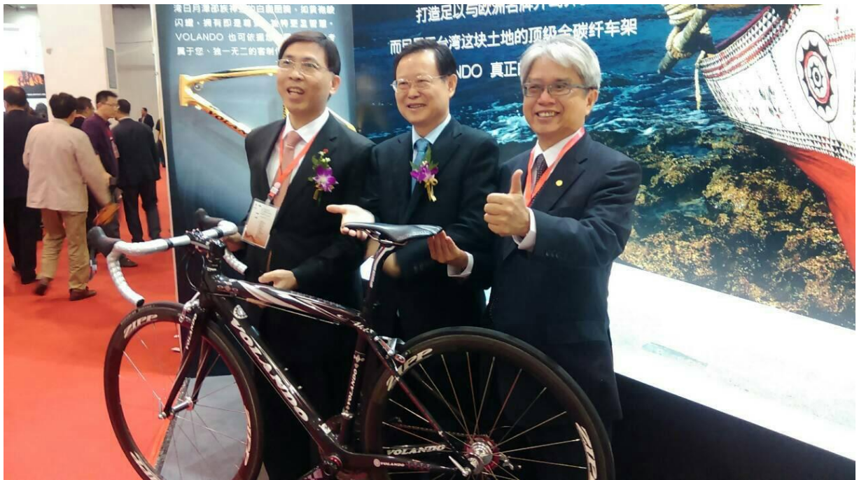
「2014 浙江(杭州)台灣名品博覽會」展覽館巡場