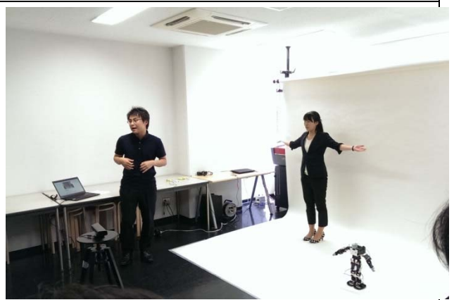
9/6(六)參訪神戶藝術工科大学(Kobe Design University)觀賞人工智慧機器人簡介