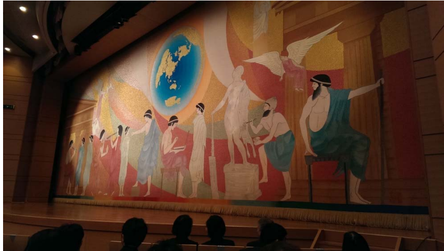
(圖G)以希臘羅馬神話故事為背景的舞台設計

今年國際秘書處重點工作將致力於 2015 年於臺灣所舉辦的國際性研討會以及協助新任主席國馬來西亞維持 UMAP 正常運作等兩項重點工作。明年為臺灣接掌 UMAP 國際秘書處最後一年任期，適逢 2014 年新任主席國馬來西亞產生，臺灣國際秘書處將協助原主席國日本及新主席國進行交接事宜，並參考日本此次辦理國際研討會之形式，在臺灣或馬來西亞國內舉辦具國際影響力的大型研討會；落實 UMAP 憲章宗旨：提升學生流動及學分認證兩項重大使命。目前本部已與 UMAP 國家秘書處積極討論未來辦理 UCTS (UMAP Credit Transfer Scheme)及歐盟 ECTS (European Credit Transfer and Accumulation System)學分承認之比較的國際研討會規模，盼藉由舉辦此一國際研討會，促進亞太地區學生之國際流動，並強化臺灣高等教育與國際行銷，讓更多臺灣學生把握到異國學習的機會，打破國界藩籬，招募到更多亞洲國家加入 UMAP，使更多亞洲學生透過 UMAP 得以自由選修學分或學位，提升國際間交流的廣度與深度，替臺灣接掌國際秘書處 5 年任期劃下最完美之句點。