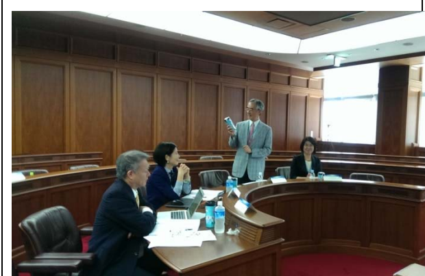
9/5(五) 日本主席谷岡一郎校長於 UMAP 第二次理事會中公開稱讚臺灣設計禮品