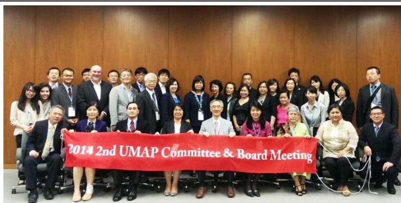
圖 1 2014 UMAP 第二次理事會暨國際研討會會後合影

此行由楊司長率領 UMAP 國際秘書處出席的「2014 年亞太大學交流會日本大阪國際研討會暨第二次理事會」成果豐碩，除了成功地選出新任主席國馬來西亞，持續擴展未來 UMAP 事務，更拓展了臺灣與日本及亞太地區國家學術交流合作的網絡，促使我國高等教育國際化的影響力延伸至亞太地區。