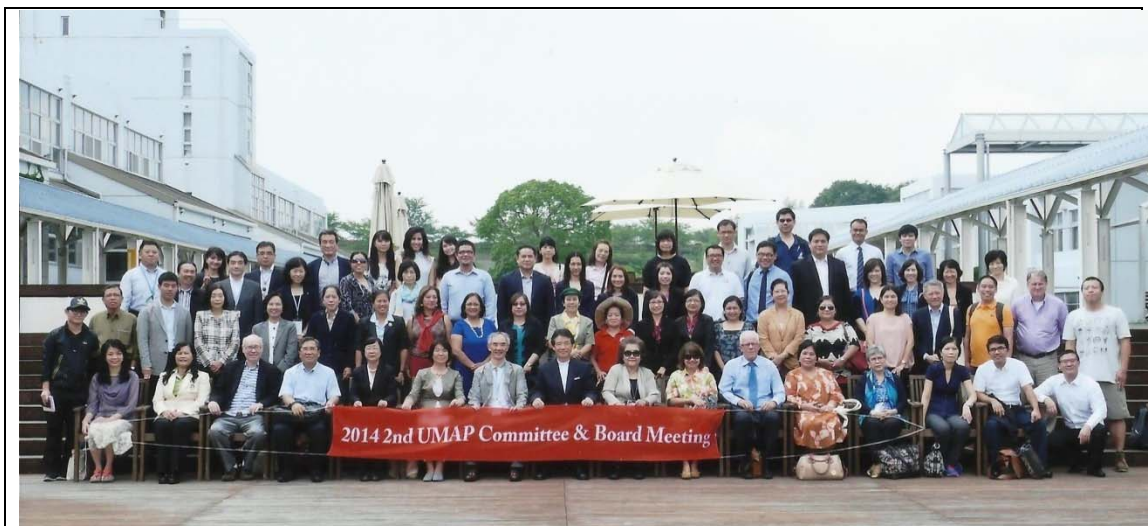
Group picture for the second UMAP committee & Board meeting and international conference.

Regarding the achievement of the Taiwan team's participation in the 2014 UMAP International Conference and 2nd Committee Meeting in Osaka, the team not only gave its vote during the new chair election, but has also successfully expanded the academic cooperation and exchange network with Asia-Pacific countries that would help extend Taiwan's influence in the development of higher education internationalization over the region.