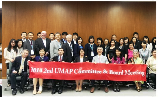
9/5(五) UMAP 第二次理事會圓滿落幕與所有理事們合影留念