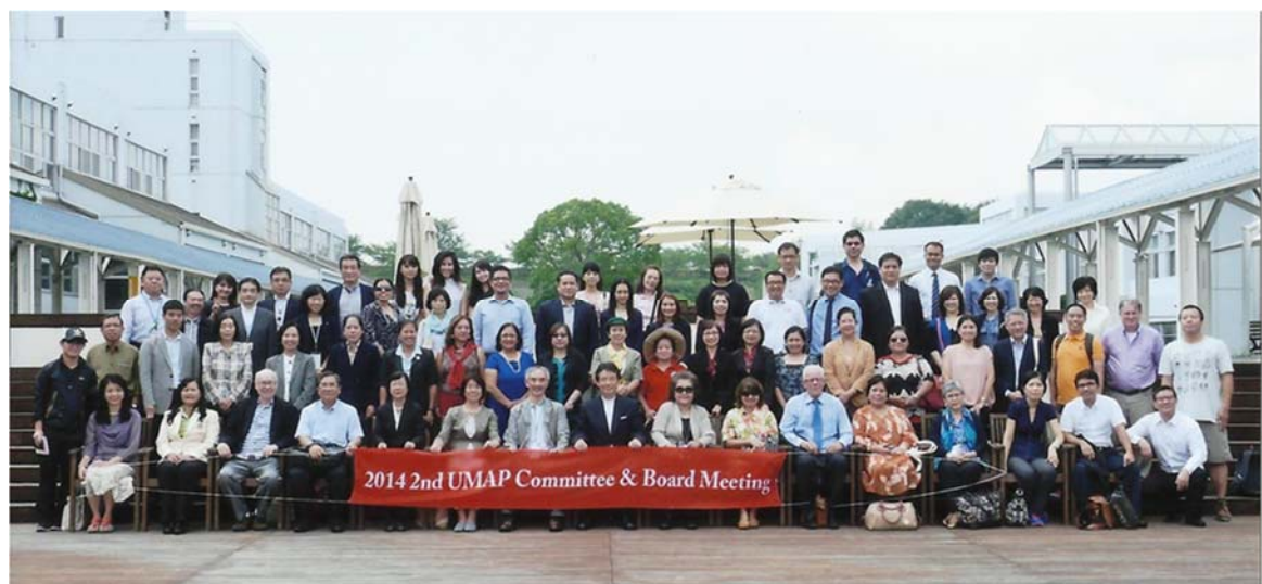
9/6(六) UMAP 理事們於神戶藝術工科大学(Kobe Design University)參訪合影留念