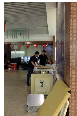
展品卸下後以無酸紙和紙箱包裝