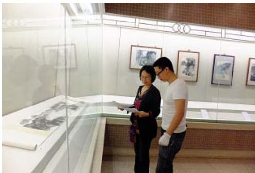
吉林省博物院與本館卸展人員點交順利