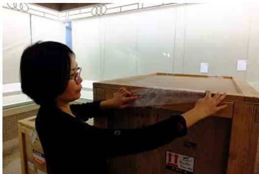
運輸木櫃上封條，以確保安全