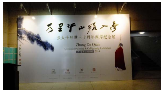
吉林博物院大門與「萬里江山頻入夢」展示牌