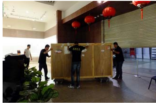
運輸木櫃送出吉林省博物院