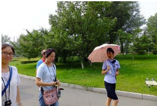
偽滿皇宮博物院導覽員為我們解說