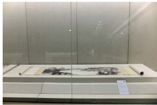
張大千晚期創作－國立歷史博物館典藏