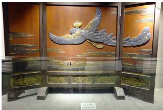
日本皇室贈送溥儀的神鳥屏風