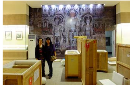
展品全數圓滿放置於運輸用的木櫃中