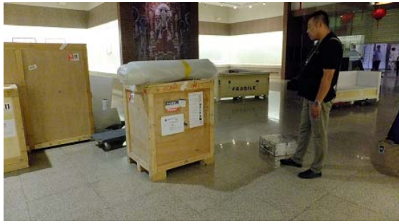
包裝展品的木櫃，送至展場