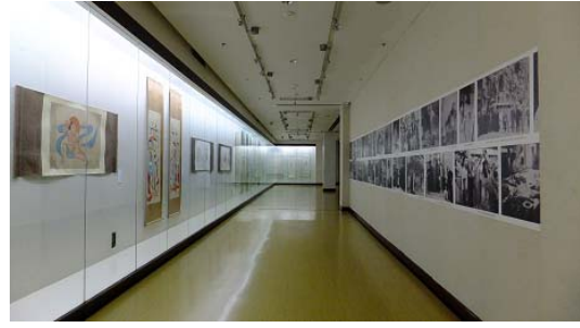
張大千中期創作－四川博物院典藏