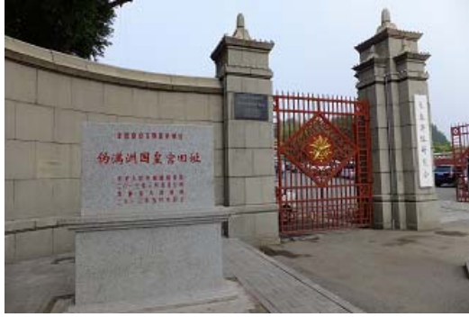
偽滿皇宮博物院大門口