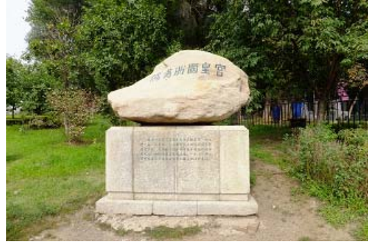
偽滿皇宮庭院紀念碑