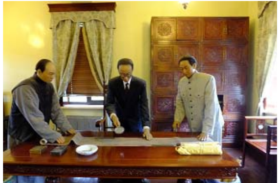
偽滿皇宮室內陳列一隅