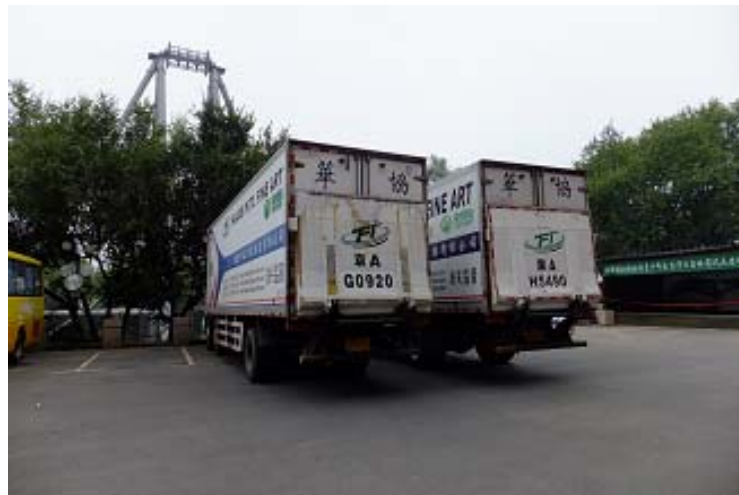
完成本展 105 件展品進運輸車，並載至機場後運至臺灣