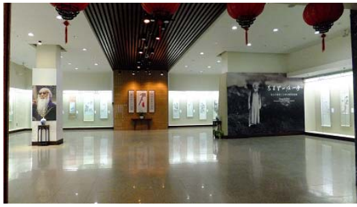
張大千早期創作－吉林省博物院典藏