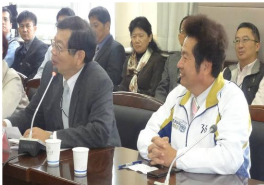
參訪人員與長安大學座談