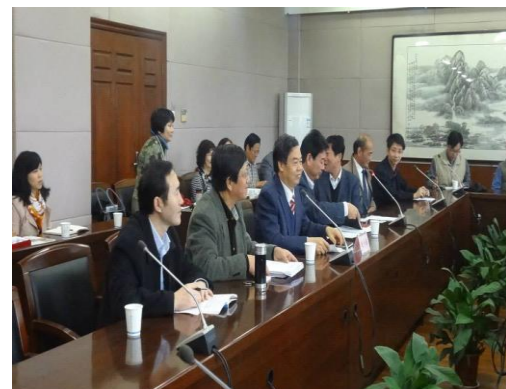
參訪人員與長安大學經驗交流