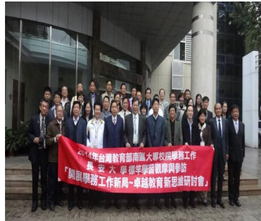
參訪人員與長安大學同仁合影