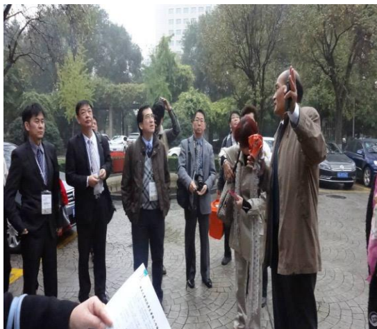
實地參觀長安大學校園設施