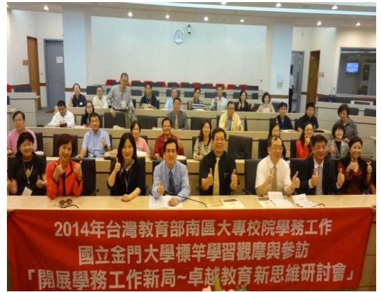
參訪人員與金門大學同仁合影