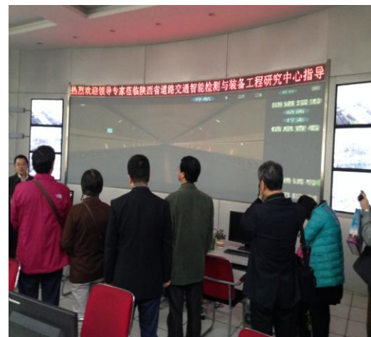
實地參觀長安大學教學設施