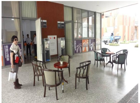
實地參觀金門大學學務處