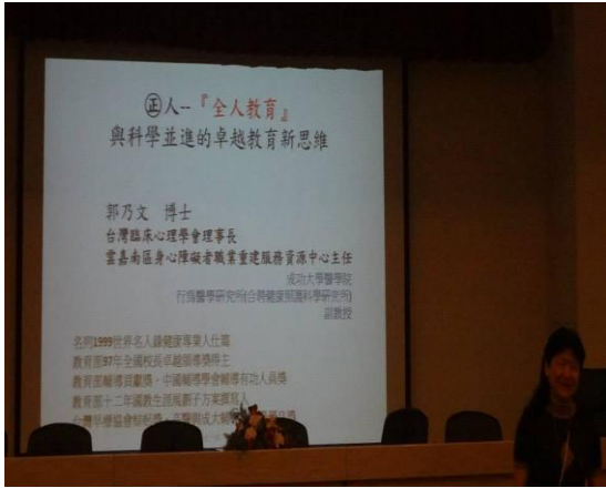
成功大學郭乃文教授-與科學並進的卓越教育新思維