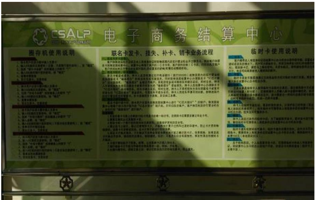
圖 11：壽光農產品物流園之「電子商務結算中心」說明看板。