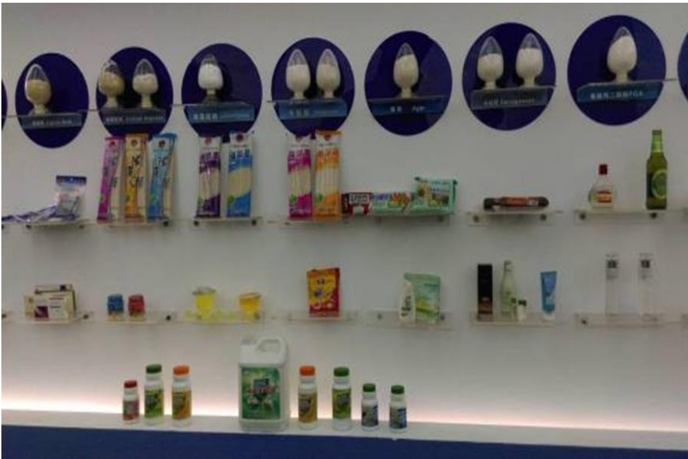
圖 5：聚大洋應用海藻膠之各式商品。