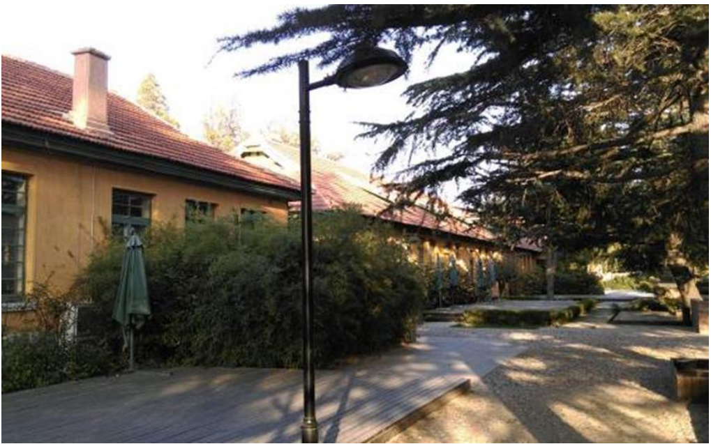
圖 22：坊茨小鎮導覽館外觀。