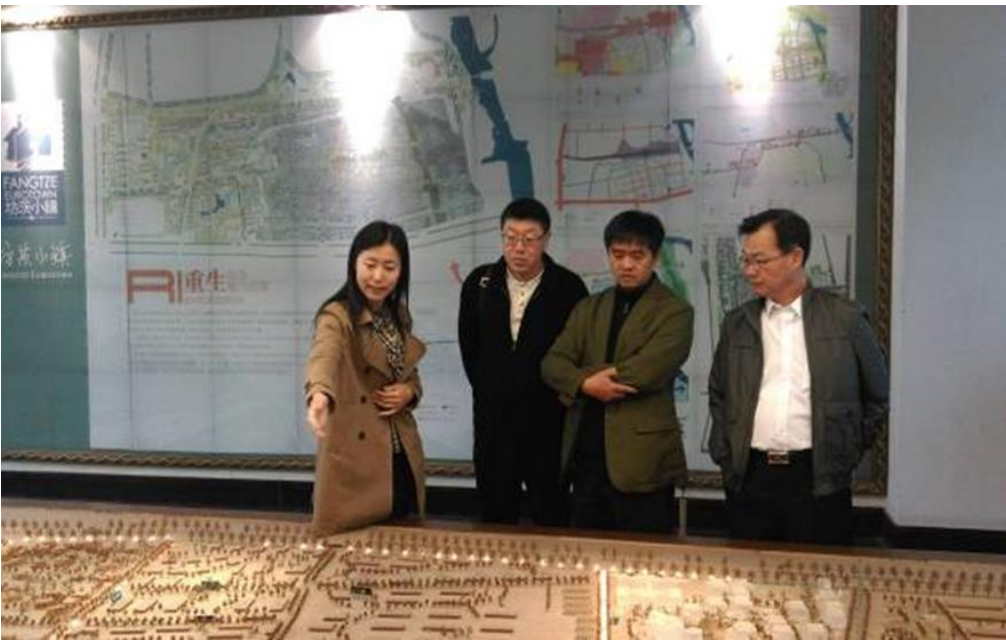
圖 18：坊茨小鎮管理人員於立體展示模型前為參訪團代表進行解說。