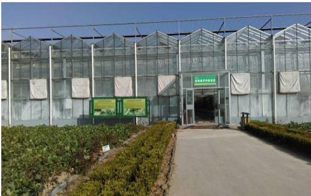
圖 12：壽光蔬菜產業集團之高端蔬菜種植溫室。