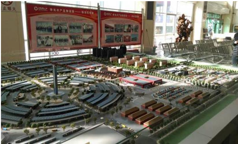
圖 10：壽光農產品物流園之立體展示模型。