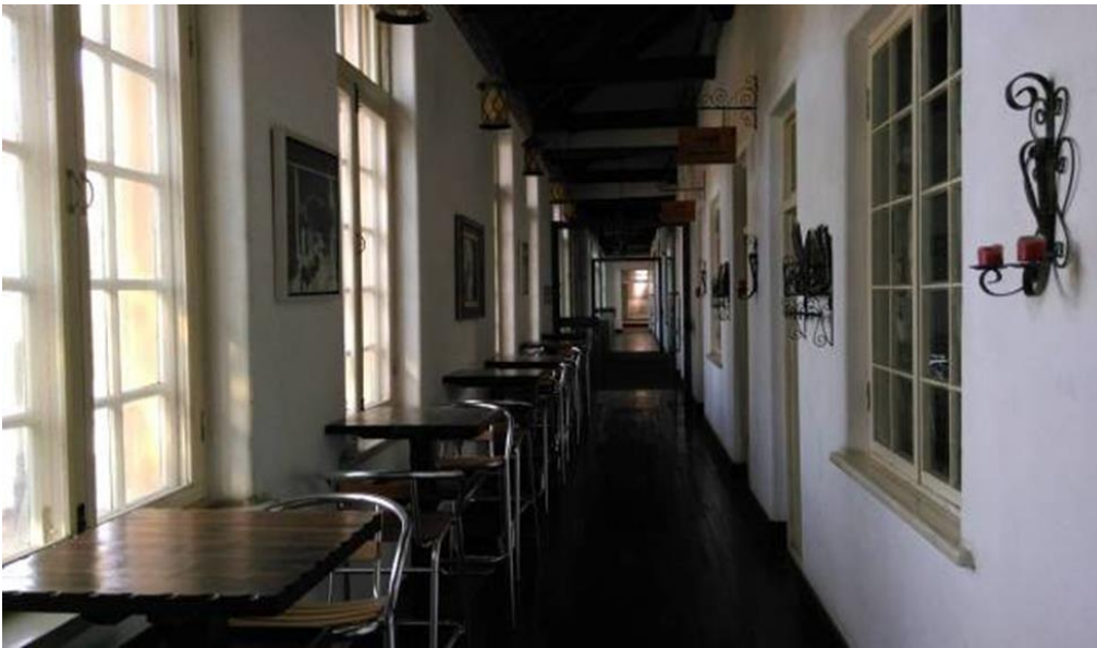
圖 20：坊茨小鎮以原學校改建之導覽館穿堂仍保留原有建築之木質結構。