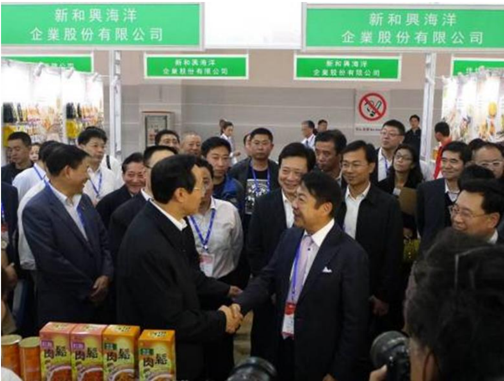
圖 1：臺灣優良農產品發展協會楊世沛董事長接待大陸農業部韓長賦部長。