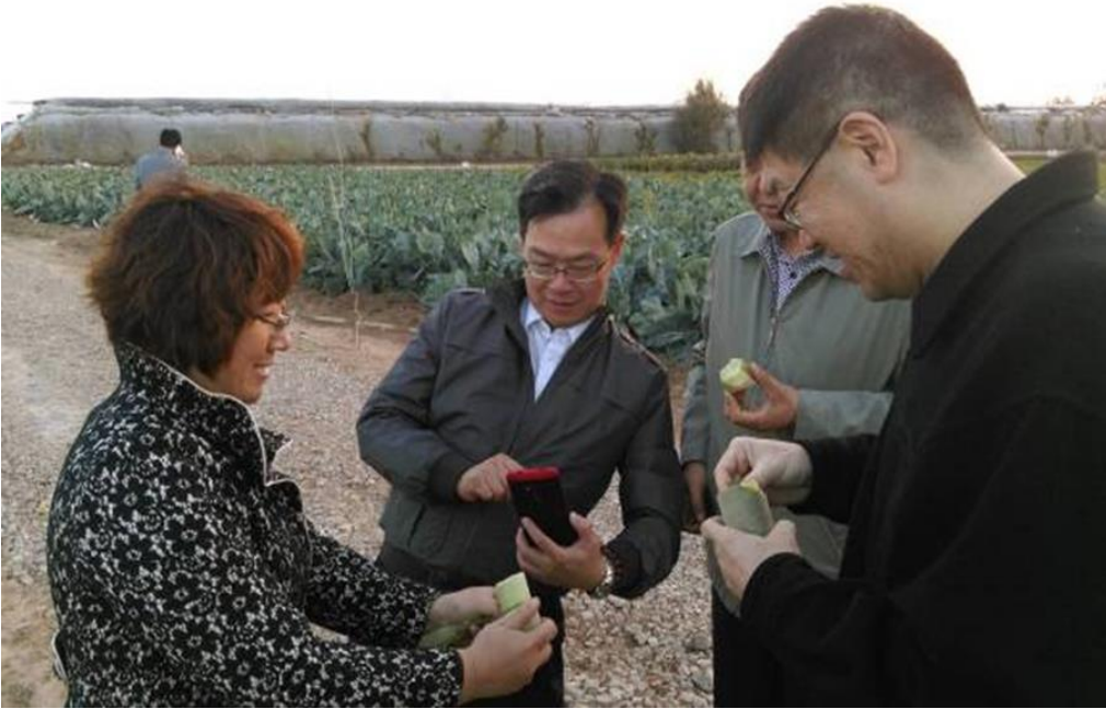
圖 25：玉泉洼生態觀光園園主向參訪團代表介紹可生食青蘿蔔情形。