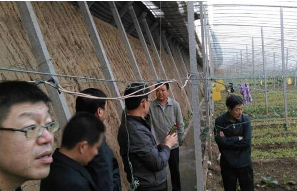
圖 26：參訪團代表參訪大棚栽種情形。