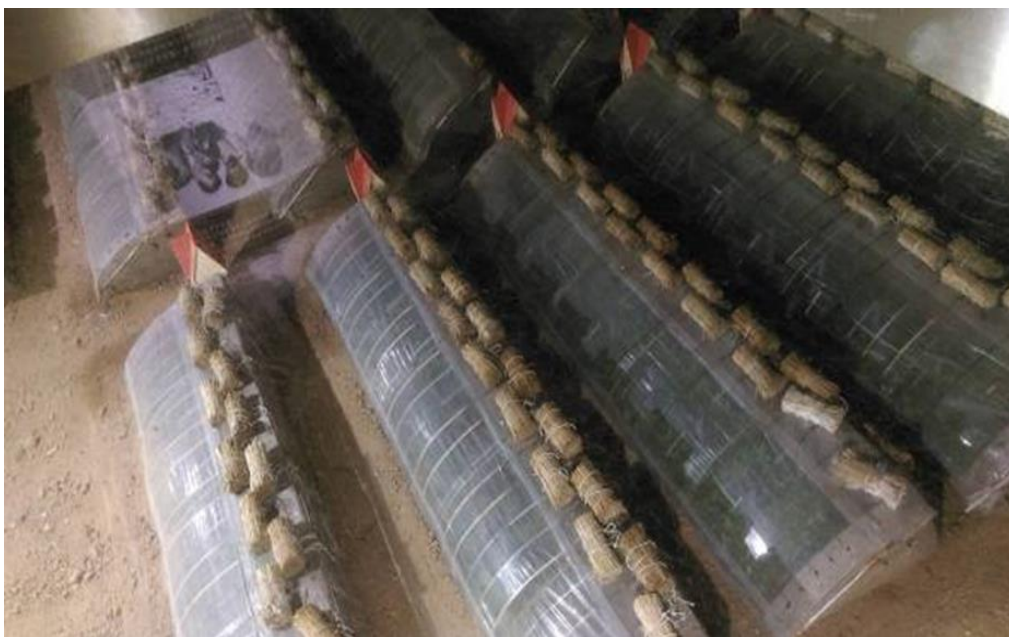
圖 16：壽光蔬菜博物館展示的大棚模型。