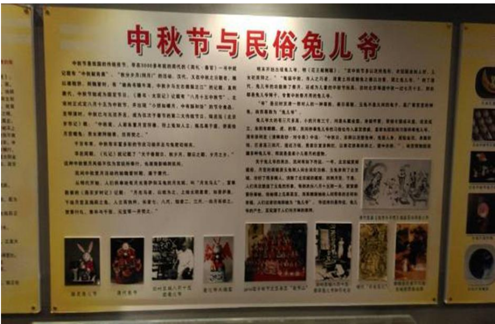
圖 8：康大公司兔子博物館中之「中秋節與民俗兔」說明板。