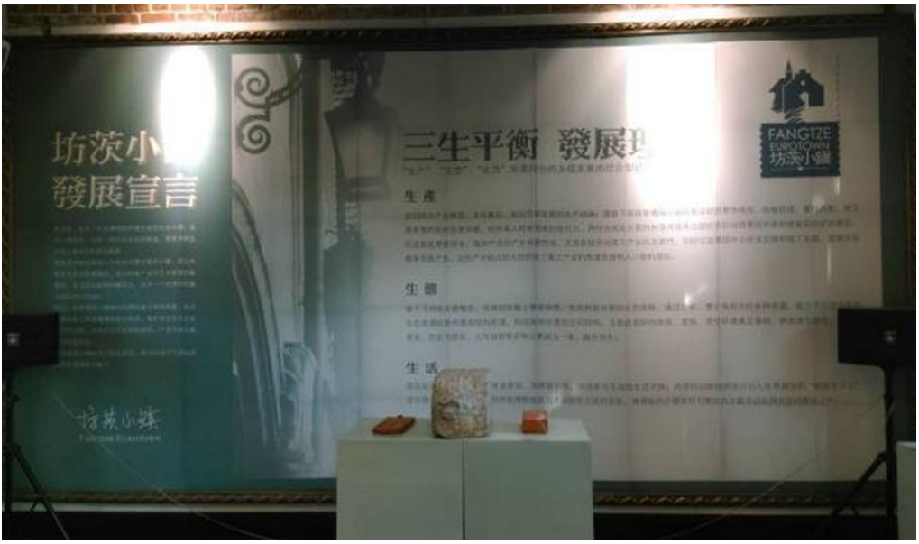
圖 21：坊茨小鎮的發展宣言說明。