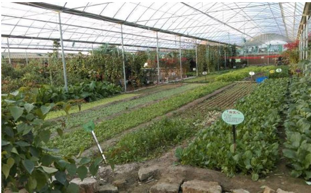
圖 24：玉泉洼生態觀光園中的農耕文化園。