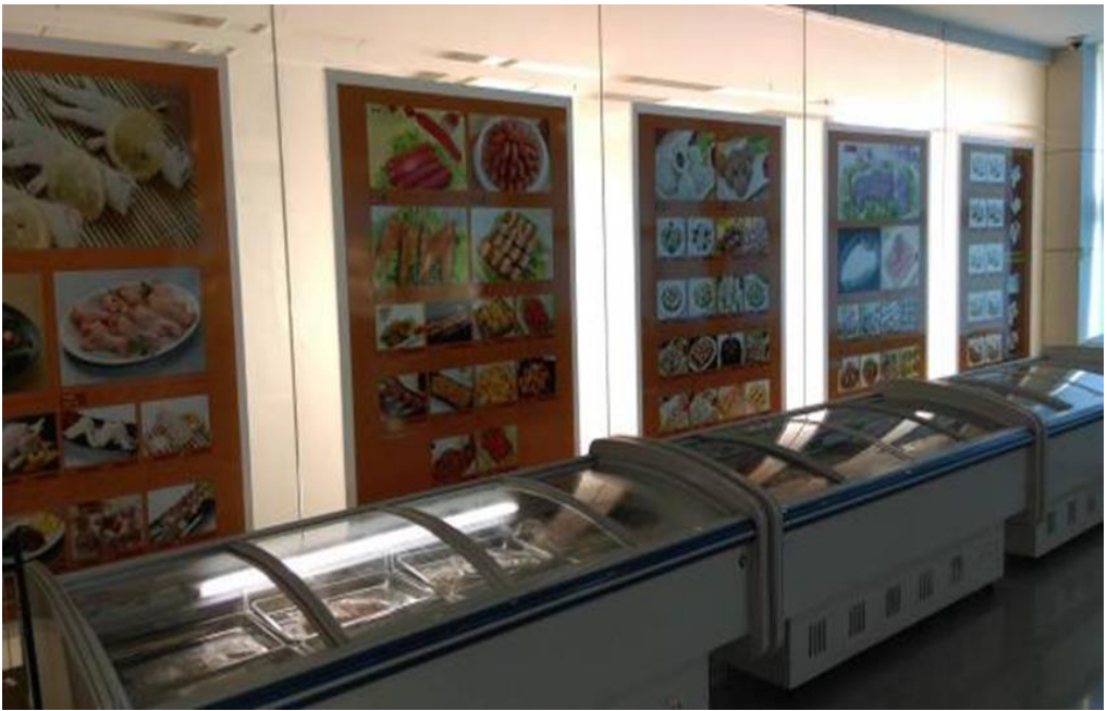
圖 7：康大公司展示廳之產品陳列一隅。