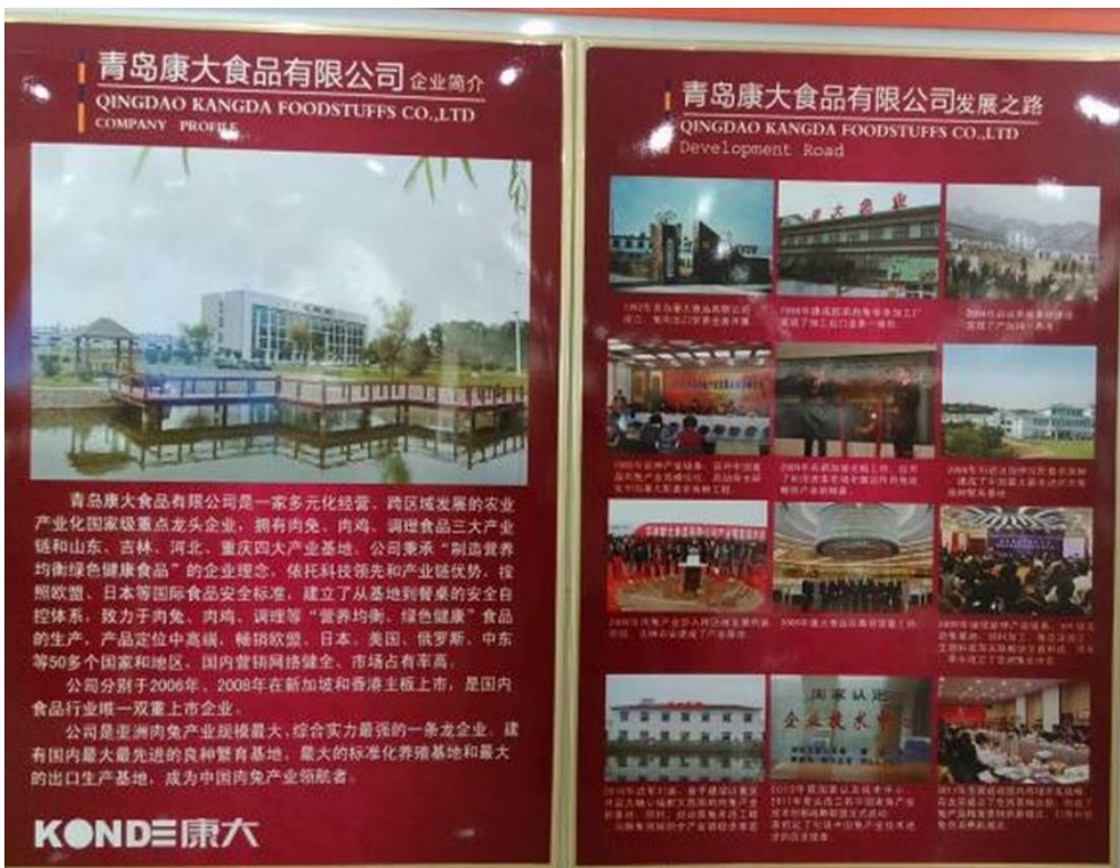
圖 6：康大公司展示廳之簡介。