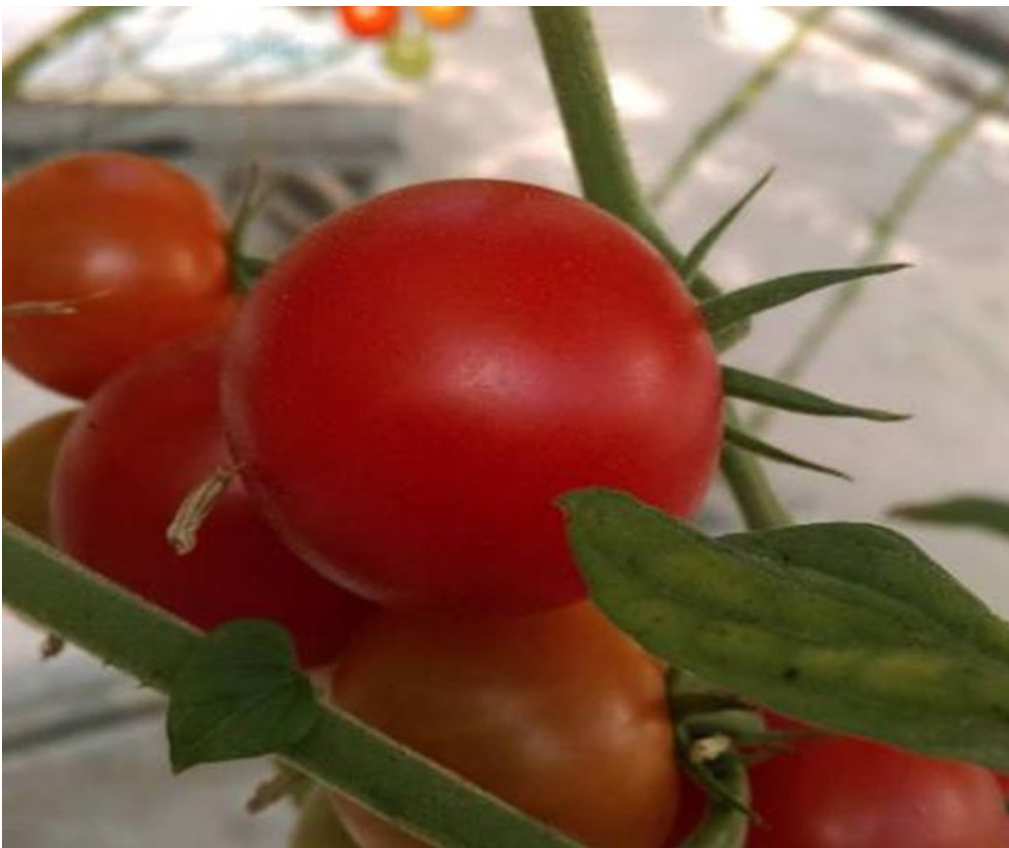
圖 14：高端蔬菜種植溫室所栽種之蕃茄。