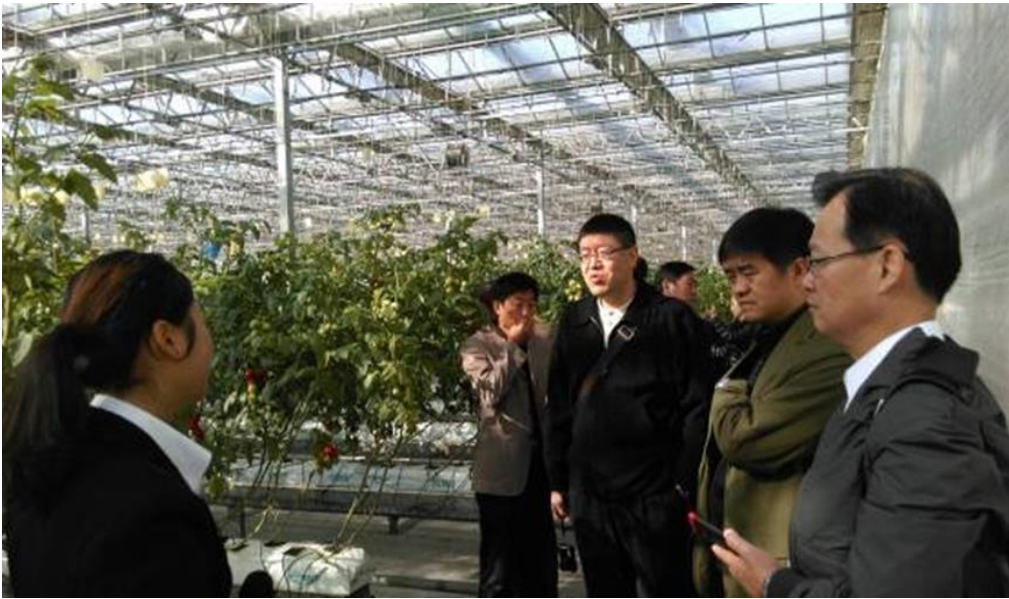
圖 13：壽光蔬菜產業集團解說員為參訪團代表說明栽培現況。