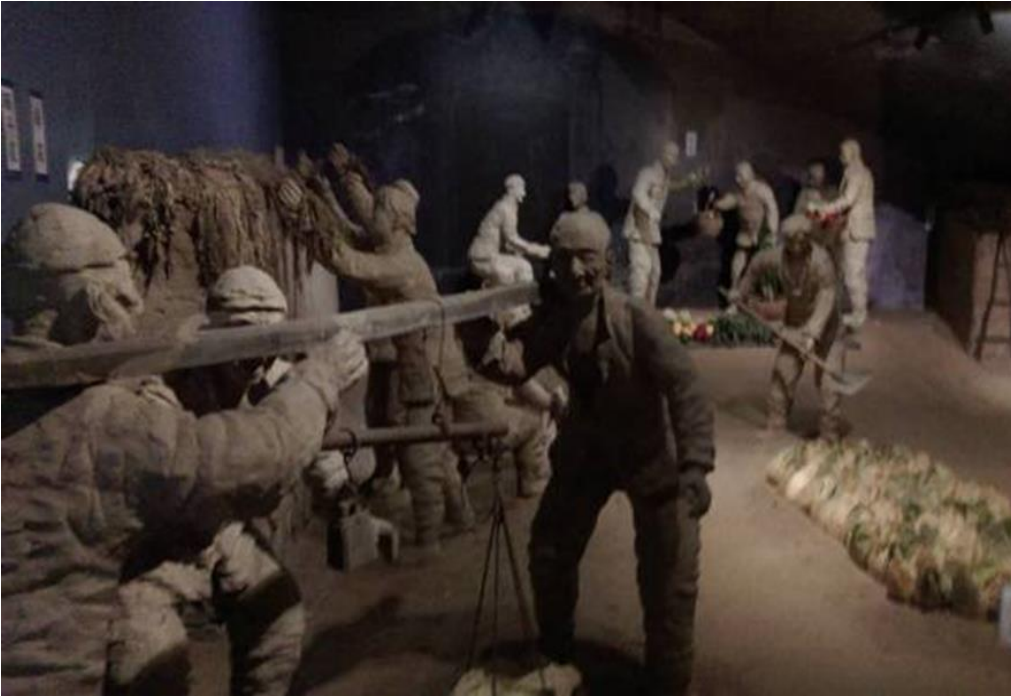
圖 17：壽光蔬菜博物館展示的過去農村冬季採收蔬菜醃漬模型。