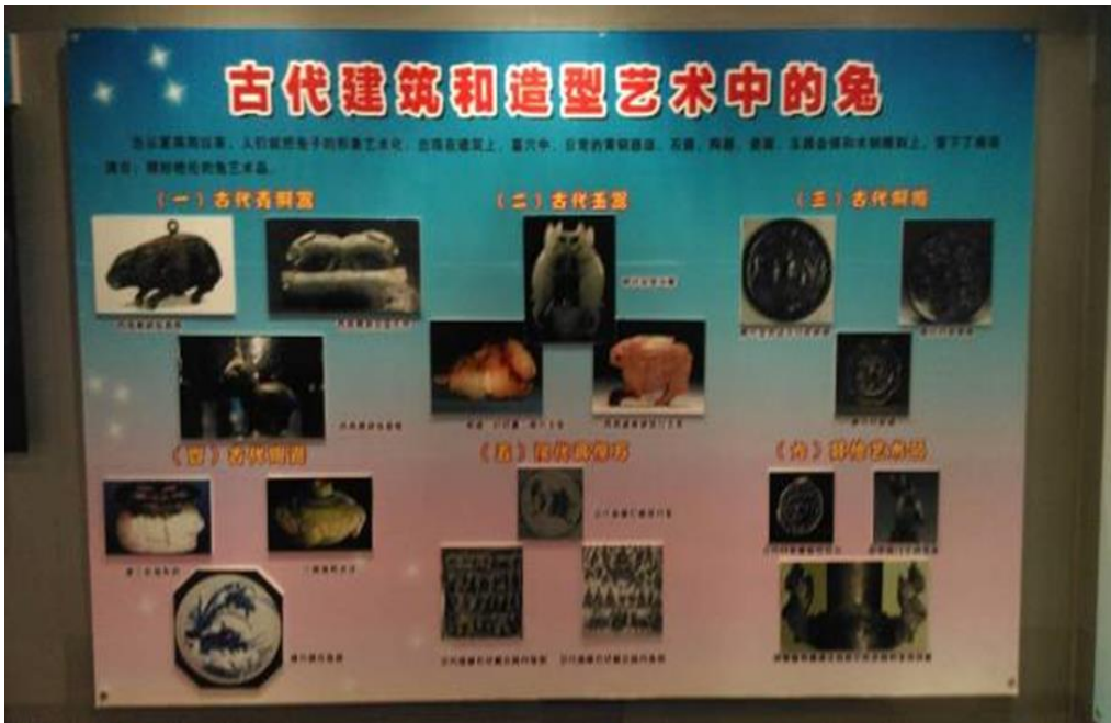
圖 9：康大公司兔子博物館中之「古代建築和造型藝術中的兔」說明板。