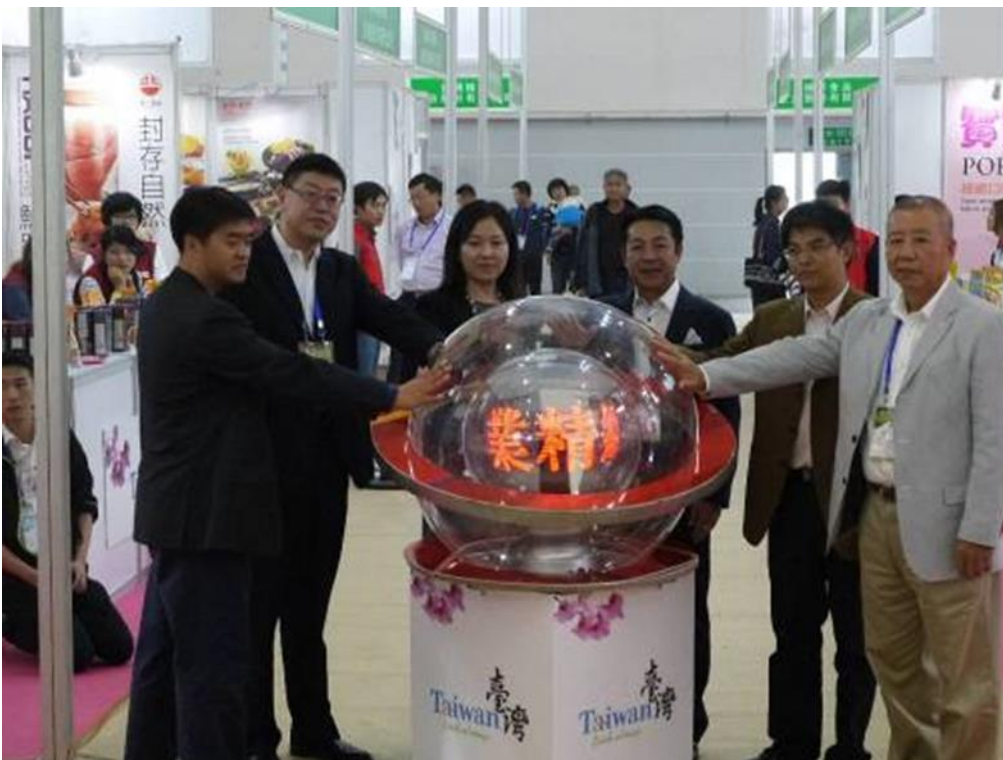
圖 2：臺灣優良農產品發展協會董事長、執行長暨本會參團代表、大陸農業部官員等共同為臺灣館主持開幕儀式。