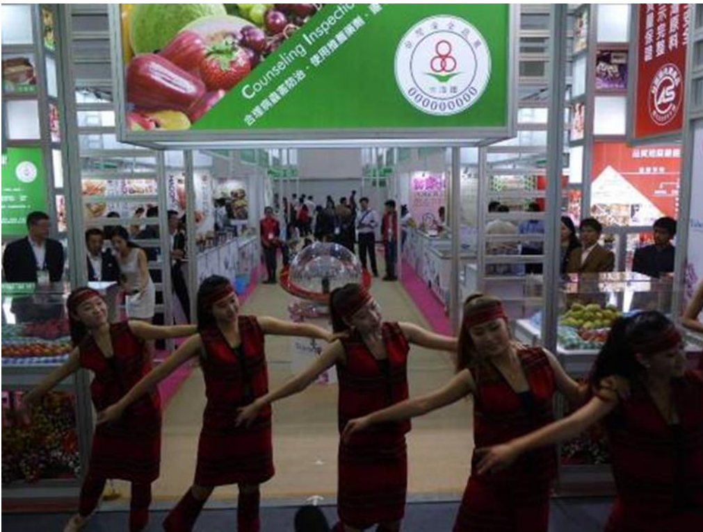
圖 3：臺灣館開幕迎賓舞蹈表演。