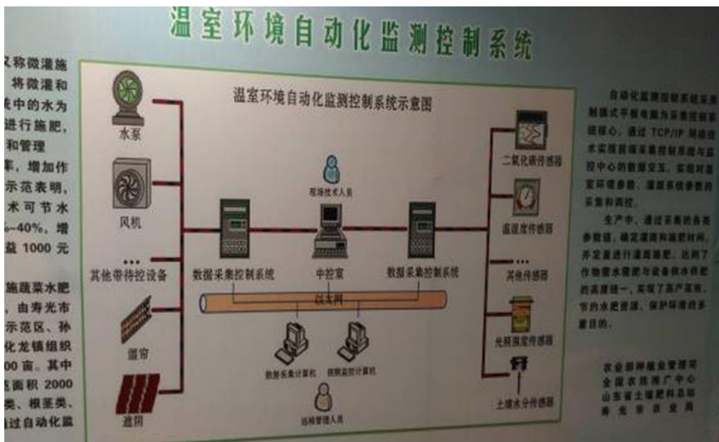
圖 15：壽光蔬菜產業集團溫室環境自動化監測控制系統。