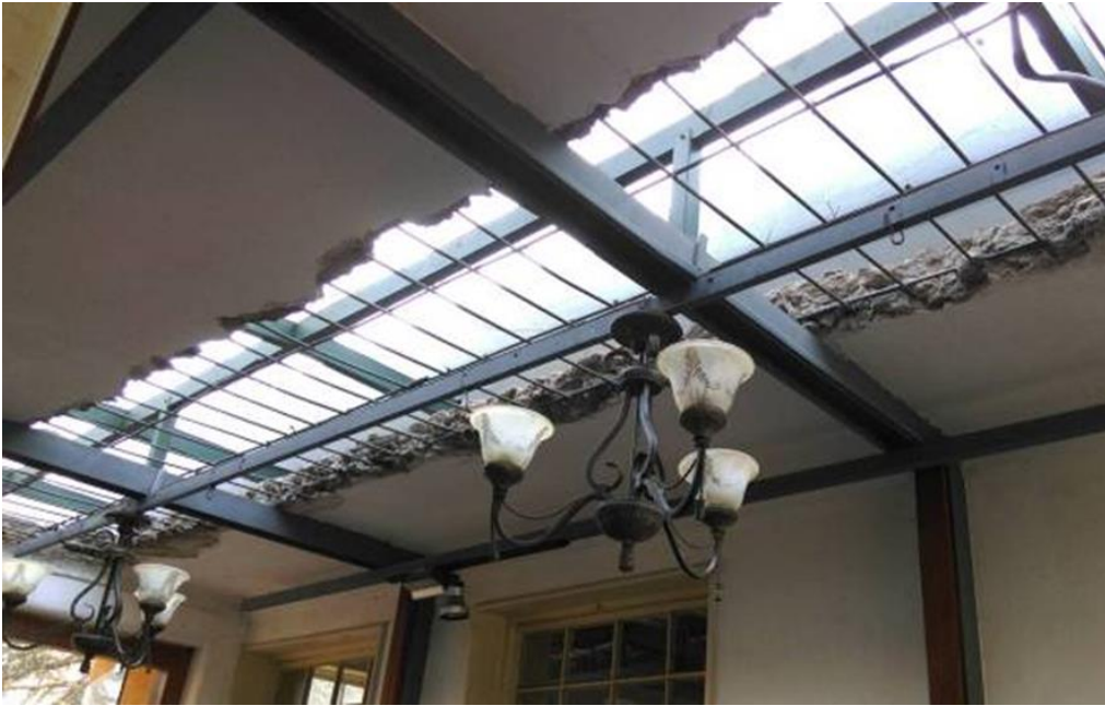
圖 19：坊茨小鎮以原學校改建之導覽館入口展示原有建築之鋼筋。