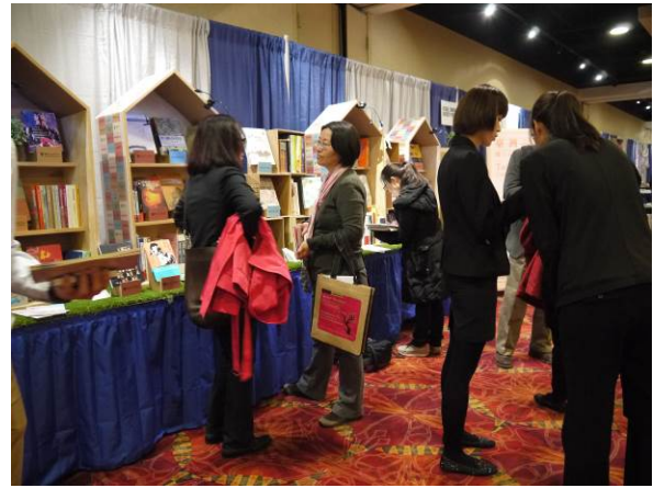
聯展工作人員為讀者尋書