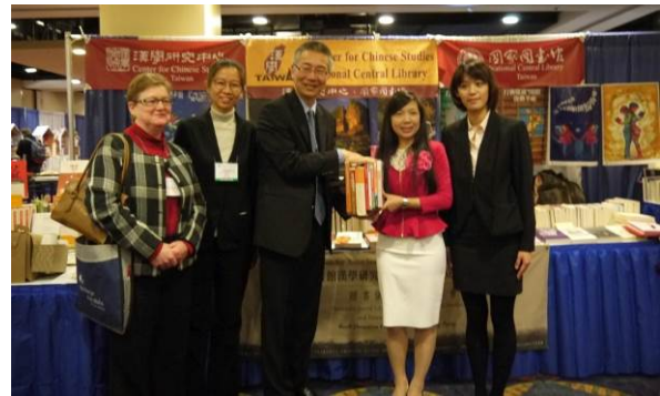
本校與臺大出版中心代表大學聯展贈書