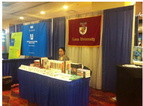
韓國大學出版品展位