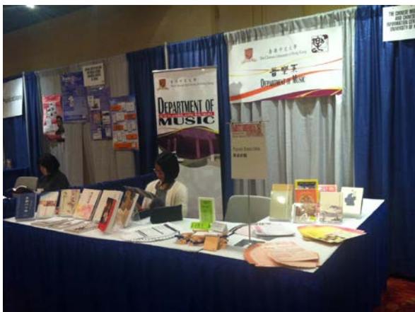
香港中文大學音樂系出版品展位