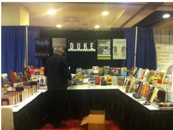
杜克大學出版社展位