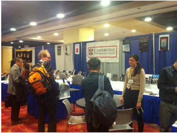
劍橋大學出版社展位