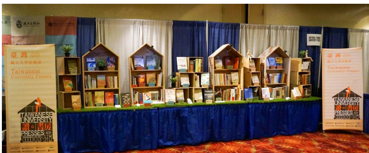
大學聯展展位全貌