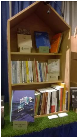
本校出版品陳列櫃