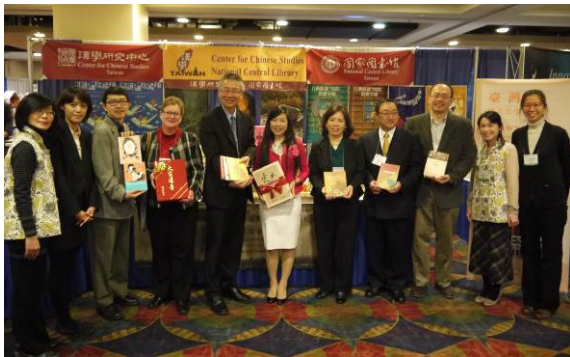
大學聯展與國家圖書館聯合贈書儀式： 受贈對象為哥倫比亞大學東亞圖書館