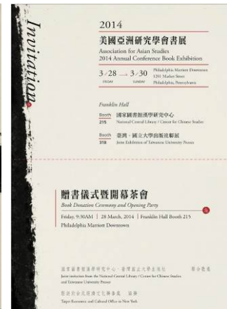
贈書儀式及開幕茶會邀請卡