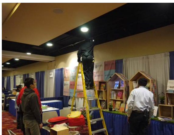
現場工作人員臨時調整燈光