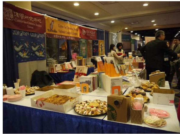
大學出版社聯合目錄