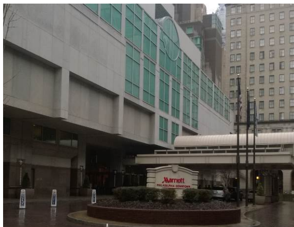
2014 AAS 年會及年會書展舉辦場所： 美國費城 Marriott 飯店