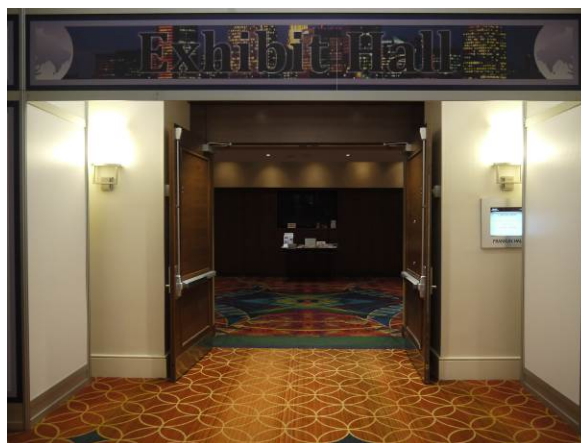
2014 AAS 年會書展入口處