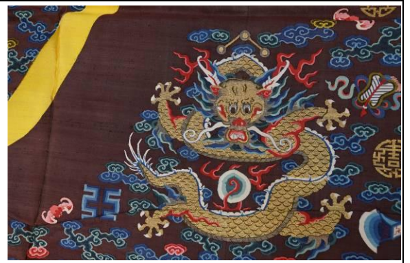
6. 清絳色緞絲五彩雲幅壽金龍袍料 細部