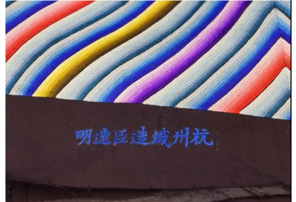
8. 清石青紗彩繡團雲幅八寶金龍褂料