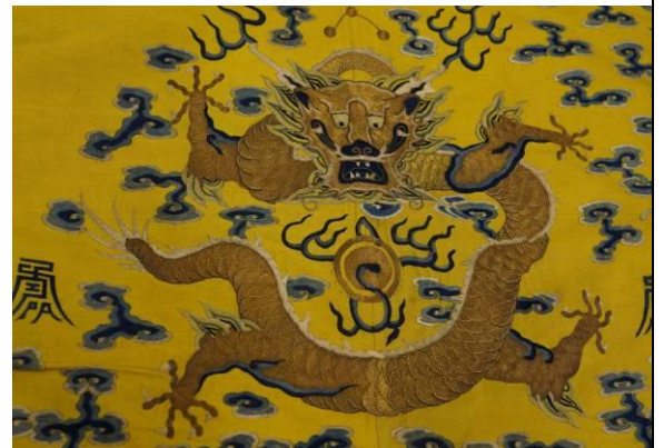
5.清 黃綢繡三蘭雲幅金龍袍料 細部