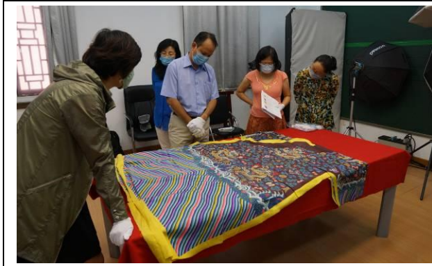
6. 清絳色緞絲五彩雲幅壽金龍袍料 全長 298 公分，寬 130 公分