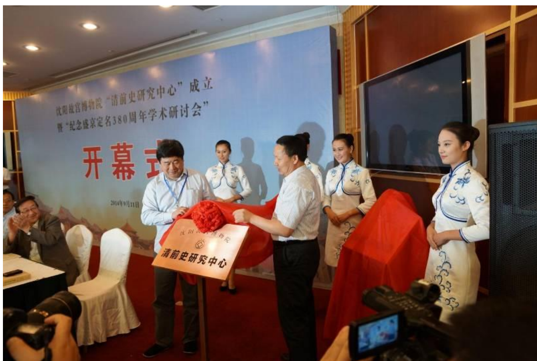
單院長為清前史研究中心揭牌