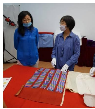
4.清紅色納紗彩雲幅金龍袍料 附件