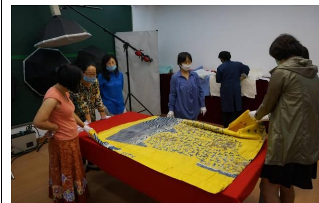
5. 清黃綢繡三蘭雲幅金龍袍料 全長 308 公分，寬 160 公分