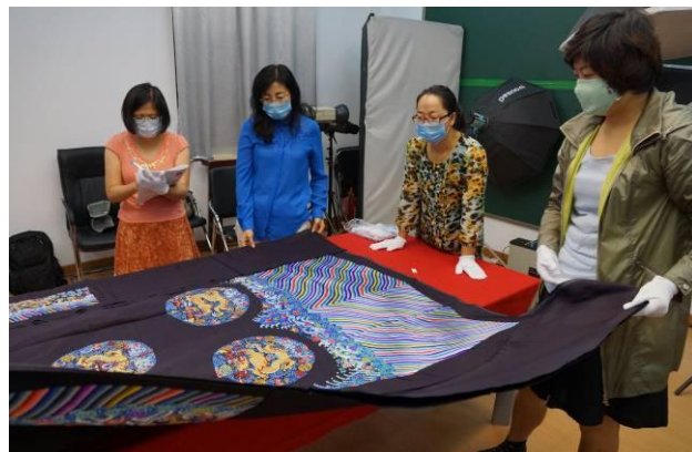
8. 清石青紗彩繡團雲幅八寶金龍褂料 全長 304 公分，全寬 203.5 公分。