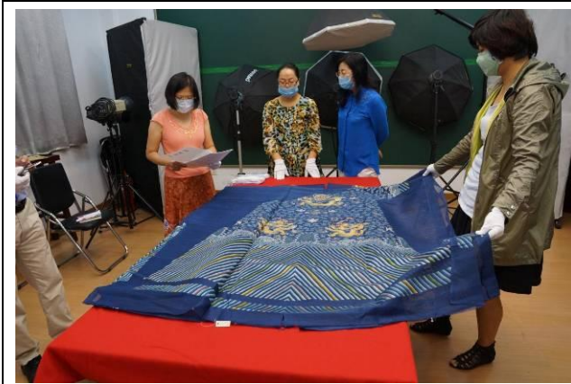
3. 清藍紗彩納雲幅八寶金龍袍料 全長 318 公分，寬 146 公分