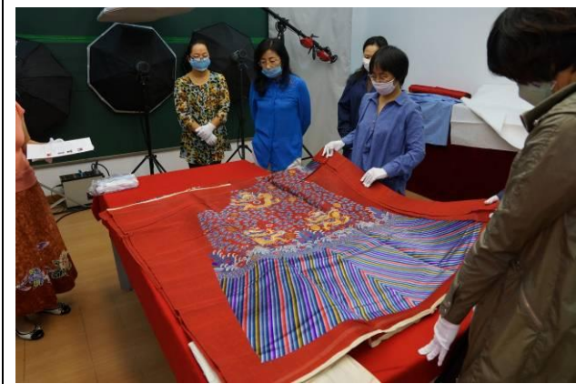
4. 清紅色納紗彩雲幅金龍袍料 全長 304 公分，寬 150 公分