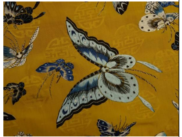
12. 清 黃萬壽團紋地 刺繡百蝶女服細部