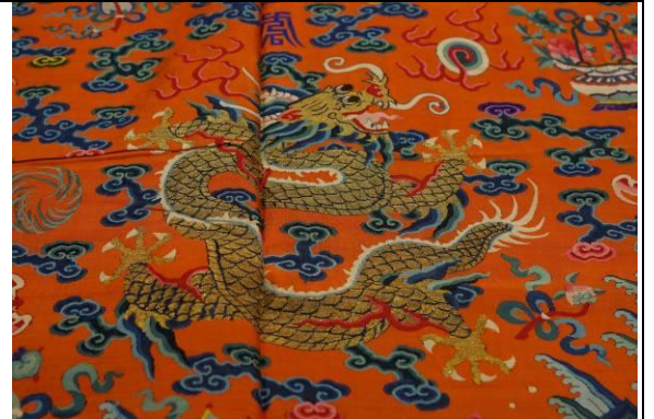
7. 清杏黃緞絲五彩雲幅暗八仙金龍袍料細部