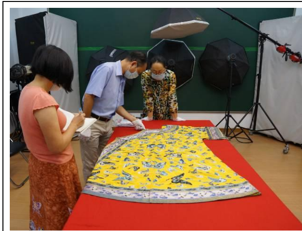
12. 清 黃萬壽團紋地 刺繡百蝶女服 長 140 公分，寬 79 公分