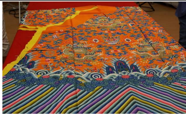
7. 清杏黃緞絲五彩雲幅暗八仙金龍袍料 全長 300 公分，全寬 134.5 公分。