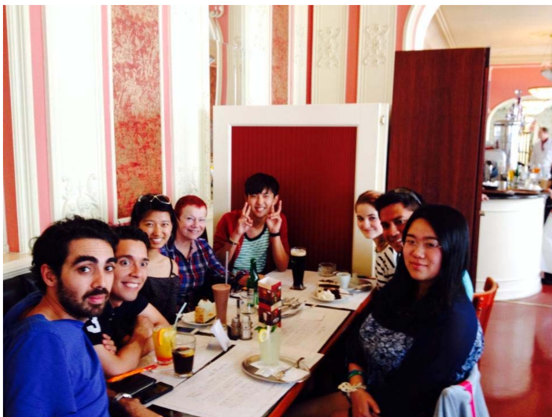
(照片說明：和夏季學校老師與同學一同喝下午茶。)

這真是收穫滿滿的行程，夏季學校的老師很瘋狂很好玩，雖然我被分到捷克文初級班，好像是幼幼班，但是依然學到不少實用的捷克文！我的捷克文也在短短的時間內突飛猛進！比較可惜的是，來唸暑期課程的都是外國人，在課堂上碰不到本地捷克人，只有在課堂外的其他活動中才結識到一些捷克人，但是和課堂上的朋友絕大部分時間還是在用英文，也好，英文和捷克文都可以同時加強！在布拉格生活也讓我認識了我之前所不知道的捷克，書本和教室裡所教導的捷克，還是真的需要用雙腳走一遭，才能有更深層更進一步的體會！無論如何，有這個機會可以認識世界各地的好朋友以及獲取新知真的很令人開心！