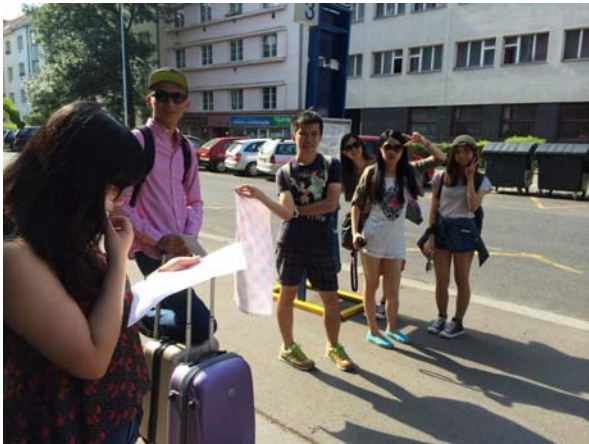
(照片說明：前往 Karlovy Vary。)