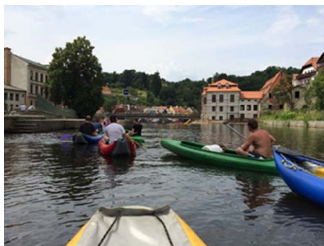
(照片說明：Český Krumlov 泛舟。)