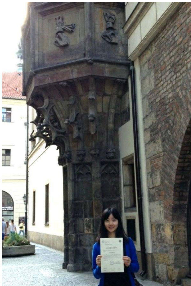
(照片說明：夏季學校結業證書。)

我想，收拾行囊準備回台灣的那一晚，在超重的行李裡打包的除了簡單衣物、幾疊台灣難以買到的捷克文書籍、許多各具意義的紀念品外，腦袋裡也裝滿了的珍貴的收穫、想法和回憶。我能感受到內心產生的新想法或變化：不管是因接觸到嶄新事物得到的啟發，和異國同學交談獲得的新視野，或者從這個專業充實的暑期學校習得的寶貴知識；就算旅程只有一段不長的時間，卻也足夠讓人漸漸產生對於將來的想法和期望。布拉格很美很美，夜裡的她更是會令人流連忘返的美麗。我想有一天我們會帶著自己的改變，以自己期望的方式，再度拜訪那裡。