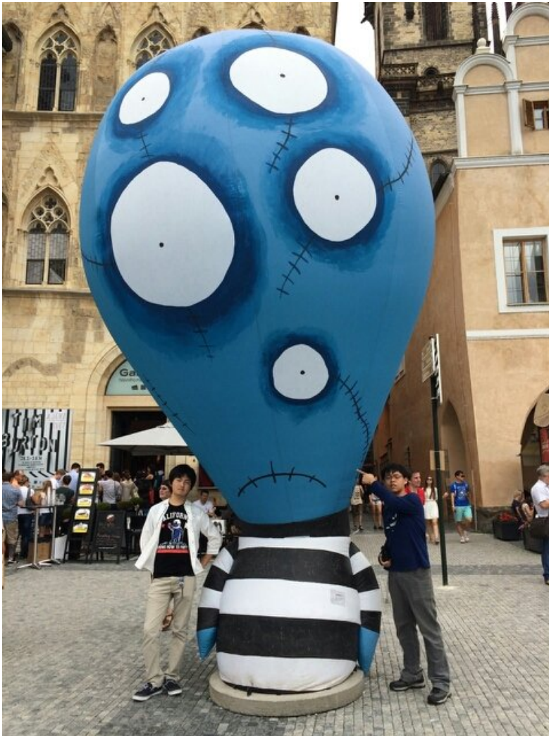
(照片說明：布拉格舊城廣場。)

當初進入斯語系就是針對斯語系有捷克語課程這一點才申請了，就讀大學的三年間由於資訊不足的關係錯失了很多次體驗捷克生活的機會，到了大三暑假，總算能親眼看看捷克，體驗捷克風情。美麗的風景與舒適的氣候，還有好吃的馬鈴薯。雖然沒有台灣那麼方便，卻是一個非常適合居住的國家。