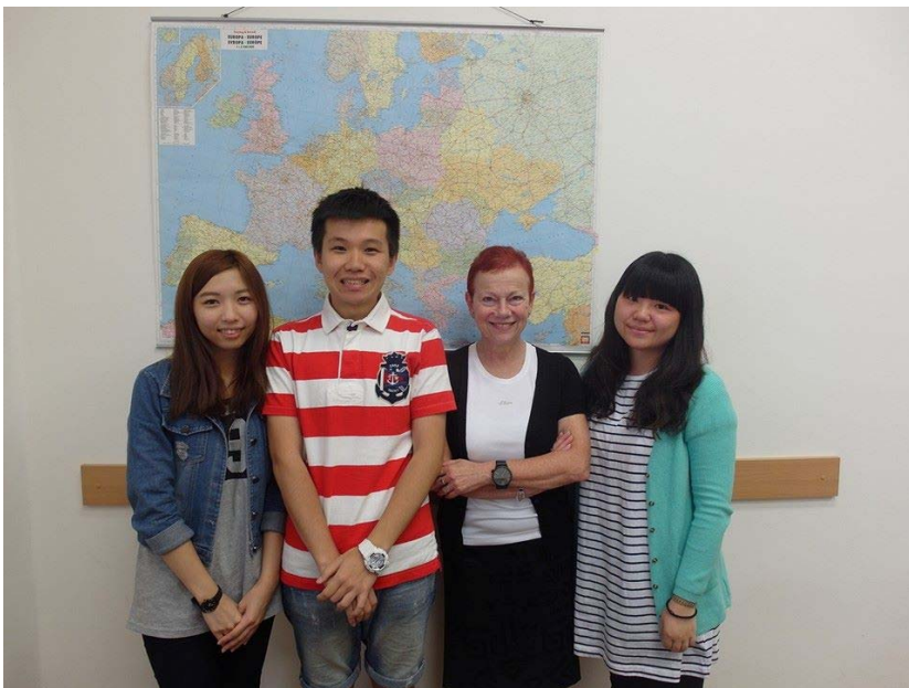
(照片說明：與夏季學校老師合影。)