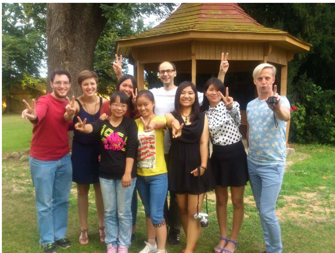
(照片說明：和夏季學校同學合影。)