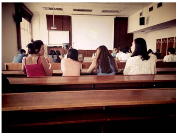
(照片說明：課程教室一景。)