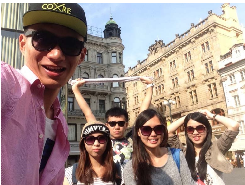
(照片說明：布拉格街景。)

希望在不久的將來，我可以再度回到這個城市、這個國家，期待那時的我可以有更好的裝備，可以更好地認識這美麗的人們和文化。