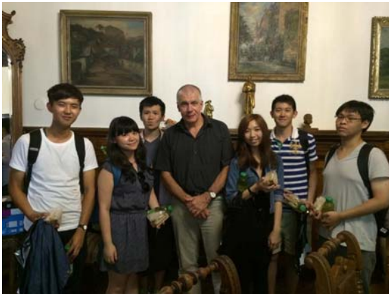
(照片說明：拜會 Kutna Hora 市長與市政府。)