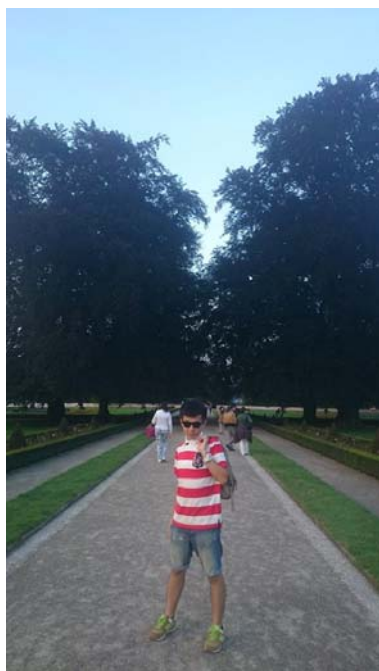
(照片說明：Český Krumlov 戶外音樂會一景。)

這趟旅行真的很值得，我們除了旅行外，更具意義的是我們透學習捷克文來了解一個民族，體驗他們的文化，學習不同民族值得學習的地方，我想這就是學習外語最難能可貴的地方！