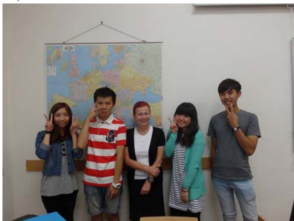
(照片說明：與夏季學校老師合影。)