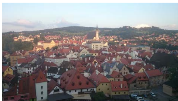
(照片說明：鳥瞰 Český Krumlov。)

其實從捷克回台灣後有點混亂有點恐慌，一來是因為俄文完全大退步都跟捷克文搞混但又必須一直提醒自己主修的是俄文，二來是因為發現一起上暑期語言學校的來自世界各國的同學們幾乎每個都對自己的未來很有理想和規劃，而且很多都是精通三國甚至四國的語言。雖然會突然對自己很沒信心，卻也深深被影響和激勵，想跟他們一樣對自己的人生充滿熱情，想好好地認真地為自己的未來努力，我想這就是走出自己國家看看這世界最大的收穫。