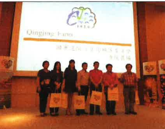
清境農場致贈禮品予當地旅行社