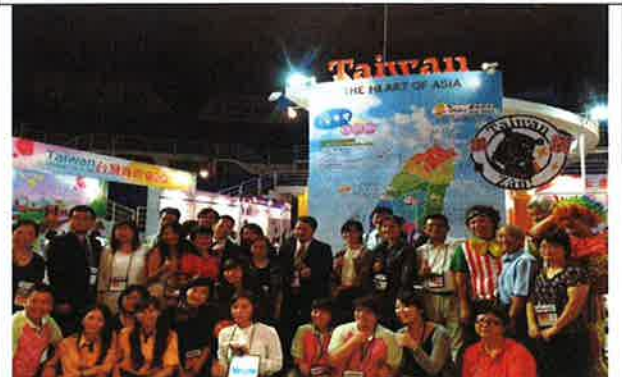
臺灣觀光推廣代表團於臺灣展攤前合影