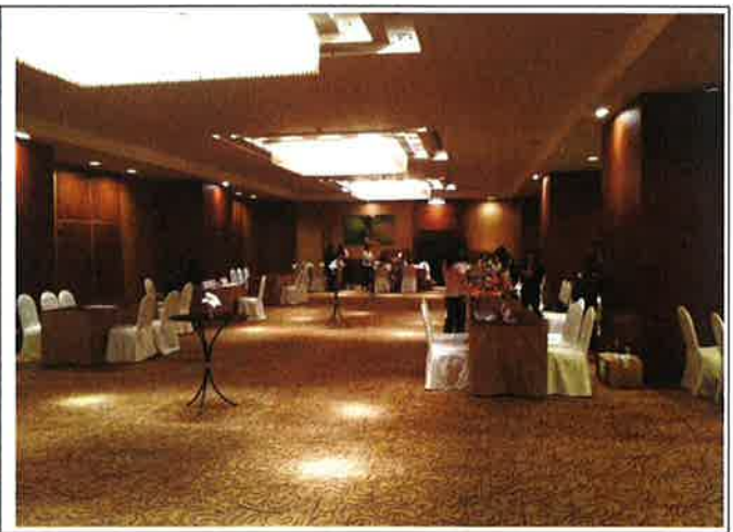
推廣會上農場之展位