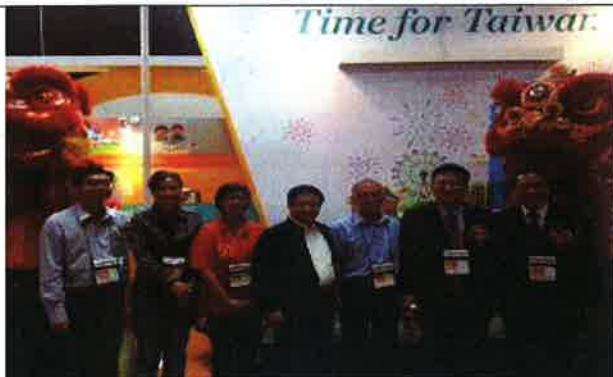
與馬來西亞華人旅遊業公會檳城分會等人合影