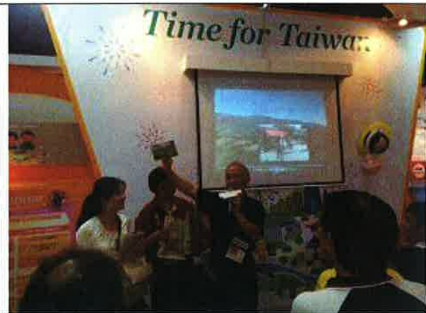
於臺灣館小舞台上進行有獎徵答，馬國民眾反應熱烈