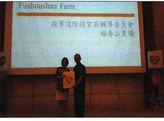
福壽山農場致贈禮品予當地旅行社