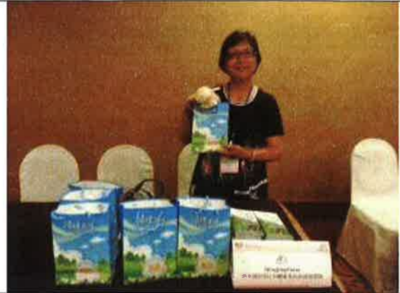
臺灣觀光推廣會場地