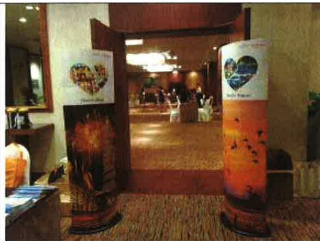
臺灣觀光推廣會場地