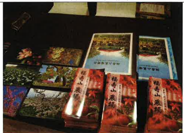
農場展位相關摺頁及紀念品