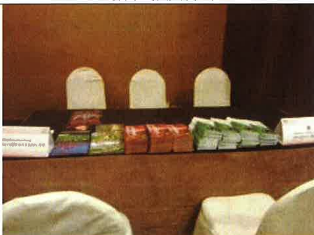
農場展位相關摺頁及風景名片