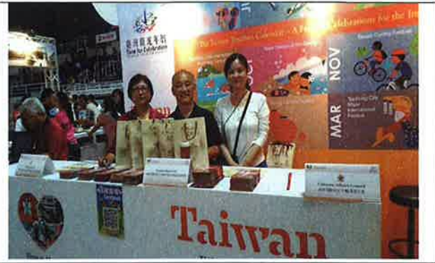
本會展位暨參展人員