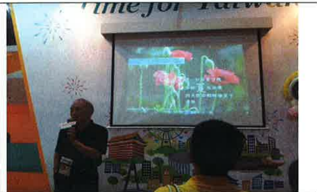
臺灣館小舞台電視螢幕播放本會農場影片